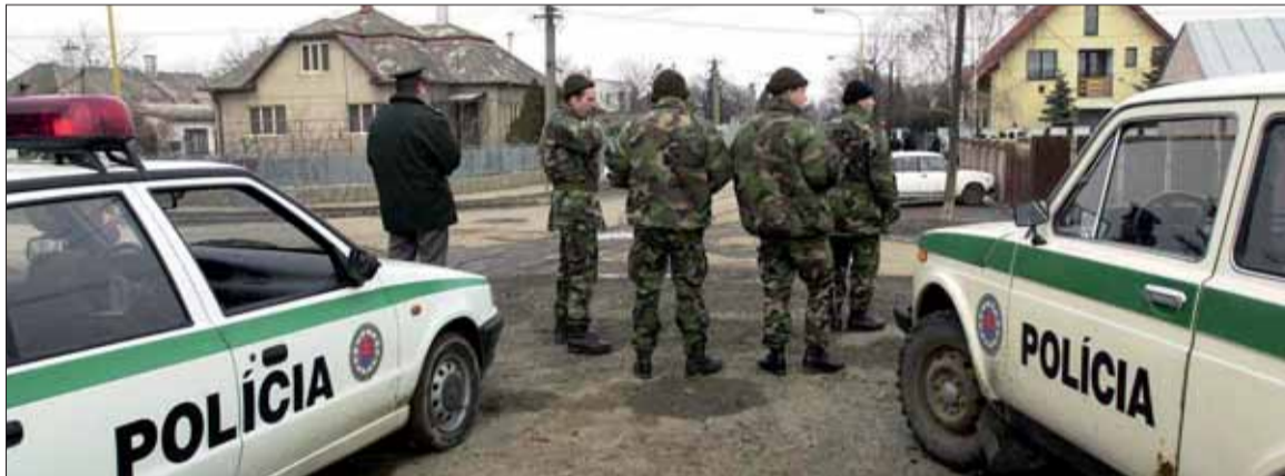
V prípade podozrivého správania sa neznámych ľudí treba zavolať políciu.

ich návšteva oprávnená a v prípade pochybností radšej ponúkanú službu odmietnuť. „Bez konzultácie s príbuznými alebo právnikom nepodpisujte dokumenty s neznámymi osobami, ktoré môžu zneužiť nevedomosť a zníženú schopnosť rozpoznávať dôsledky konania staršej osoby,“ upozorňuje polícia. Tiež treba odmietnuť bezdôvodne ponúkanú pomoc, o ktorú sami nepožiadate, pod zámienkou ktorej sa páchatelia častokrát snažia dostať do bytu. „V prítomnosti neznámych osôb