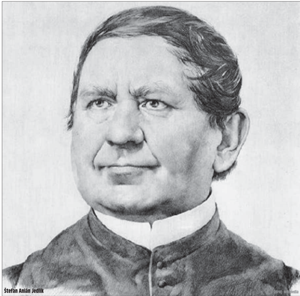
Štefan Anián Jedlik