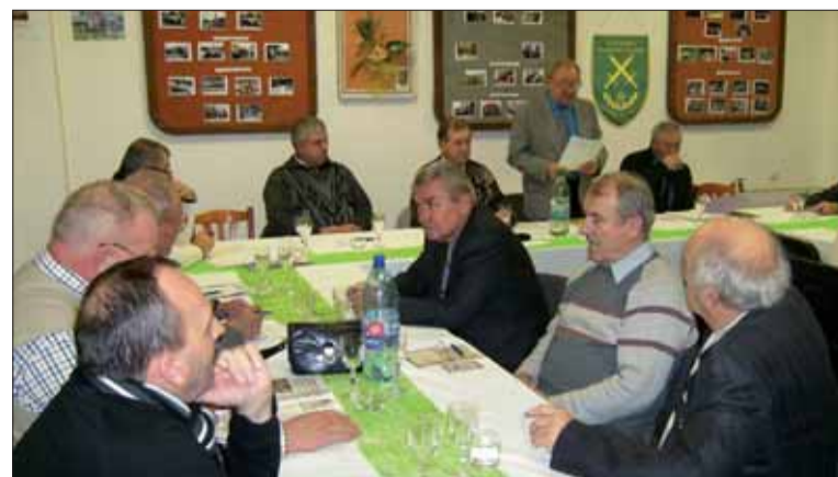
Oblastný výbor SZPB v Prešove hodnotil svoju činnosť. Ilustr. foto: red