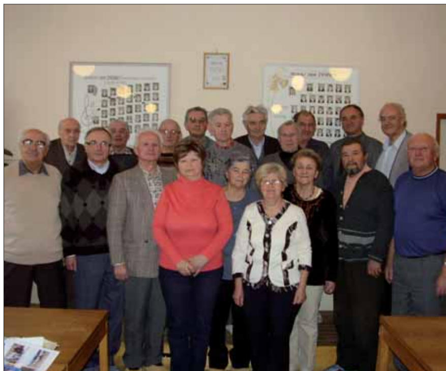
Predsedníctvo OblV SZPB v Novom Meste nad Váhom.