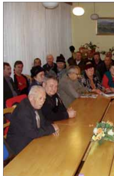
Členovia ZO SZPB Medzilaborce.