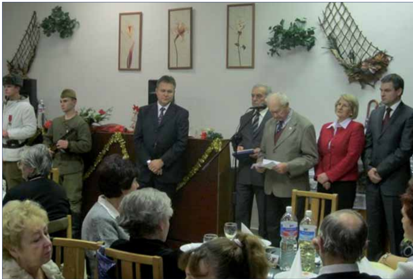
Spomienka na partizánske Vianoce 1944 v Banskej Bystrici.