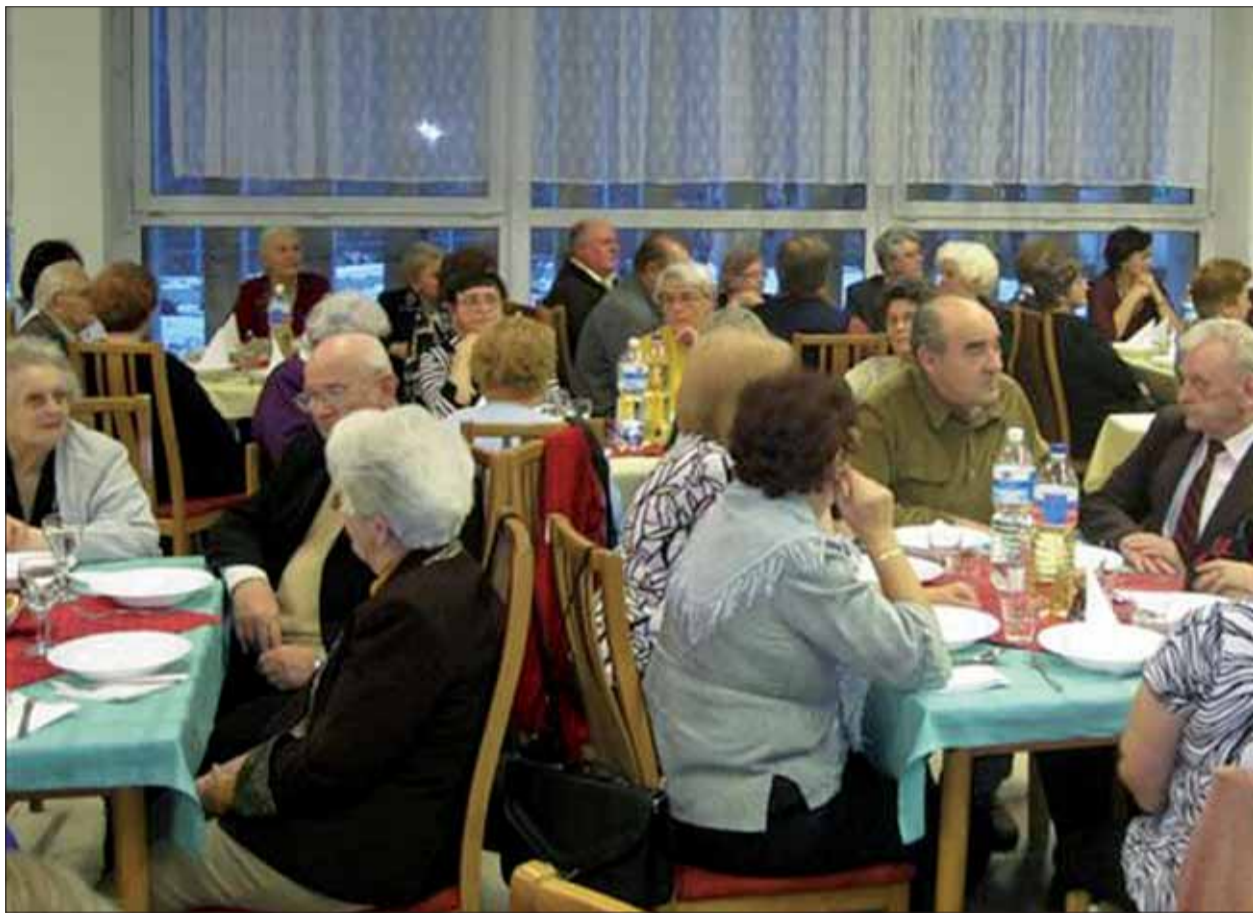
Na partizánske Vianoce spomínalo mnoho ľudí.