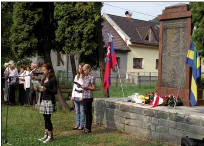
Hriňovčania nezabúdajú na vojnové udalosti počas celého roka.