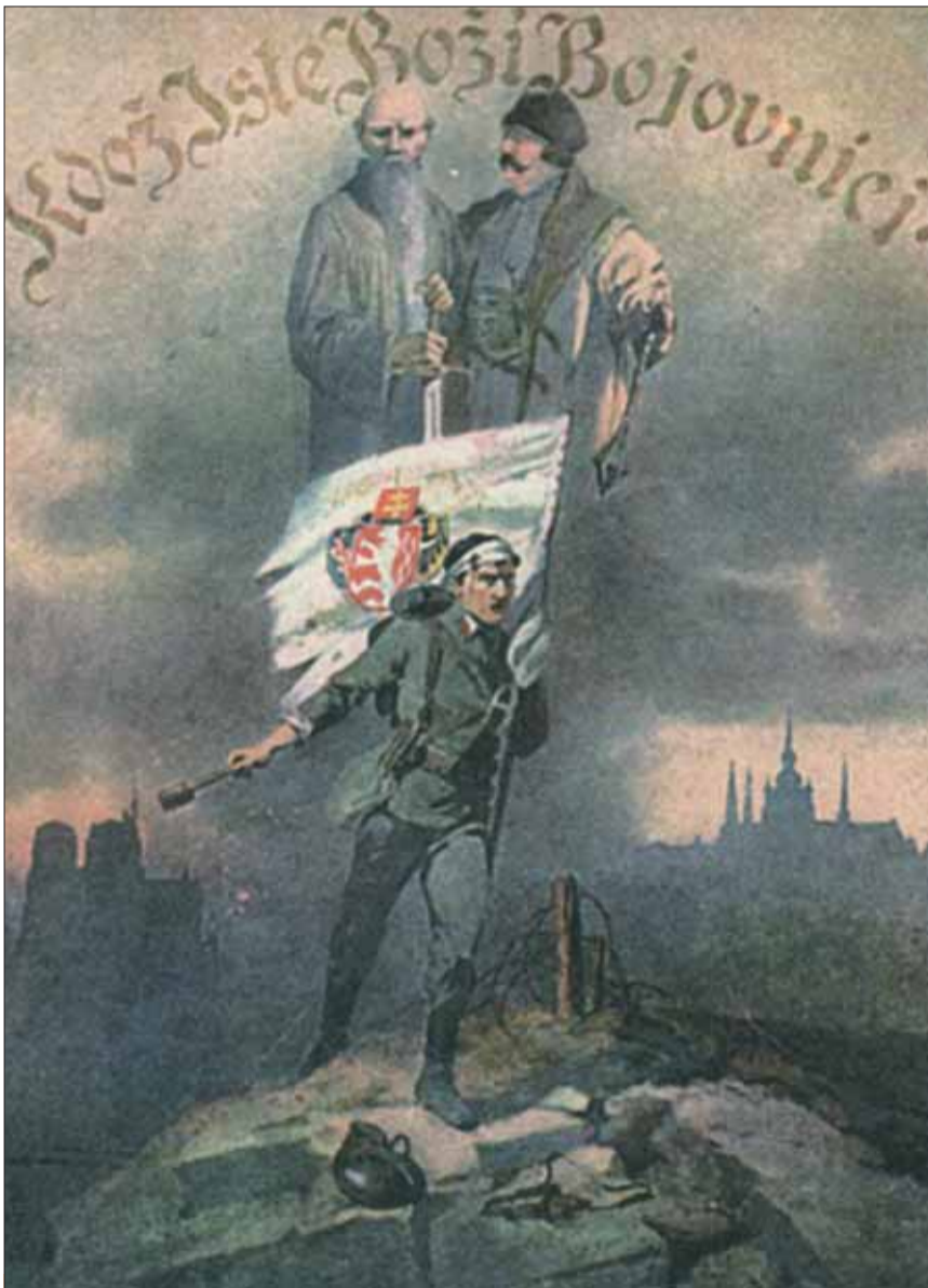
Plagát légii z ich dobovej tlače.