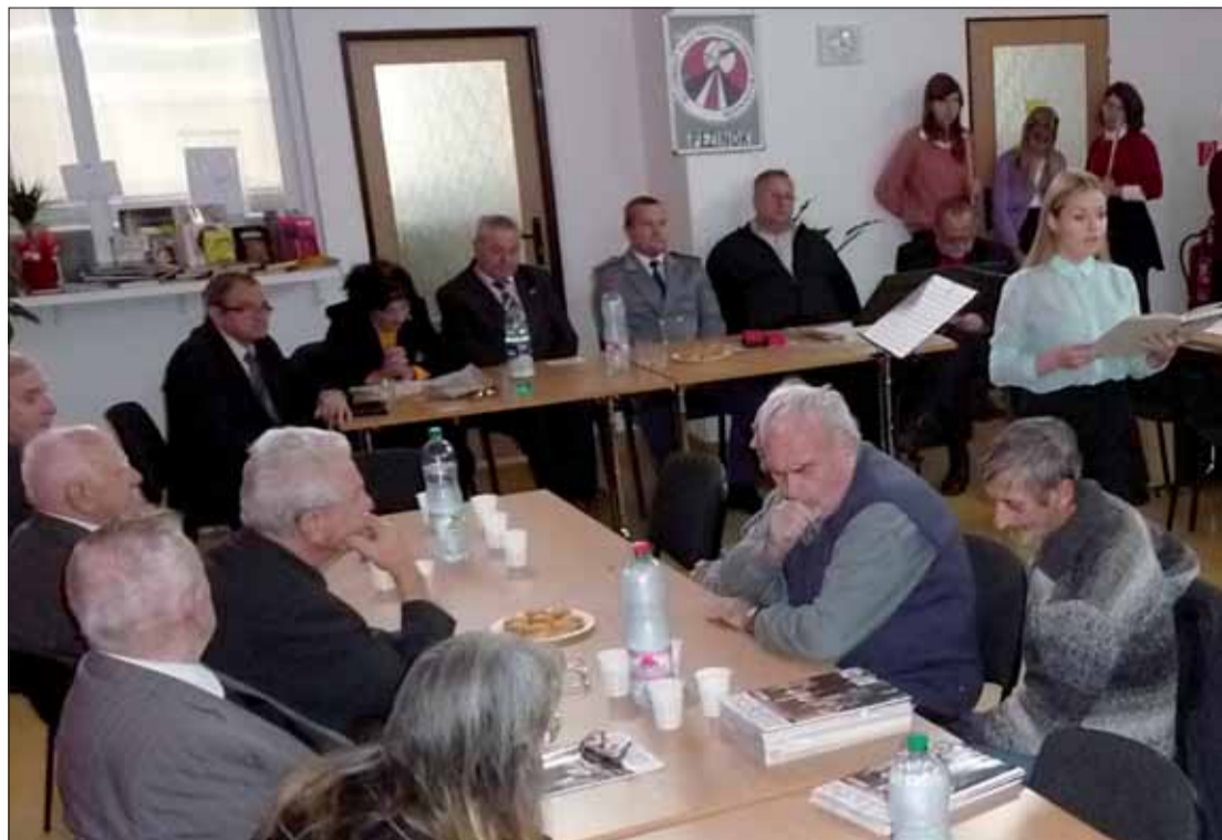
Na začiatku sa predstavili žiaci zo ZUŠ Eugena Suchoňa.