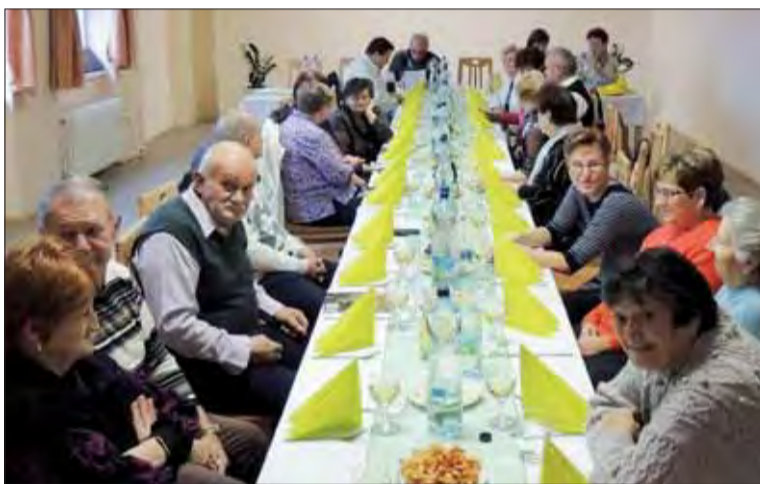
Poltárska organizácia je stabilizovaná.