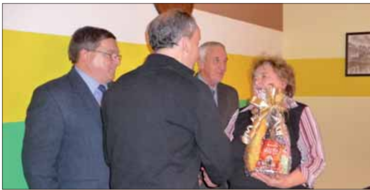
Dobrá Niva pod staronovým vedením.