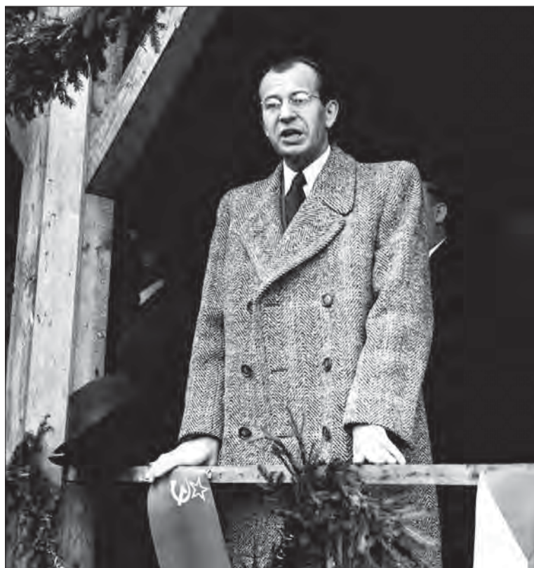
Na archívnej snímke z 1. mája 1947 predseda slovenských povereníkov Gustáv Husák počas prejavu pri príležitosti osláv Sviatku práce v Ružomberku.

Vo februári 1951 ho zatkli a v apríli 1954 odsúdili za buržoázny nacionalizmus, v roku 1960 ho prepustili na slobodu, v roku 1963