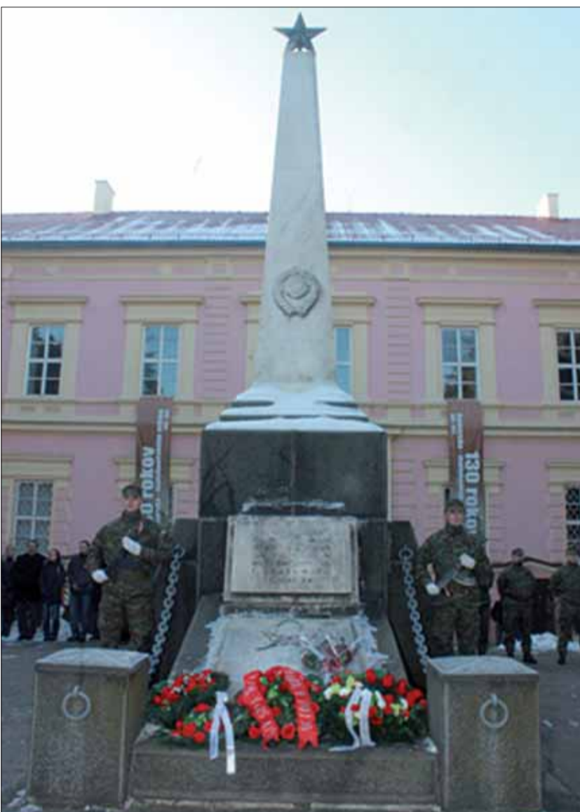
Príchod slobody do Rimavskej Soboty dnes pripomínajú vence pri pamätníku.