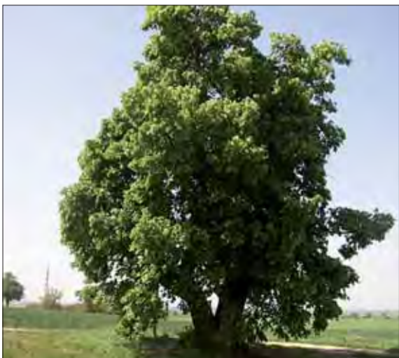
Košatá lipa bývala svedkom rozprávania záhadnej cigánky. Ilustr. foto: wikipedia