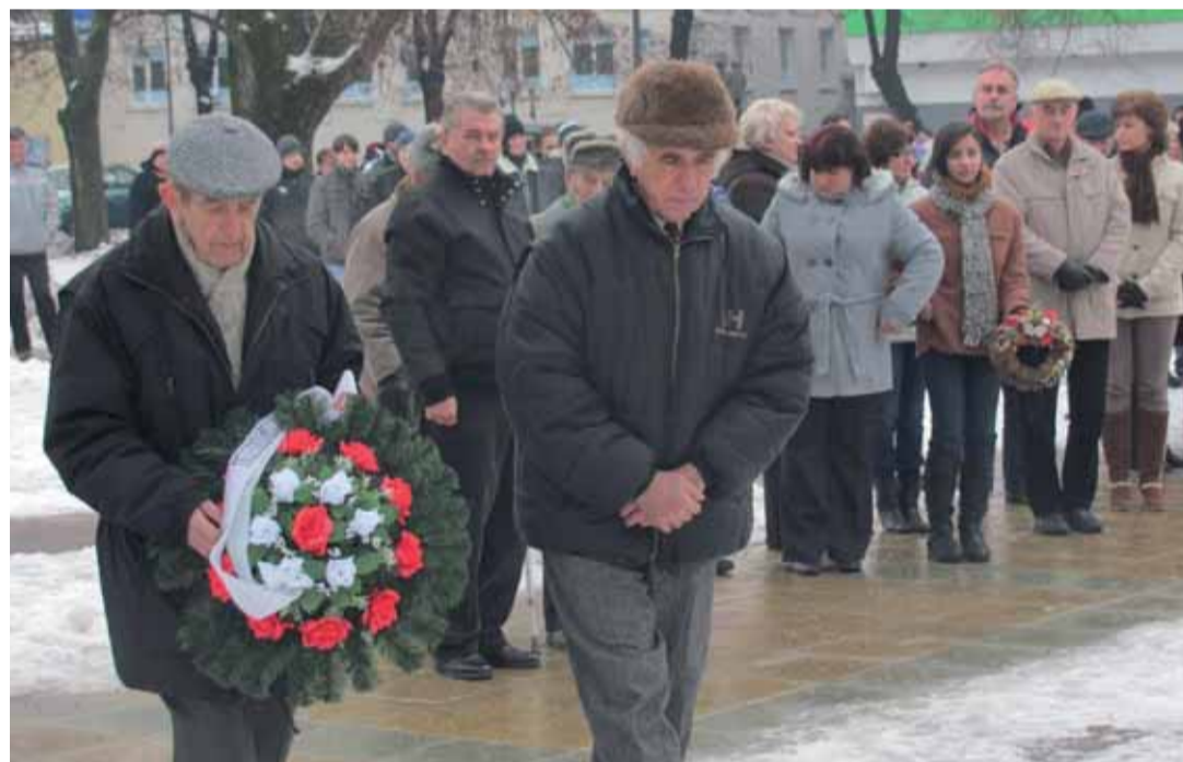
V Tornali si pripomenuli oslobodenie mesta.