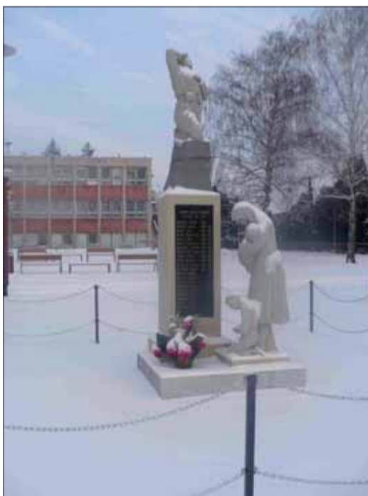
Pohľad na pamätník v Báhoni v zime.