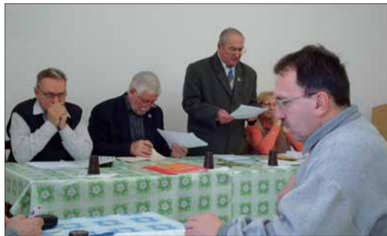
V Brezne hodnotili uplynulý rok.

Spokojnosť nie je možné vysloviť s odberom dvojtyždenníka Bojovník a Ročenky odbojára.