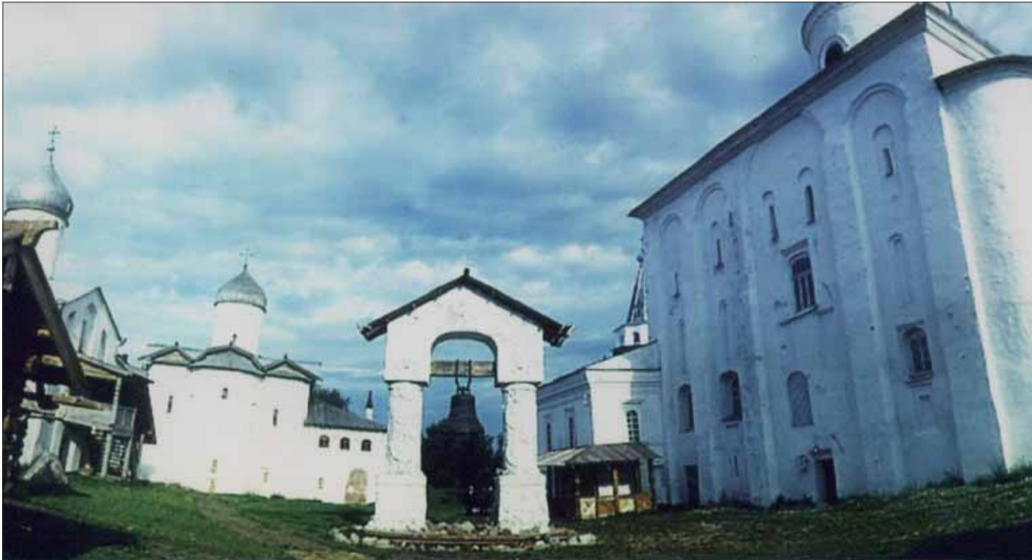
Zvonica v Novgorode.

V priebehu 11.–17. storočia sa písali Novgorodské letopisy venované dejinám Novgorodu a celého Ruska. Zachovali sa v piatich vydaniach.