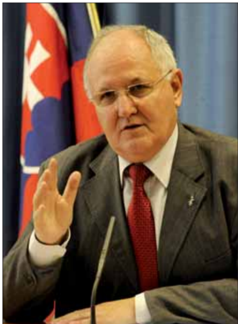
Minister školstva Dušan Čaplovič.

„Konferencia pri príležitosti 20. výročia vzniku samostatnej SR sa koná v priestoroch historickej budovy Národnej rady SR. Veď práve tu poslanci Slovenskej národnej rady 17. júla 1992 prijali Deklaráciu SNR o zvrchovanosti SR a 1. septem-