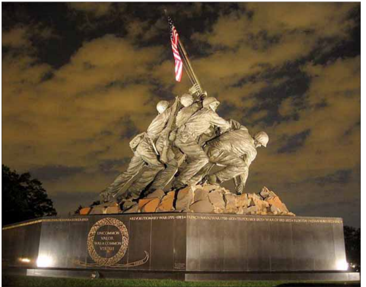
Súsošie na Arlingtongskom národnom cintoríne vo Washingtone.

Ďalší chlapík, tretí chlapec v tomto table, bol seržant námornej pechoty Mike Strank (rodák z obce Jarabina v okrese Stará Ľubovňa, kde na rodnom dome otca bola odhalená pamätná tabuľa ser. Michalovi Strankovi, pozn. autora). Mike je môj hrdina. Bol hrdinom všetkých týchto chalanov. Hovorili mu „starý muž“, pretože bol tak starý. Bol už 24-ročný. Keď mal Mike motivovať svojich chlapcov v tréningovom kempe, nikdy nehovoril „Poďme zabiť nejakých Japoncov“, ale hovoril „Poďme zomrieť za našu krajinu“. On vedel, čo hovorí s mladými chlapcami. Namiesto toho vravel, „Urobíte, čo hovorím, a ja vás dostanem domov k vašim matkám.“