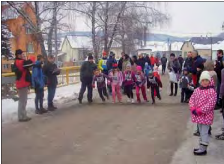
Na štart memoriálu sa postavili aj deti.