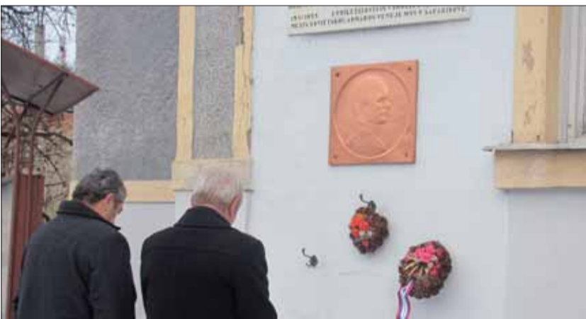
Na budove, kde mal štáb veliteľ UKF maršal ZSSR R. J. Malinovskij na ulici Letnej v Tornali, pri jeho pamätnej doske a reliéfe.