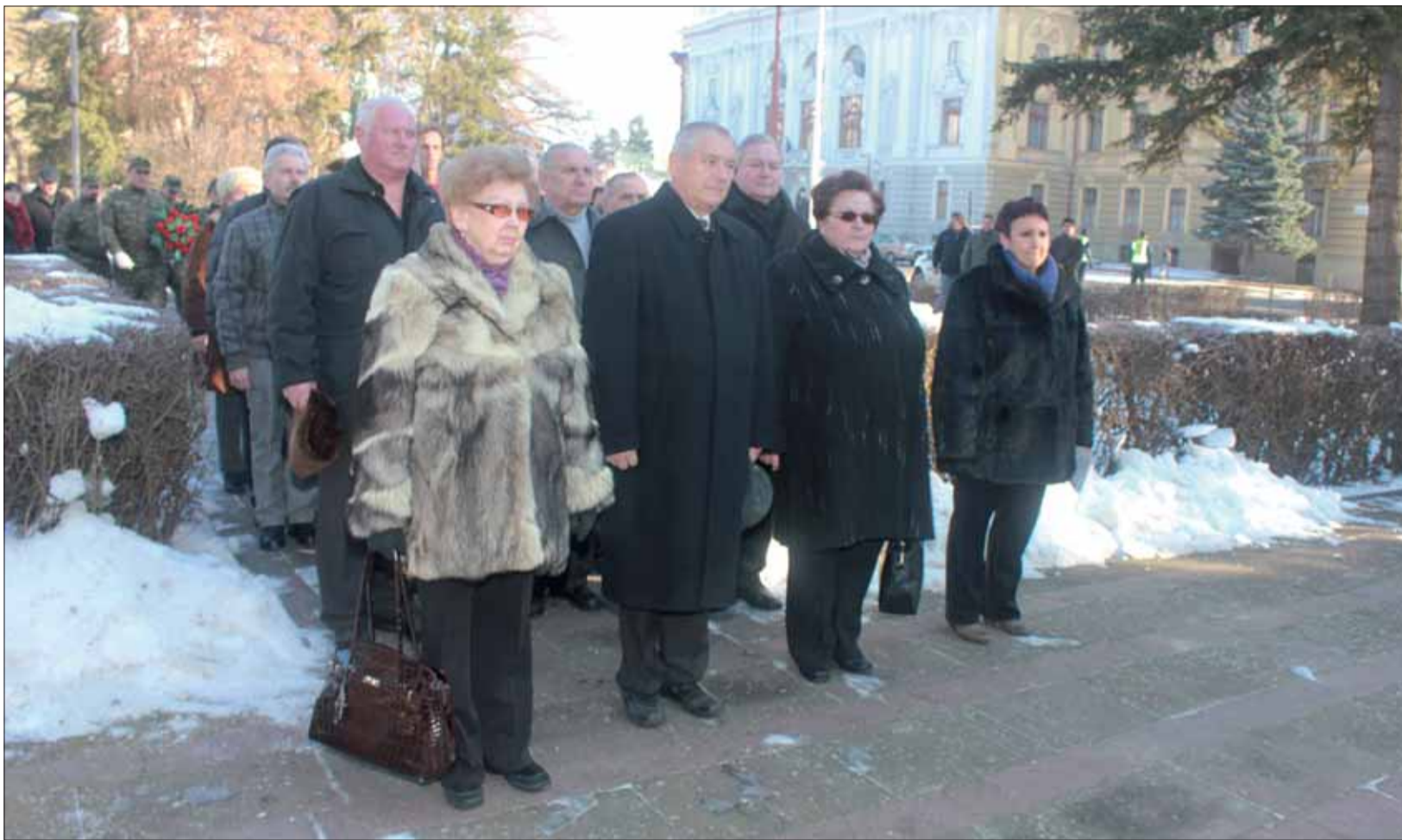
Obyvatelia Rimavskej Soboty si pripomenuli oslobodenie mesta.