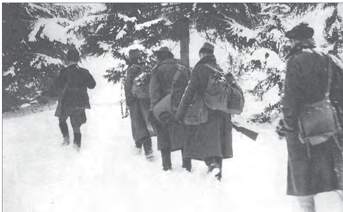
Partizáni v horách.