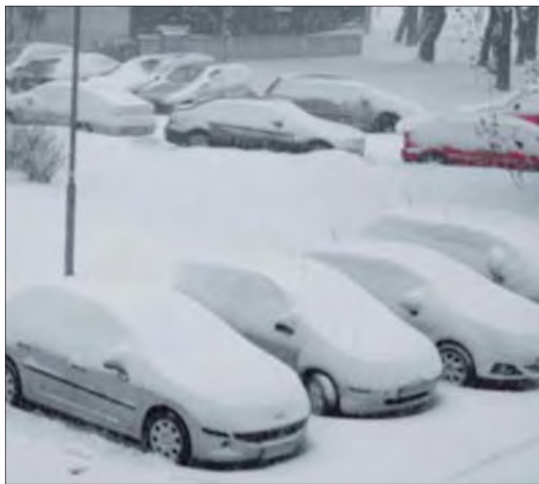
Predtým, ako sa vydáme na cestu, treba auto očistiť od snehu.

V zimných mesiacoch majú motoristi starosti aj so štartovaním. „V prípade, že máte tú možnosť, zaparkujte svoje auto v garáži, pod krytým prístreškom, alebo v závetrí domu. Pri parkovaní nepoužívajte ručnú brzdú. Kolesá radšej vytočte smerom k obrubníku alebo ich podložte kameňom. Využívajte buď palivá s pridanými aditívami proti mrazu alebo ich do paliva pridajte ešte pred tankovaním benzínu alebo nafty. Pri kúpe sa poraďte s odborníkom. Majte taktiež doplna natankovanú nádrž a tankujte na preverených čerpacích stanicách,“ dodáva.