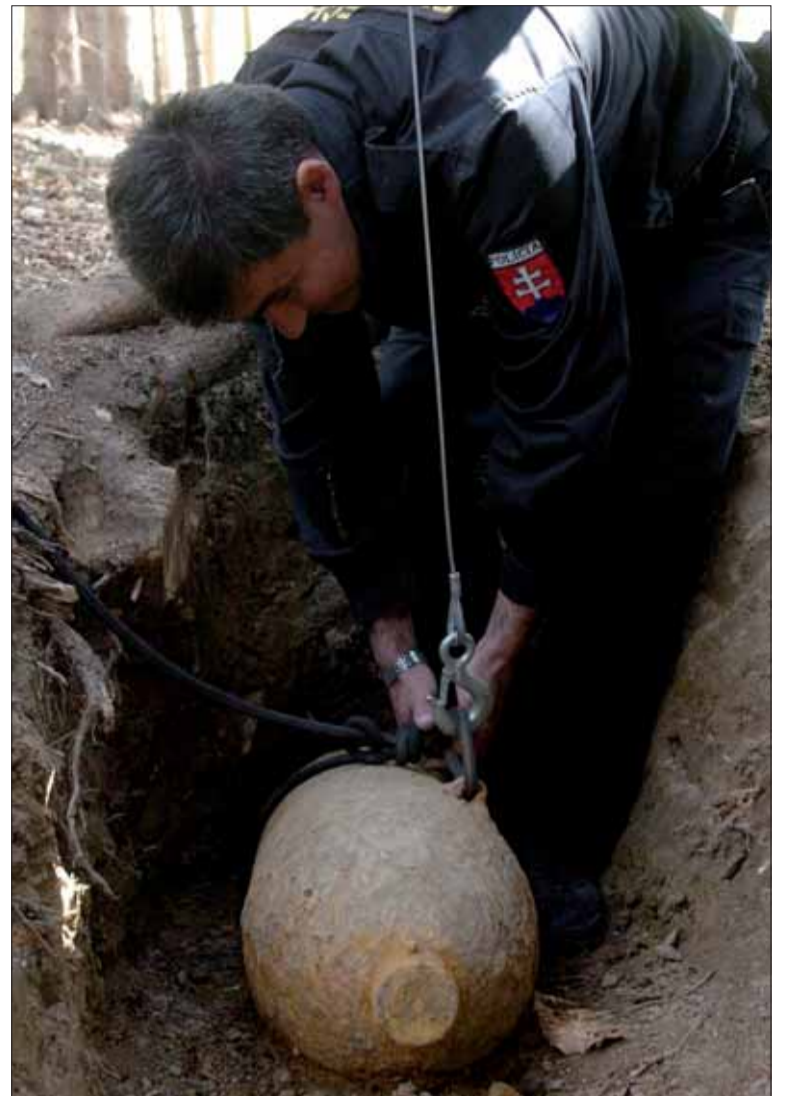
Nevybuchnutú muníciu z čias druhej svetovej vojny nachádzajú ľudia po celom Slovensku dodnes.