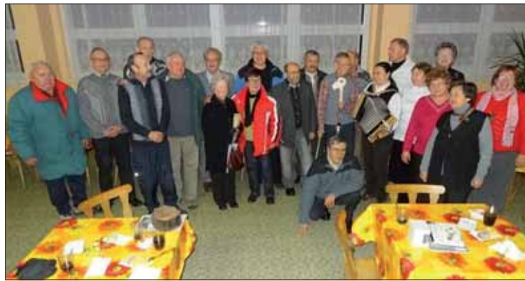
Brezňania bilancovali a naplánovali aktivity na rok 2014.

Cieľ jarných vychádzok v roku 2014 chceme smerovať pod Čierne vrch, kopec nad bývalým povstaleckým letiskom Rohozná-