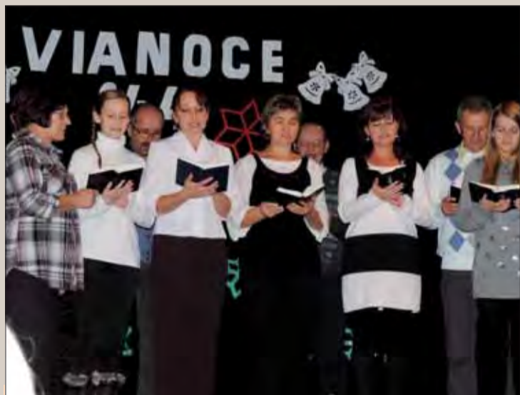
Podujatie spríjemnil pekný kultúrny program.

Tento príjemný spomienkový večer bol obohatený kultúrnym programom, v ktorom vystúpili žiaci zo ZŠ s MŠ Štefana Žáryho v Ponikách a spevácka skupina folklórneho súboru Poničan s Poník, ktorá bola sprevádzaná nádhernou hudbou na