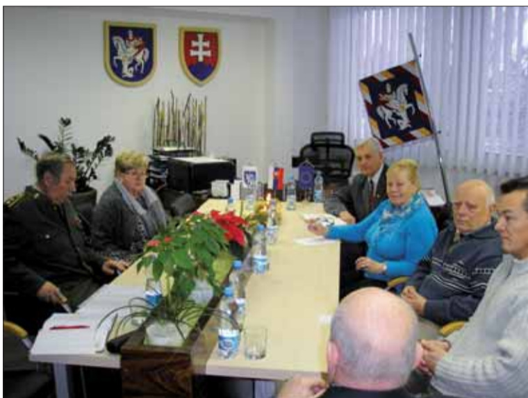
Stretnutie delegácií ČSBS, SZPB a ČsOL v Martine.