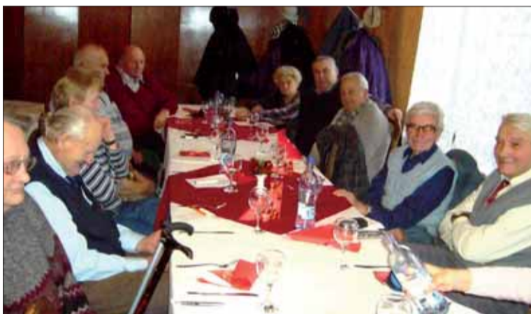
Zasadnutie ObV SZPB v Lučenci.