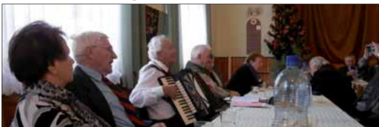
ZO SZPB Jána Rýsa v B. Bystrici hodnotila i spomínala.

ZO SZPB Jána Rýsa, Tieda SNP, Banská Bystrica (Pre Bojovník bez nároku na honorár)