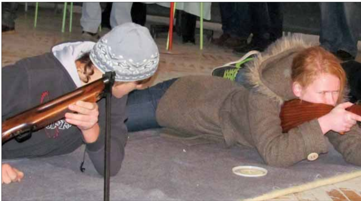
Na memoriáli maršala Malinovského súťažili aj dievčatá. A úspešne.