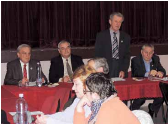
V Ponikách hodnotili.