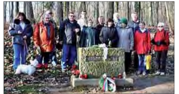
Pietna spomienka v Dušovej doline.