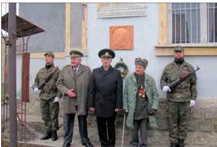
V Tornali si pripomenuli oslobodenie mesta.