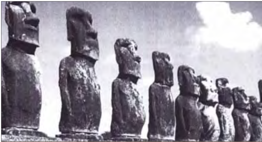
Sochy na Veľkonočnom ostrove.