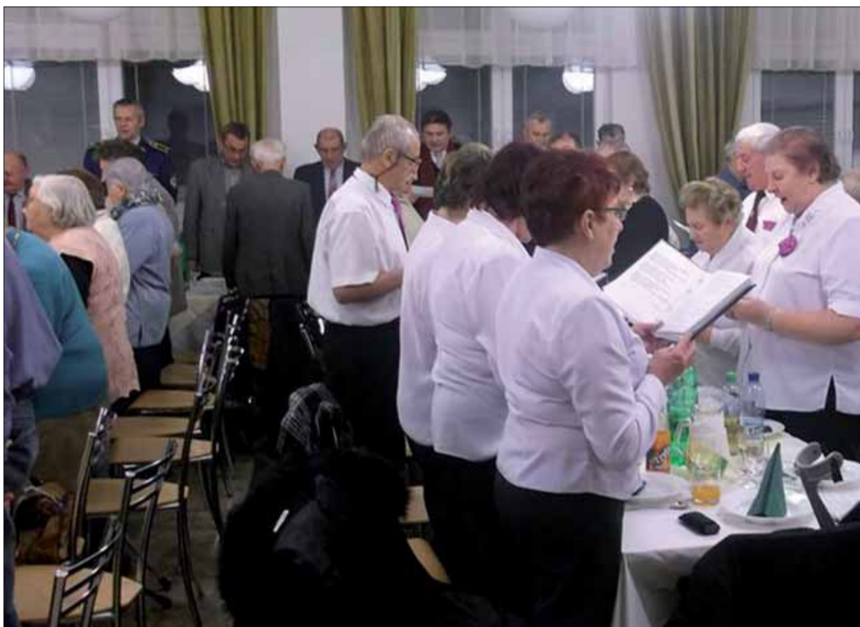
Zvolenčania sa rozlúčili s rokom 2013 slávnostne.