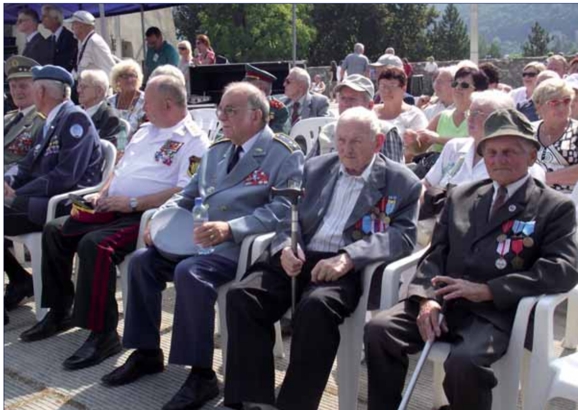
Starších ľudí vníma pozitívne až 61 percent obyvateľov Európskej únie.

Prieskum Európskej komisie tiež odhalil, že až 83 percent Slovákov skôr nesúhlasí alebo rozhodne nesúhlasí s tým, aby sa do roku 2030 zvyšoval vek odchodu do dôchodku. V EÚ by pritom takúto zmenu podporila približne tretina opýtaných.