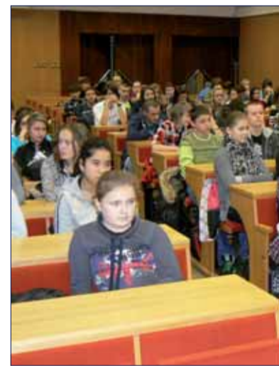
Beseda so žiakmi ZŠ v okrese Vran