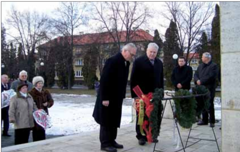
Oslavy oslobodenia Poltára.