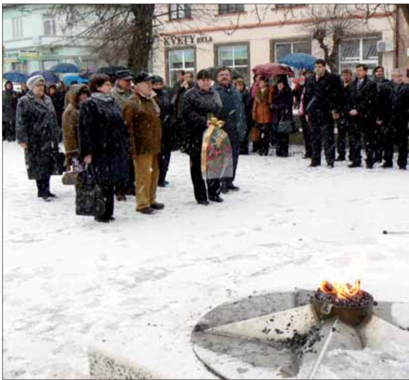
Oslavy oslobodenia vo Vranove nad Topľou.