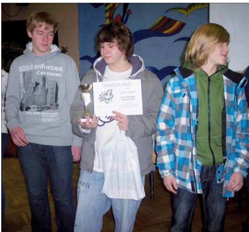
Vítazi súťaže, žiaci ZŠ Pavla Dobšinského, družstvo č. 1.