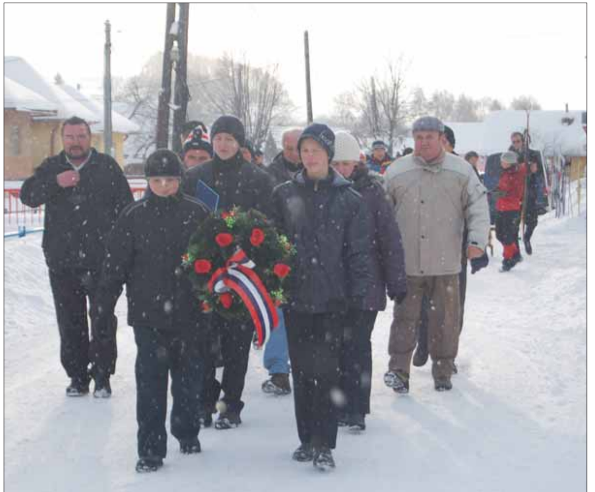
Účastníci pietnej spomienky v Jarabine.

V čase od 21. januára do 25. januára 1945 boli oslobodené všet-