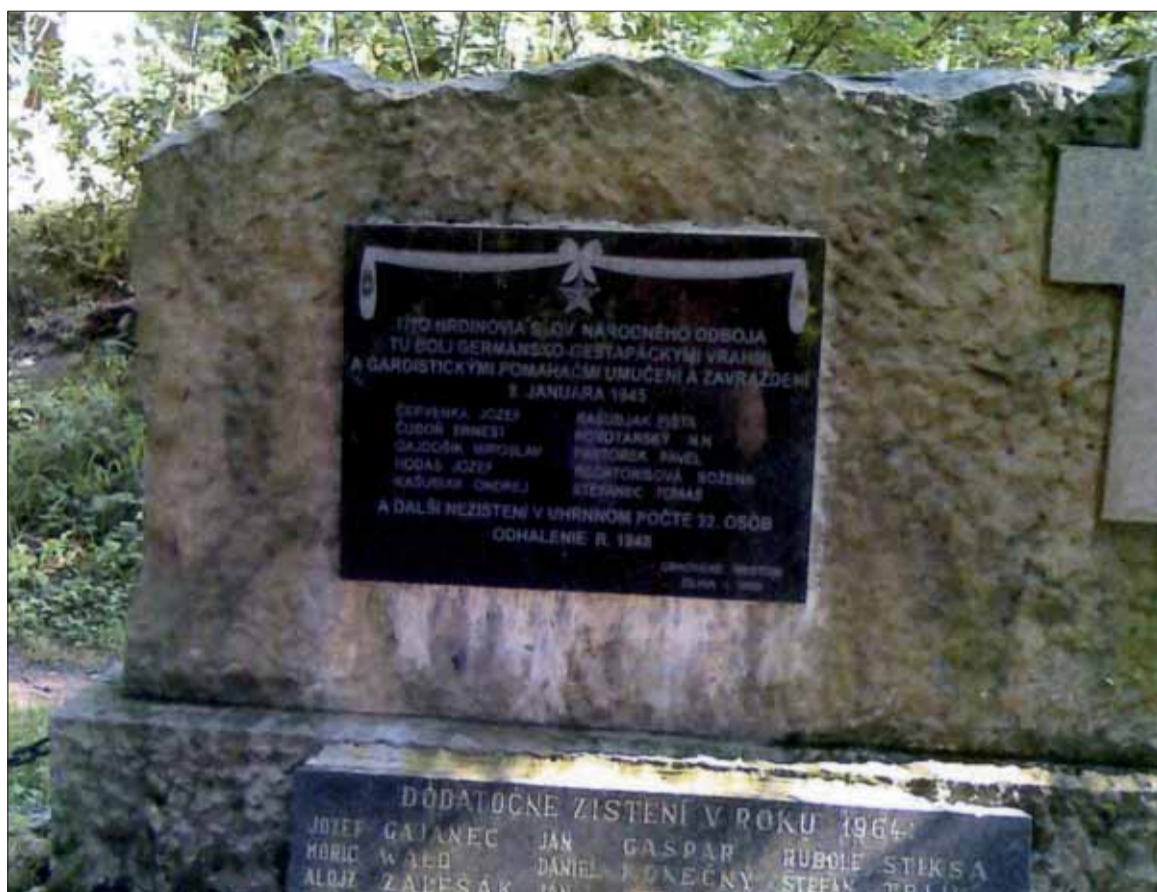
Pamätník Chrasť Žilina

Poslednú hromadnú vraždu na tomto mieste príslušníci z Einsatzkommando 13 oporného bodu