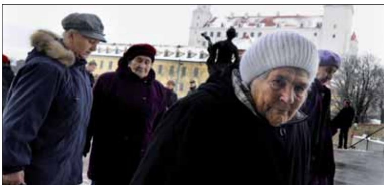
Páchatelia si často vyhládnu svoju obeť na ulici.