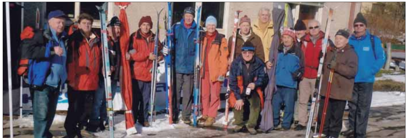
Priami účastníci vojny, ktorí tohto roku pretekali na Bielej stope.

Pre nás členov Slovenského zväzu protifašistických (Pokračovanie na str. 2)