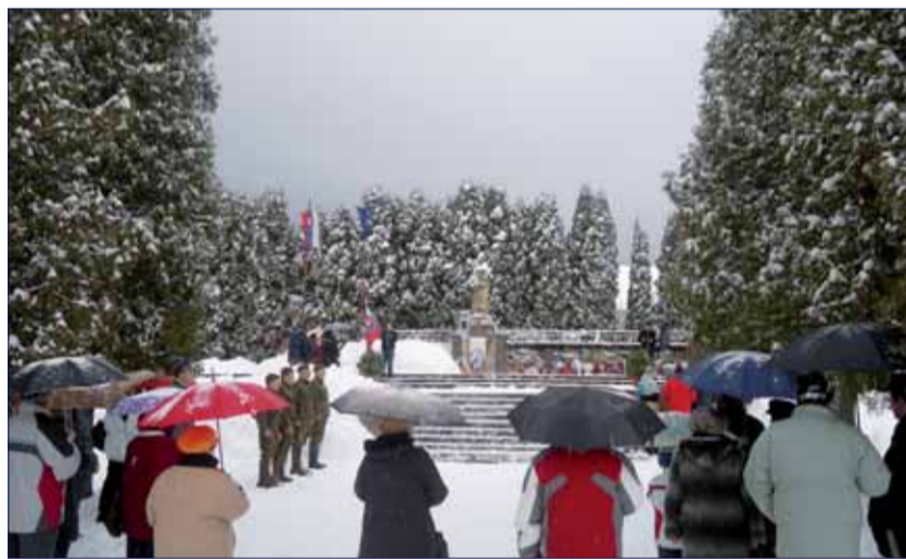
Pietna spomienka v pri pomníku v Kláku.