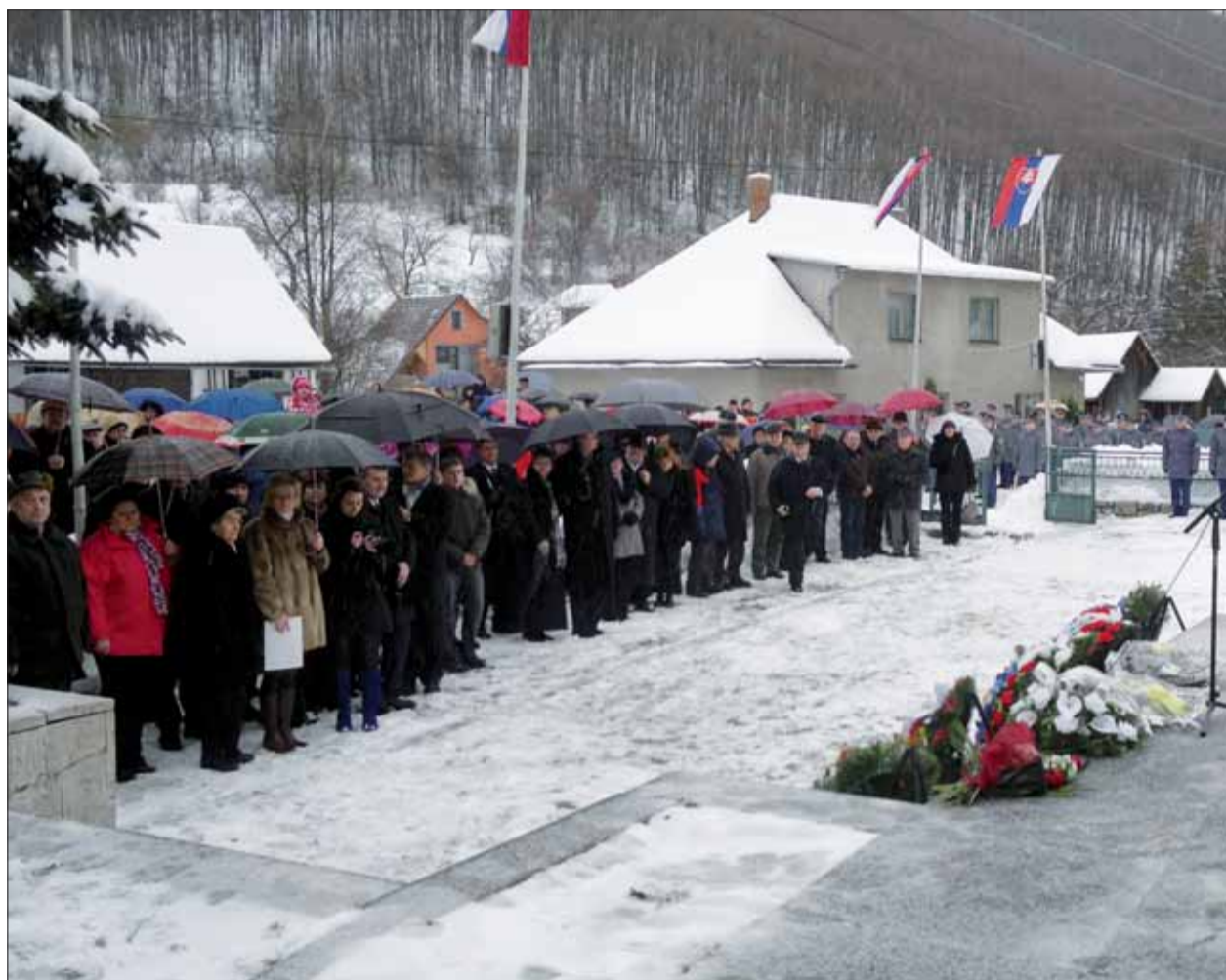
Účastníci pietneho zhromaždenia v Ostrom Grúni.