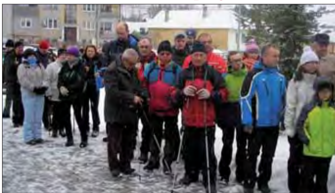
Nápad Jarabiny a Litmanovej spojil nielen obce, ale aj všetky generácie.