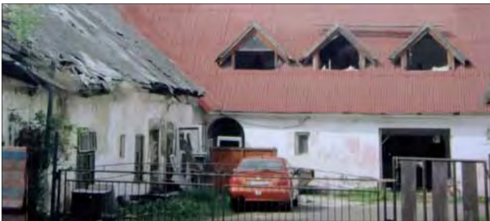
Budova pred mestom Lipt. Hrádok, zvaná Pálenica, na ktorú bola sústredená delostrelecká paľba a útok pri oslobodzovaní mesta. Nemecké Tigre pálili spoza starej časti budovy (vľavo).

vedľajšej Liptovskej Porúbky, pretože po oslobodení, keď išli do Hrádku, prechádzali popri starej budove zvanej Pálenica.