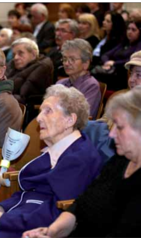
e Oblastného výboru SZPB v Košiciach.