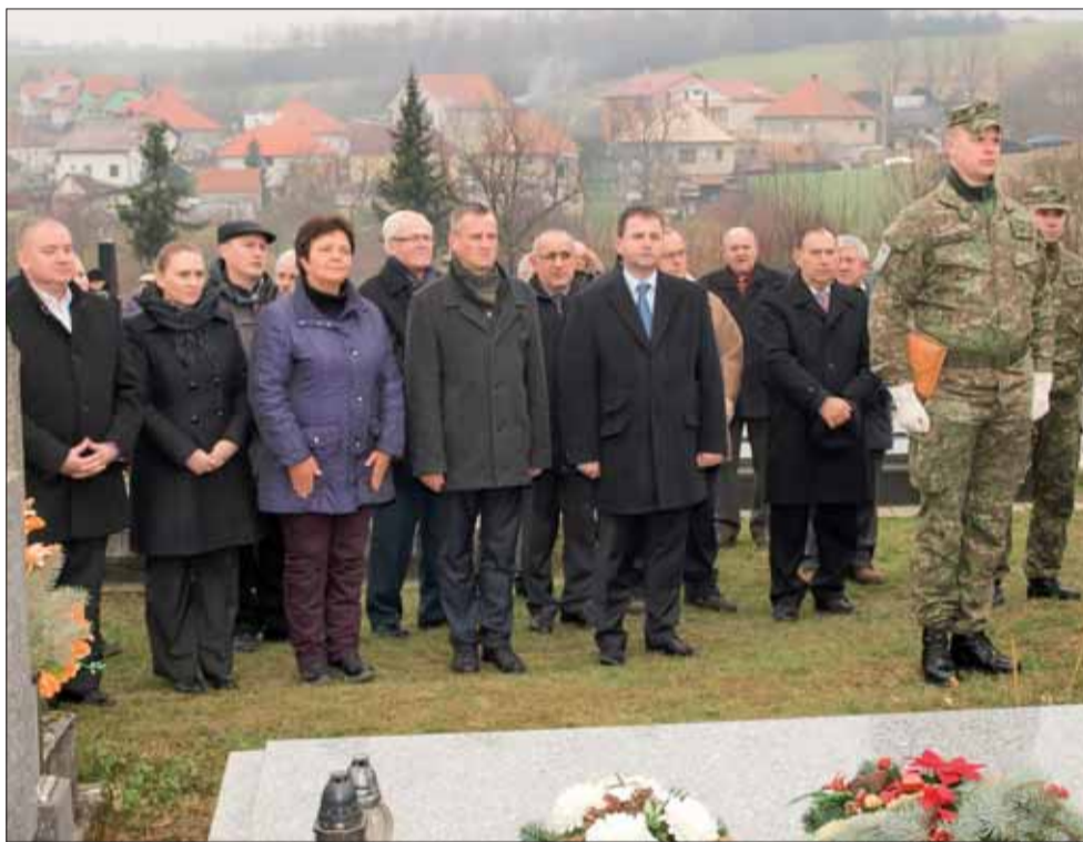
Hostie. Pri spoločnom hrobe padlých partizánov.