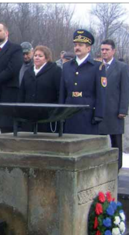
batolaťa? Nepochybne aj na túto otázku