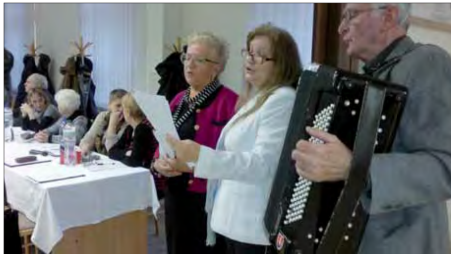
Prešporská kasáreň maľovaná, chlapi ju maľujú pesničkami, chlapi pesničkami, dievčence slzama... táto a ďalšie pesničky navodili správnu atmosféru.

Levická oblastná organizácia patrí vo zväze k tým menším. Má 249 členov a tí sú združení v ôsmich základných organizáciách. Nové orgány preto sústreďujú svoju činnosť nielen na zabezpečenie nárastu počtu členov, ale aj počtu základných organizácií. Pochopiteľne, že priority sa teda musia zmeniť metódy práce i hodnotenia členov