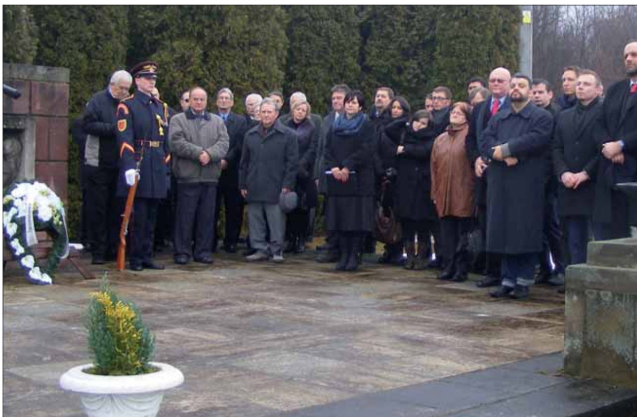
Čím sa previno 148 bezbranných občanov a medzi nimi aj 30 zabitých a spálených detí vrátane trojmesačného hľadali odpoveď v Kláaku predstavitelia asi najväčšieho počtu delegácií za posledné roky.