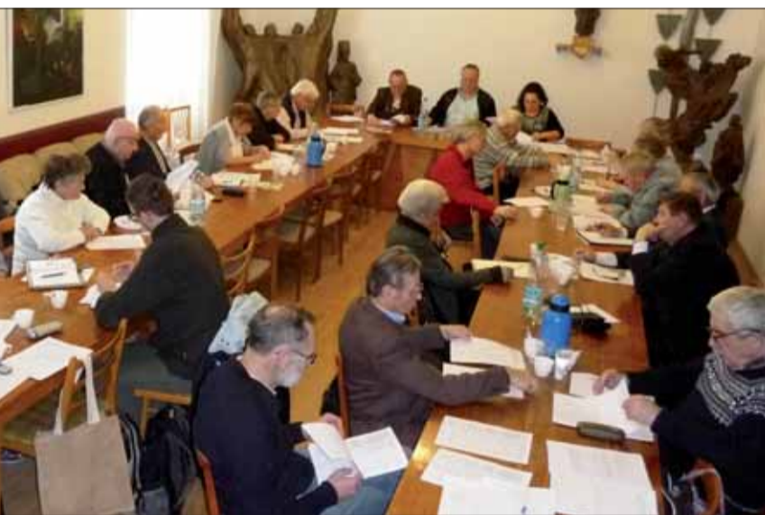
ObIV SZPB v Bratislave.