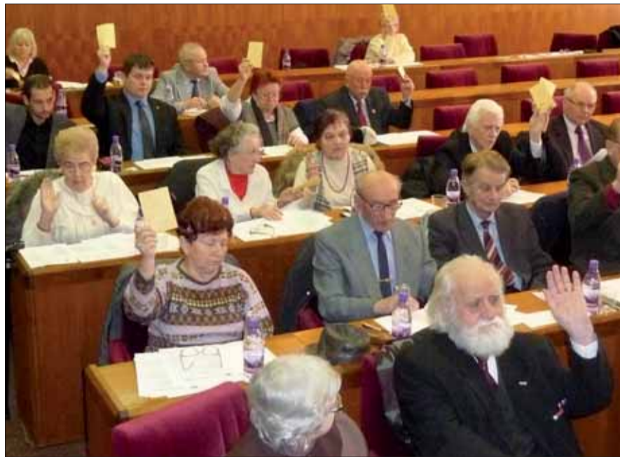
Hlasovanie žilinských delegátov.

Rokovanie žilinských protifašistov bolo celkovo odlišné od doposiaľ uskutočnených konferencií. Kým tie boli až