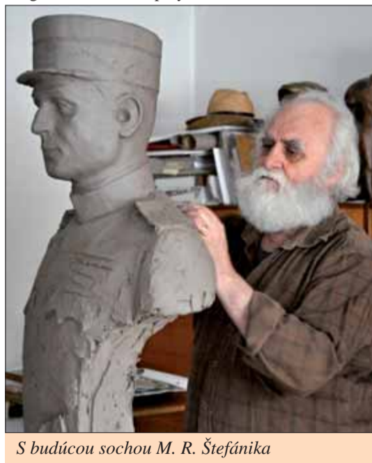
S budúcou sochou M. R. Štefánika