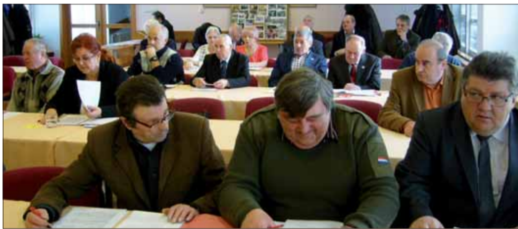
Delegáti popradskej konferencie.