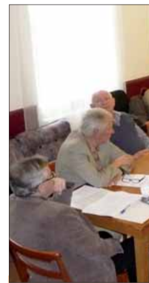
Z rokovania rozšíreného výboru.

Smutnou správou pre delegátov bolo oznámenie, že v oblastnej or-