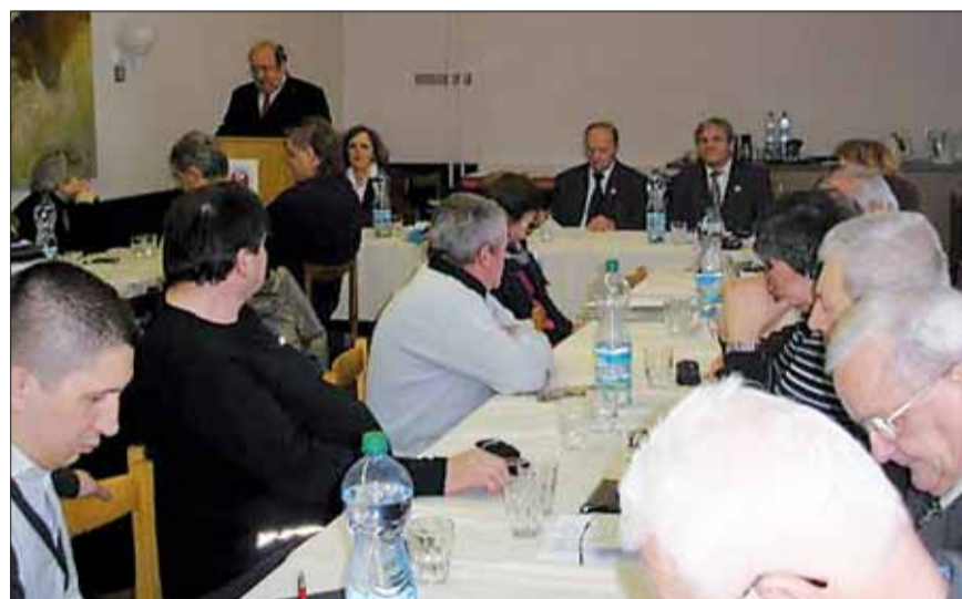
Oblasťná konferencia SZPB v Starej Ľubovni.