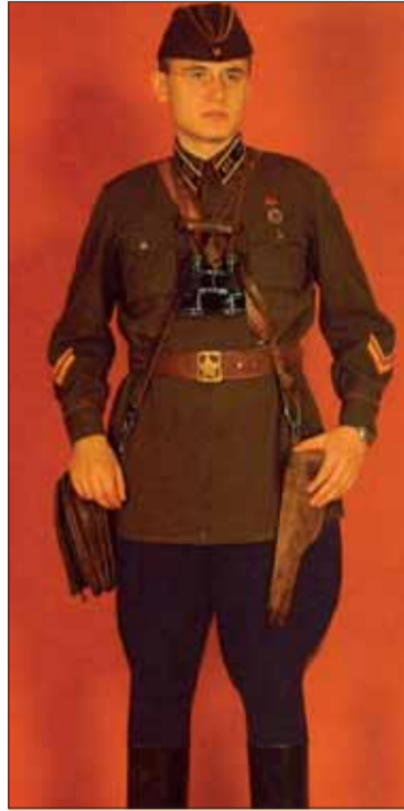
Stará rovnošata delostrelca Červenej armády

Červená armáda potrebovala výrazné prelomové víťazstvo. Takým sa stal Stalingrad. Keď bolo jasné, že 6. Paulusova armáda je porazená, projekt bol potvrdený Predsedníctvom ÚV VKP (b) – 23. októbra 1942. Prechod k výložkám sa mal podľa príkazu uskutočniť v priebehu pol mesiaca – s 1. po 15. február