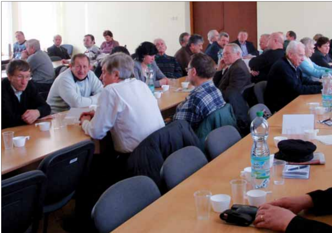
Pohľad na účastníkov rokovania vo Svidníku.