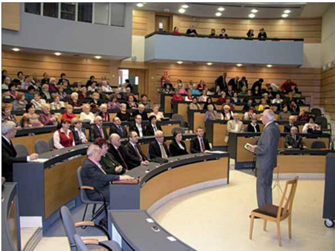
V Banskej Bystrici pripravili príjemné stretnutie k MDŽ a Dňu učiteľov.

Krásnou symbolickou kyticou krátkych umeleckých vstupov venovaných ženám, učiteľom a tisícstopäťdesiatemu výročiu príchodu Cyrila a Metoda na naše