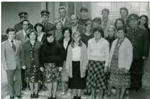
Kolektív BSP Pomstiteľ v r. 1982.