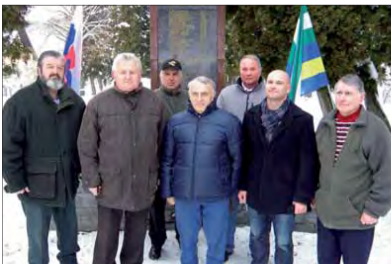
Hriňovčania si pripomenuli oslobodenie mesta.