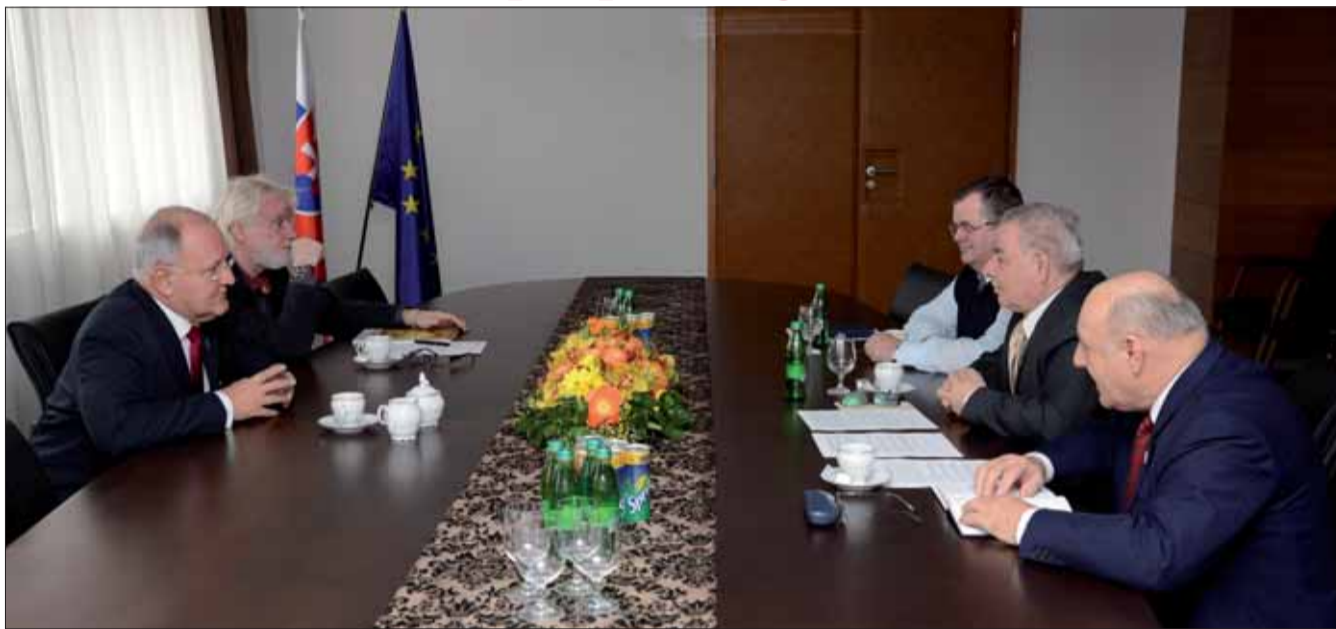
Stretnutie delegácie SZPB s ministrom školstva Dušanom Čaplovičom.