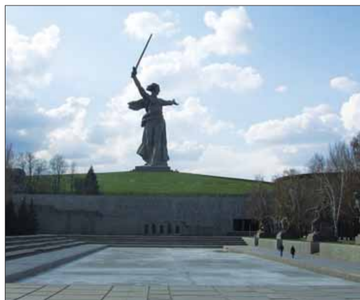
Ústredným bodom Pamätníka bitky o Stalingrad na Mamajovej mohyle je socha Matka Vlast volá. Autorom stavby, ktorú ukončili roku 1967, je Jevgenij Viktorovič Vučetič.