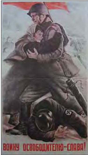
BOJE O STALINGRAD (13. 9. - 18. 11. 1942)