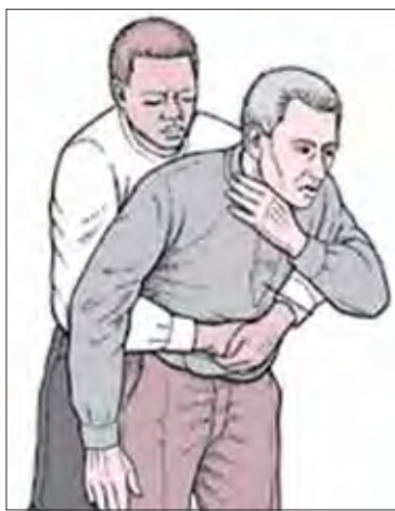
Heimlichov manéver

Ak kašeľ nepomôže s odstránením cudzieho telesa z dýchacích ciest, čo býva v prípade, že ide o úplne dusenie, možno použiť tzv. Gordonov úder, prípadne následne Heimlichov manéver, pri-