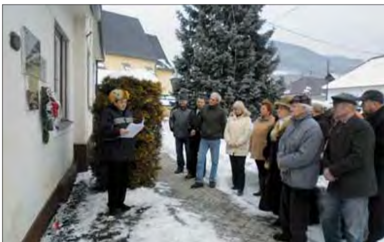
Obyvatelia Horného Gemera si pripomenuli príchod slobody.