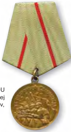
MEDAILA ZA OBRANU STALINGRADU

Bola udeľovaná všetkým účastníkom obrany Stalingradu z radov vojakov Červenej armády. Jej prvým nositeľom bol veliteľ 64. armády generál Michail Stepanovič Šumilov, ktorému do rúk zložil kapituláciu maršal Paulus.