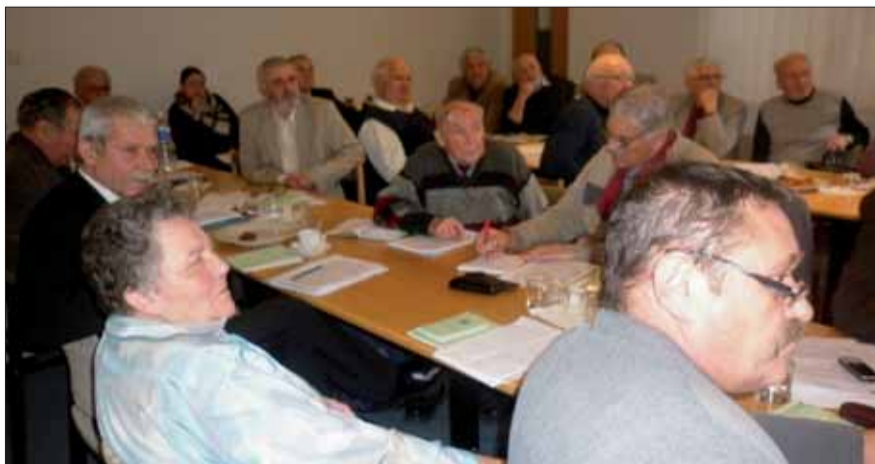
Pohľad na celoslovenskú poradu predsedov ObV SZPB v Banskej Bystrici.

porady zúčastnila väčšina predsedov. Diskusia bola zameraná na vysvetlenie nových stanov, organizácie činnosti ob-