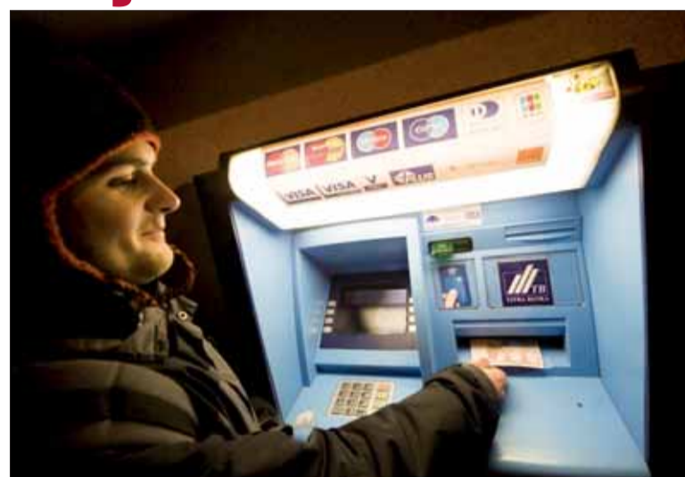
Pri výbere z bankomatu treba byť opatrný.

Pri výbere peňazí z bankomatu treba byť veľmi obozretný a pri najmenšom podozrení využiť iný bankomat, skontrolovať, či nie sú uvoľnené spoje, pohyblivé časti a podobne. Ak klient objaví upravený bankomat, mal