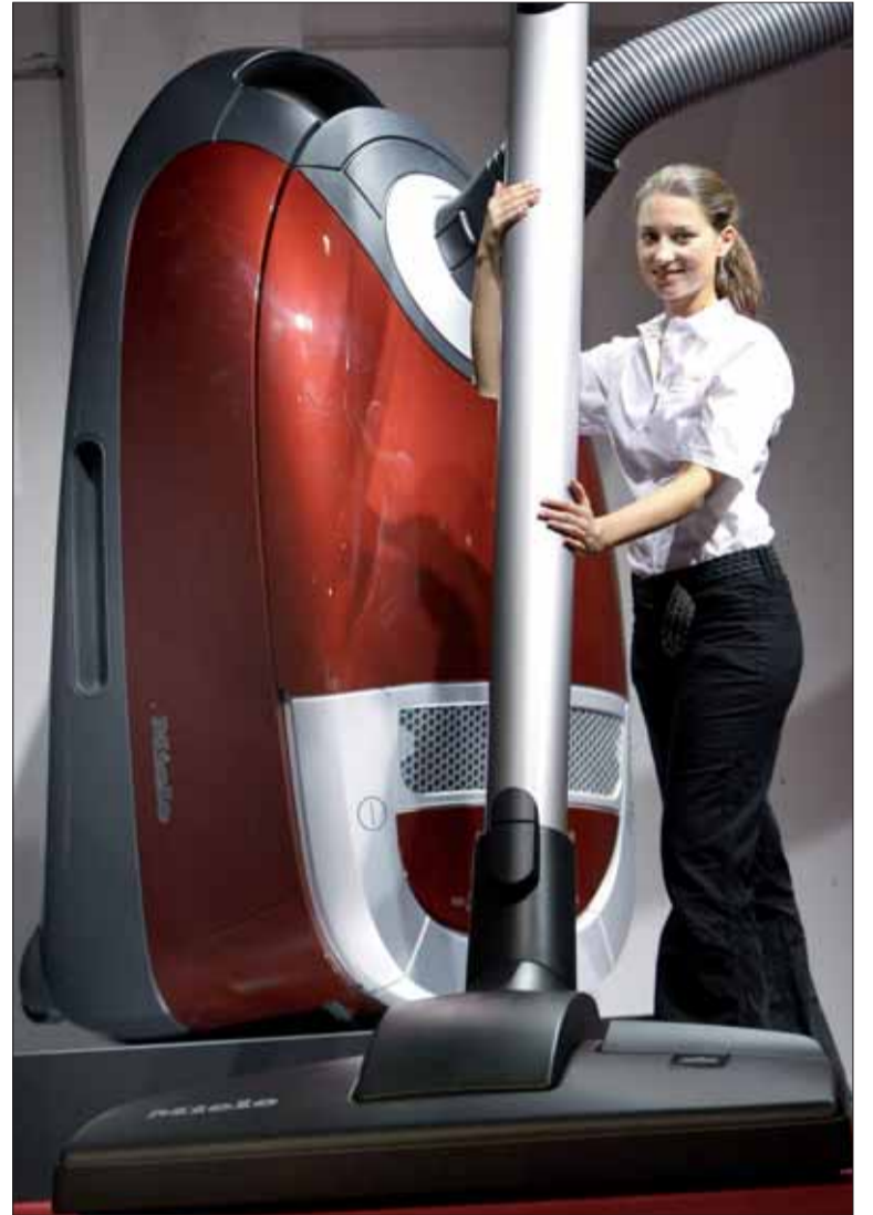
Aby vysávač dobre fungoval, treba sa oň starať.

v práci. Pomocou virtuálnych majákov sa dá nastaviť plocha, ktorú majú v daný čas povysávať, veľmi dôležité pre ich bezporuchovosť