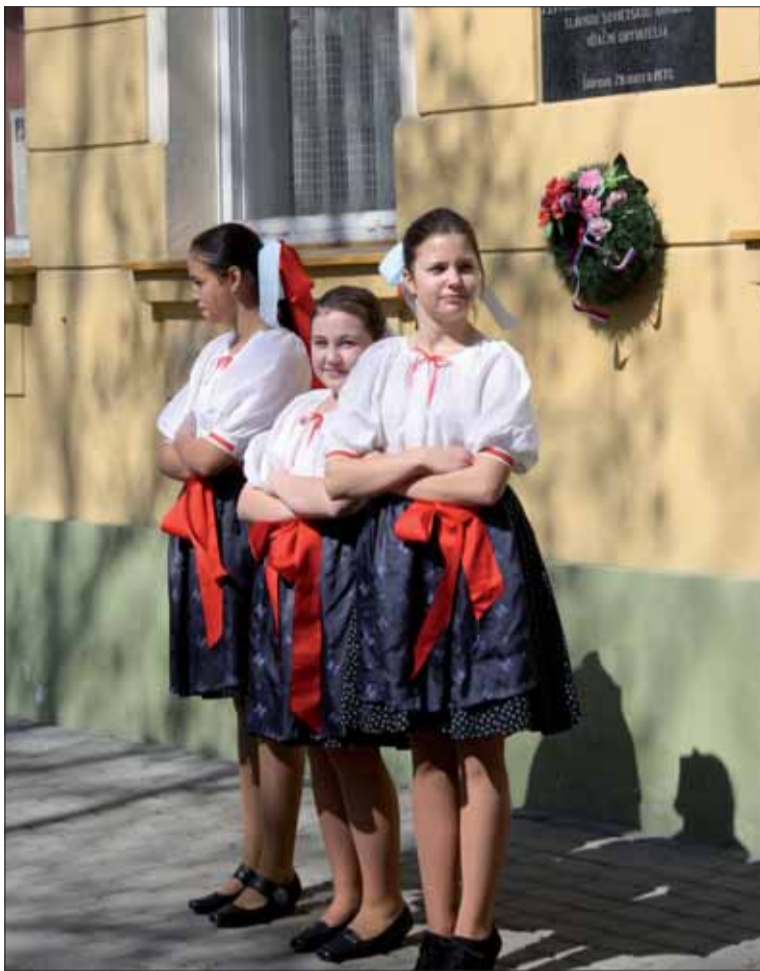
Počas oslavy oslobodenia Štúrova pozdravili prítomných aj Štúrovčatá.