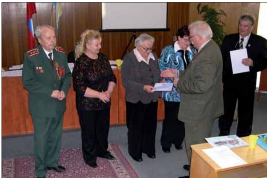
Oblasťná konferencia v Trebišove