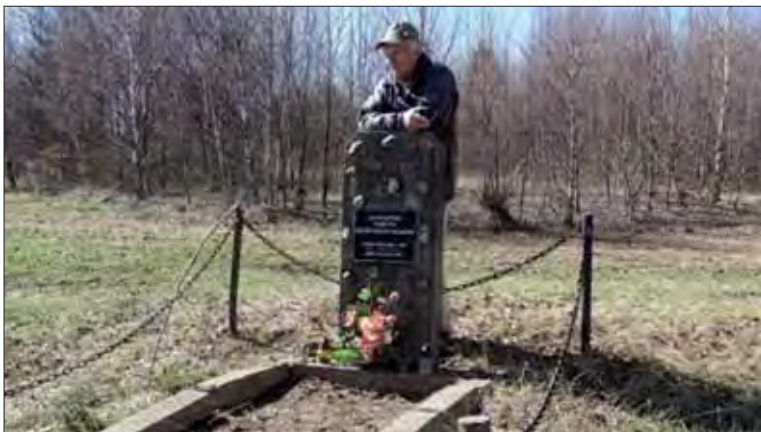
Pamätník rumunským vojakom na Lúčkach – 750 m.n.v., na hranici chotárov Brezno – Valaská.