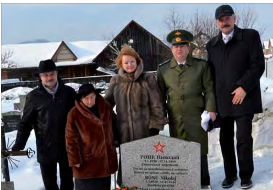
V Kamienke odhalili pamätnú tabuľu.