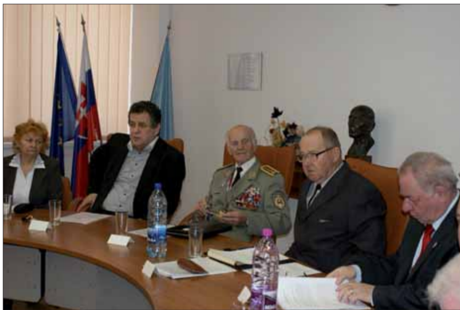
Zasadnutie Oblastnej konferencie v Nitre.