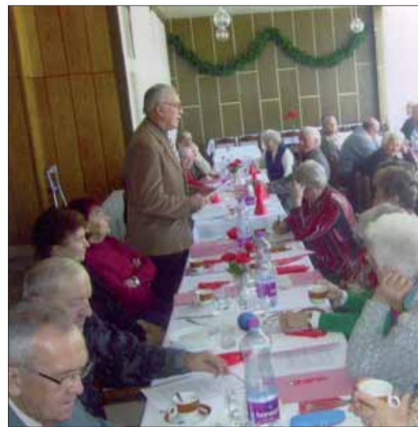
Oblastná konferencia v Lučenci.