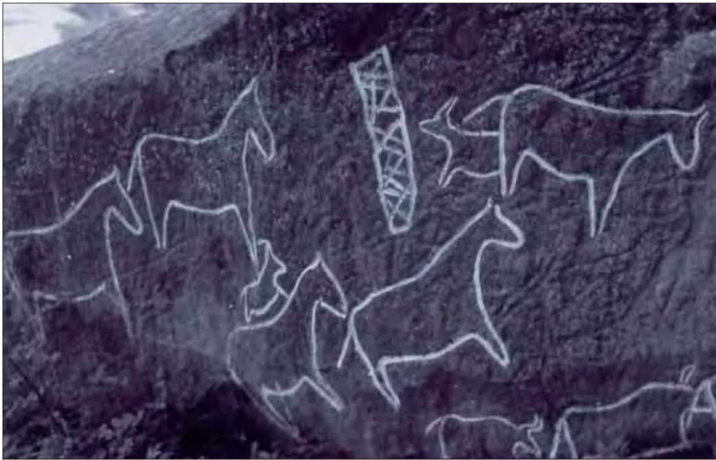
Maľby dávných umelcov.