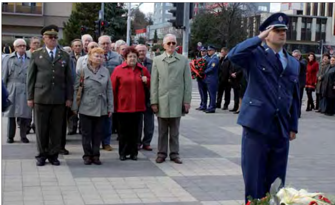
Oslavy oslobodenia Nitry.

Spevácky zbor Nitria svojim vystúpením potešil prítomných. Opäť sa okrem iných stretli