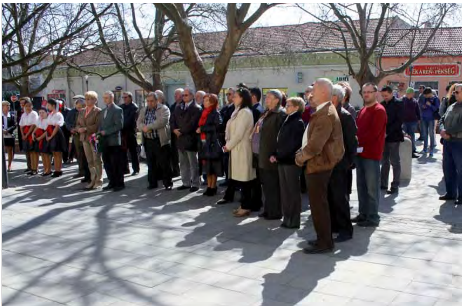
Účastníci pietnej spomienky v Štúrovo.

Je nám ct'ou spolupracovať s takýmito výnimočnými osobnosťami v SZPB. F. CHUDA