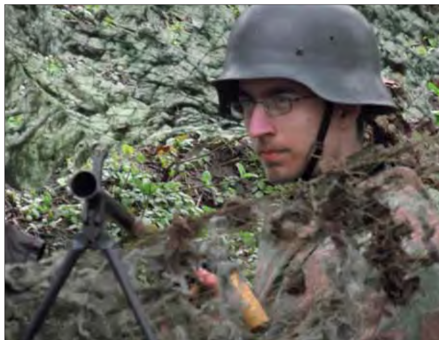
Simulácia útoku pri petržalskom bunkri BS-8.

Pri bunkri BS-8 Hřbitov, ktorý od roku 1938 tvoril súčasť opevnenej obrannej línie bratislavskej Petržalky, sa v sobotu 7. apríla opäť strieľalo. Prepadový oddiel Červenej armády nečakane zaútočil na obranné stanoviská Wehrmachtu a po krátkom boji ich dobyl.