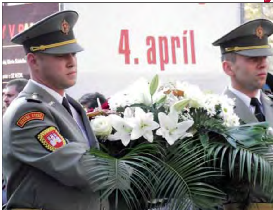
Položením vencov si v Bratislave pripomenuli oslobodenie mesta.

Zároveň vyzdvihol rozhodnutie bratislavských poslancov mestského zastu-