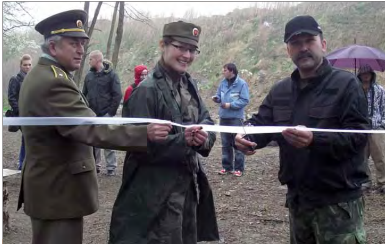
Pri Bunkri BS-8 v Petržalke otvorili novú strelnicu.

„Otvárame ho 5. mája o 14.00 h v mýtnom domčeku na staromestskej strane Starého mosta," povedal. V roku 1918 bola v tomto domčeku colnica, až kým Československu o rok neskôr definitívne nepripadla aj petržalská strana Dunaja. „V roku 1938 pripadla Petržalka Nemecku. Vtedy tam bola slovensko-nemecká hranica. Ten domček je malý, ale budeme sa snažiť na tom malom priestore ukázať históriu colníctva a finančnej stráže na historických územiach Rakúsko-Uhorska, Československa a Slovenska," podčiarkol. „Zároveň tam pripravujeme pietne miesto padlým príslušníkom finančnej stráže, ktorí so zbraňou v ruke bránili hranice najmä v rokoch 1938 a 1939," dodal Ščerbík. df luc TASR