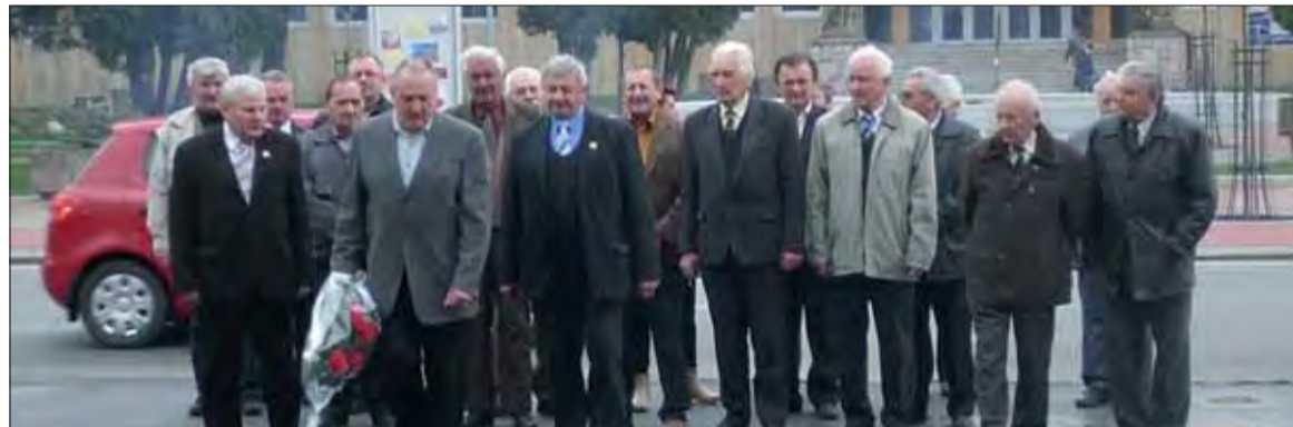
Dňa 4. apríla 2014 rokovovalo za účasti členky predsedníctva ÚR SZPB plénum ObIV SZPB vo Svidníku, rozšírené o predsedov a pokladníkov základných organizácií. Súčasťou programu bolo aj položenie kytice kvetov k soche armádného generála Ludvíka Svobodu.