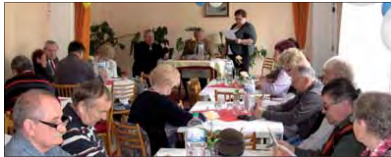
Plénum ObIV SZPB v Rimavskej Sobote.