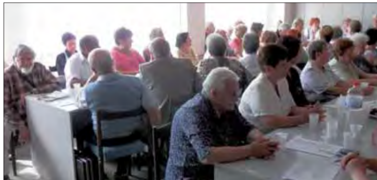
Historicko-dokumentačná komisia žien a mládeže pri ObIV SZPB v Humennom.