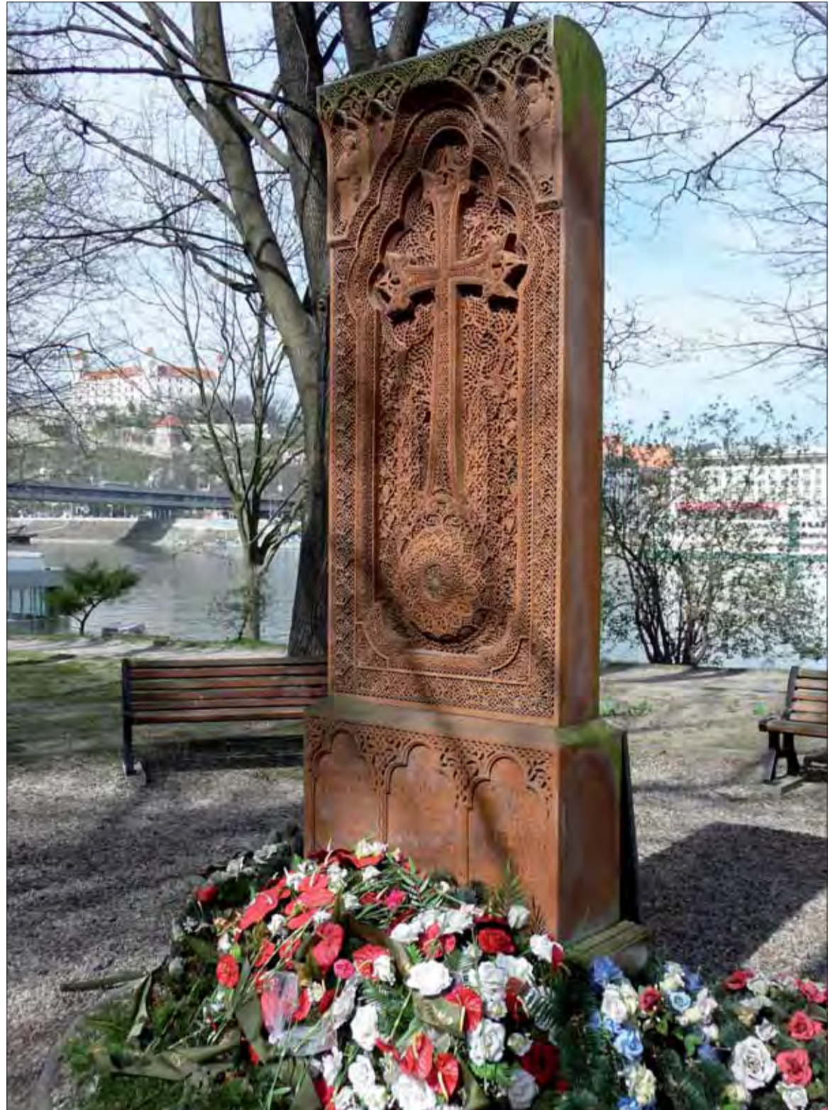
Na opačnej strane tohto pamätníka, nachádzajúceho sa na Tyršovom nábreží v Bratislave, je text: „Národná rada SR uznáva genocídu Arménov v roku 1915, pri ktorej zahynuli státisíce Arménov, žijúcich v Osmanskej ríši. Považuje tento čin za zločin proti ľudskosti.“

Vladimír MIKUNDA, podľa zahraničnej tlače