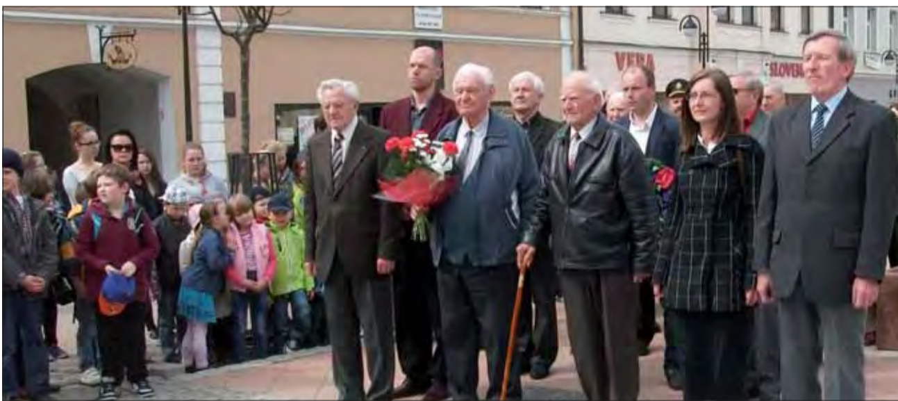
Účastníci spomienkovej slávnosti zaplnili Hviezdoslavovo námestie v Dolnom Kubíne.