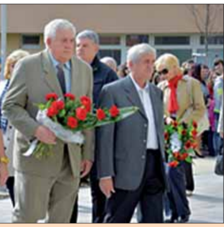
predseda ObV SZPB, s kyticou kvetov si ... boditeľov Žiaru nad Hronom.