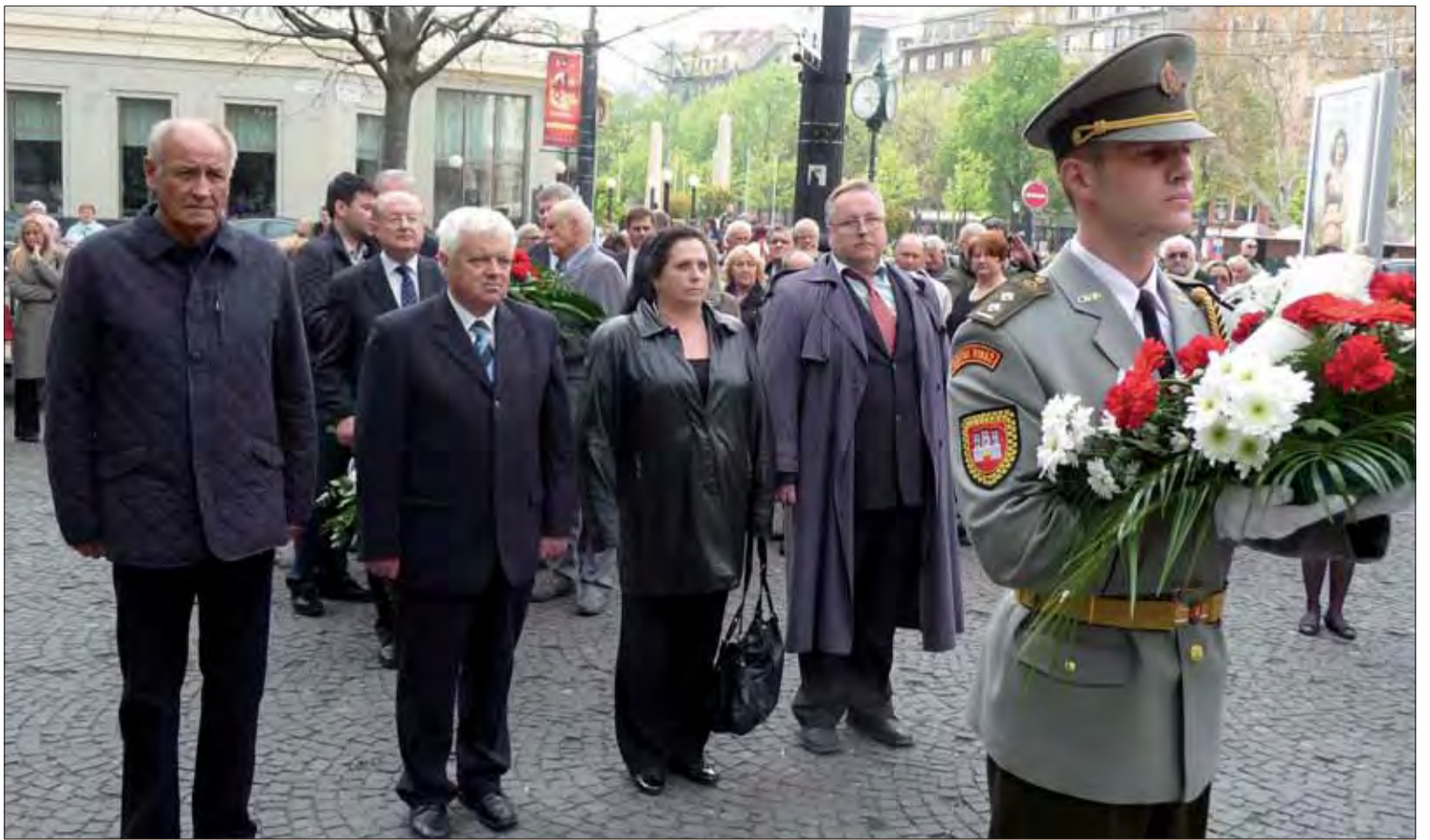
Delegácia ÚR SZPB.

■ Bol by som rád, keby sa takáto zhoda názorov zase vytvorila na úrovni mesta a jeho jednotlivých častí aj v ďalšej veci. Pred dvadsiatimi rokmi sa pri návrate k historickým názvom vytrhali z našich ulíc mená odbojárov bojovníkov, ktorí sa narodili, študovali, či pôsobili alebo boli na území nášho mesta väznení vo fašistických žalároch. Hoci každý z nich prispel k tomu, aby sa strašná vojna skrátila čo len o sekundu či dve, oslobodenia sa nedočkali.