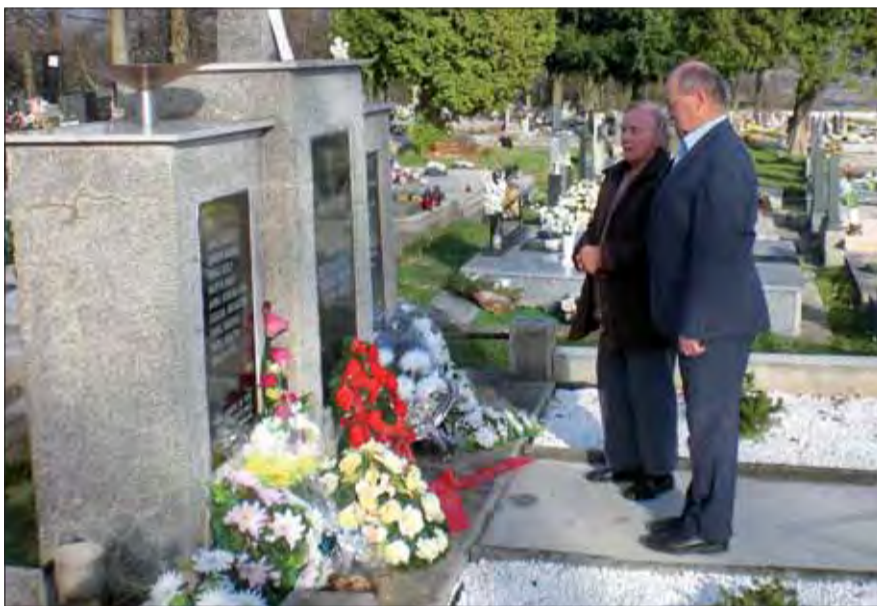
V Badíne vyjadrili úctu osloboditeľom položením venca.