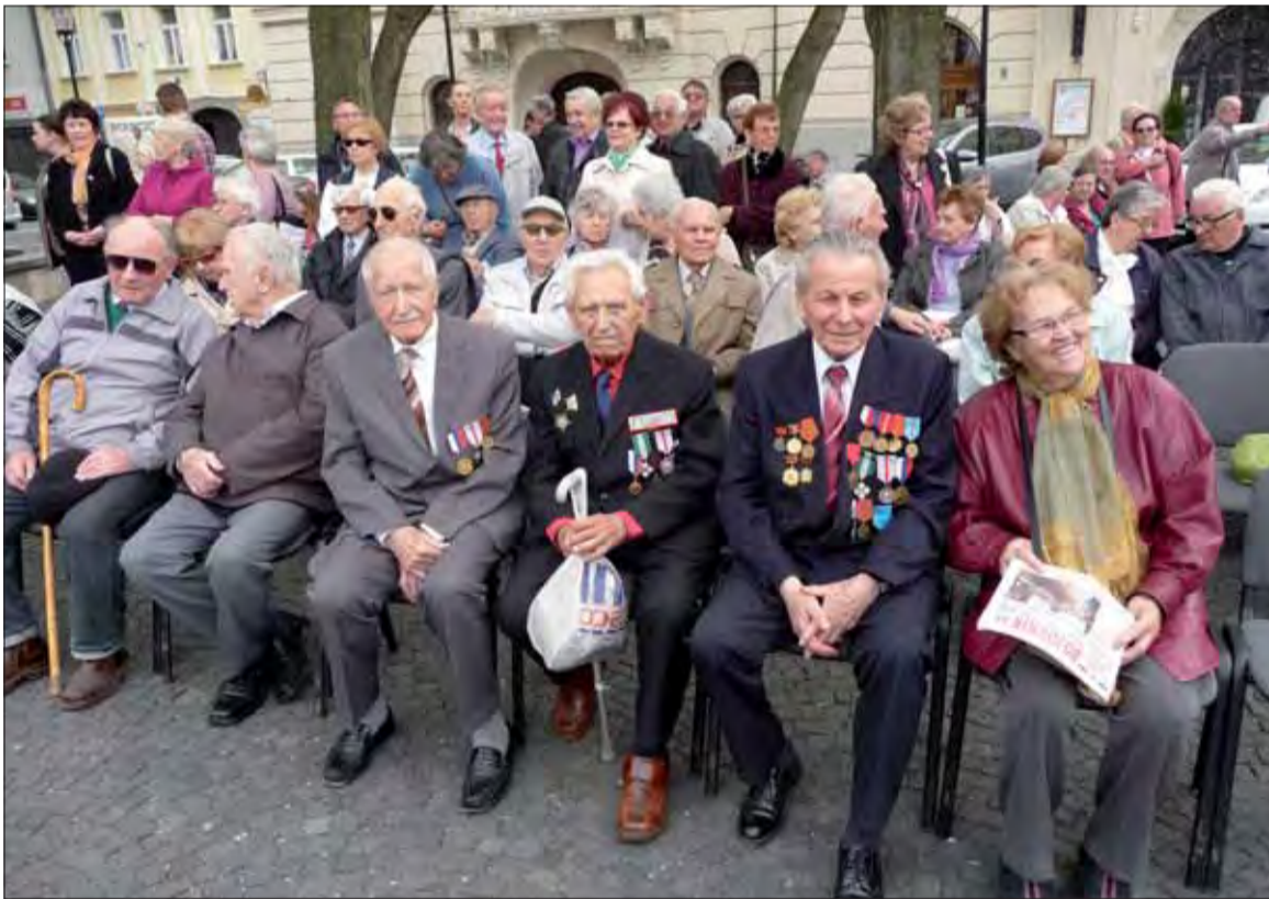
Priami účastníci odboja a občania Bratislavy, ktorí prišli vzdať hold k pamätníku osloboditeľov.

Na týchto podujatiach by sme mali povedať ÁNO ÁNO – hodnotám, za ktorými pevne stojíme, a dôrazne povedať NIE NIE – tomu, čo sa nám z duše bridí a čo tu už 70 rokov nemá miesta.