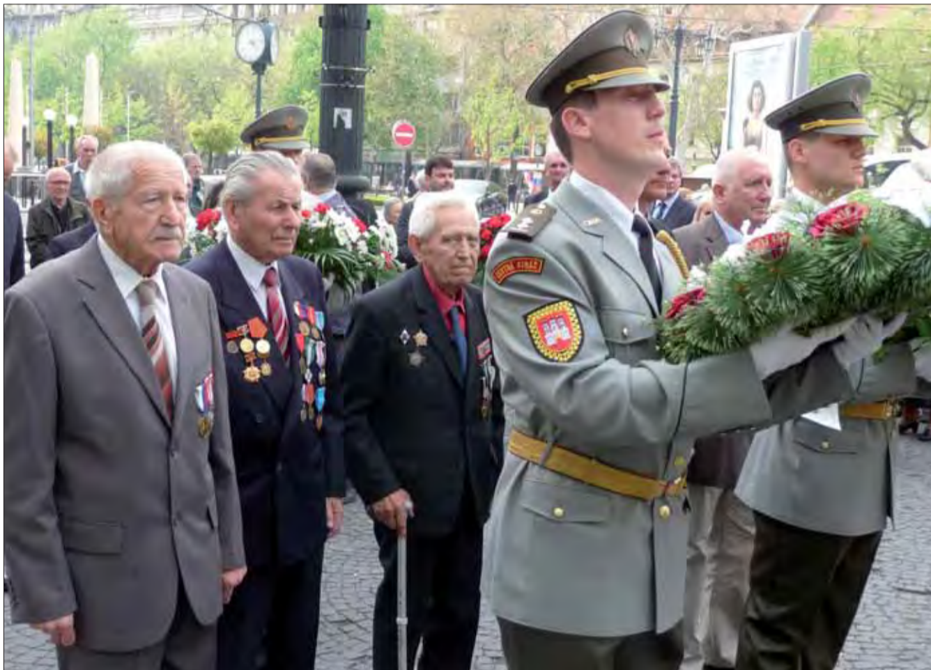
Organizátori spomienkových osláv požiadali priamych účastníkov oslobodzovacích bojov, aby si tohto roku vytvorili aj samostatnú delegáciu.