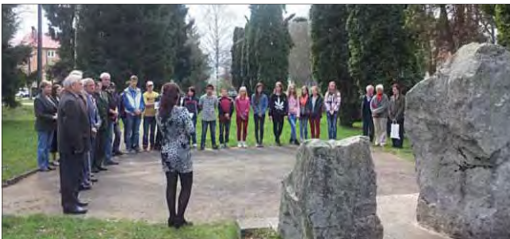
Istebničania spomínali pri pomníku padlých.