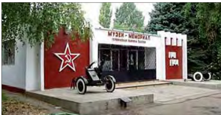
Múzeum – memoriál hrdinskej obrany Odesy.