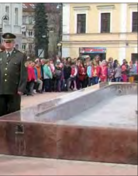
V Badíne vyjadrili úctu osloboditeľom položením venca.