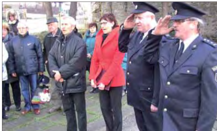
Pietnu slávnosť zakončil zborový spev štátnej hymny SR.