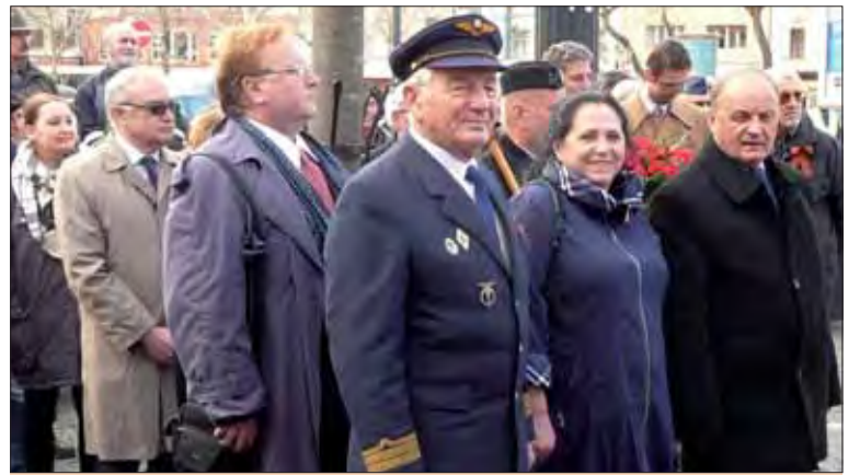
Delegácia ObIV SZPB Bratislava na mestských oslavách 70. výročia oslobodenia Bratislavy, pri Pamätníku sovietskej armády na námestí E. Suchoňa.

• Víťaz 2. sv. vojny je dobre známy: spojenci antihitlerovskej koa-