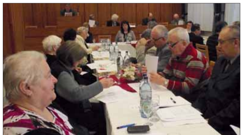
Rokovanie v Senici.

V Senici v správe zaznelo, že napriek prijatiu štyridsiatich členov do 55 rokov došlo k zníženiu počtu platiacich si členské známky z 328 na 285 a aj k zníženiu počtu základných organizácií z 13 na 9. Žiaľ, oblastná organizácia má už len 9 priamych účastníkov protifašistického odboja.