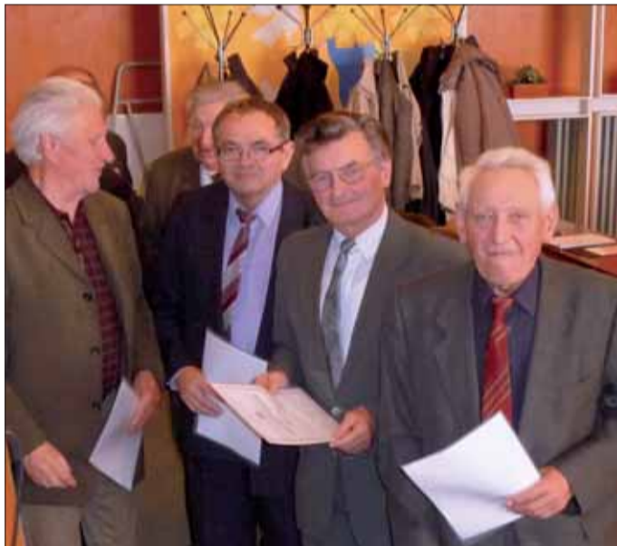
Vďaka vám za aktívnu prácu.

Bratislavská oblastná organizácia podišla ku svojej oblastnej konferencii so 677 členmi platiacimi si členské príspevky (866 evidovaných), z ktorých 192 sú priami účastníci protifašistického odboja.