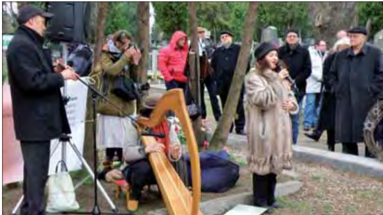
Súčasťou pietnej spomienky v nedeľu 29. 3. 2015, ktorej hlavným organizátorom bolo rakúske výskumné centrum pre vojnové zločiny Zentrale österreichische Forschungsstelle Nachkriegsjustiz , boli aj zádušné židovské piesne sprevádzané hrou na harfu.