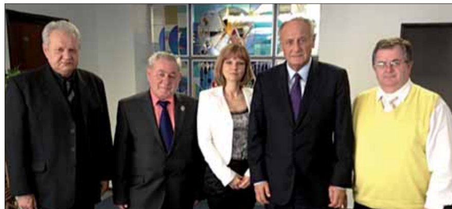
Stretnutie vedenia SZPB s ministerkou zdravotníctva Zuzanou Zvolenskou (v strede).