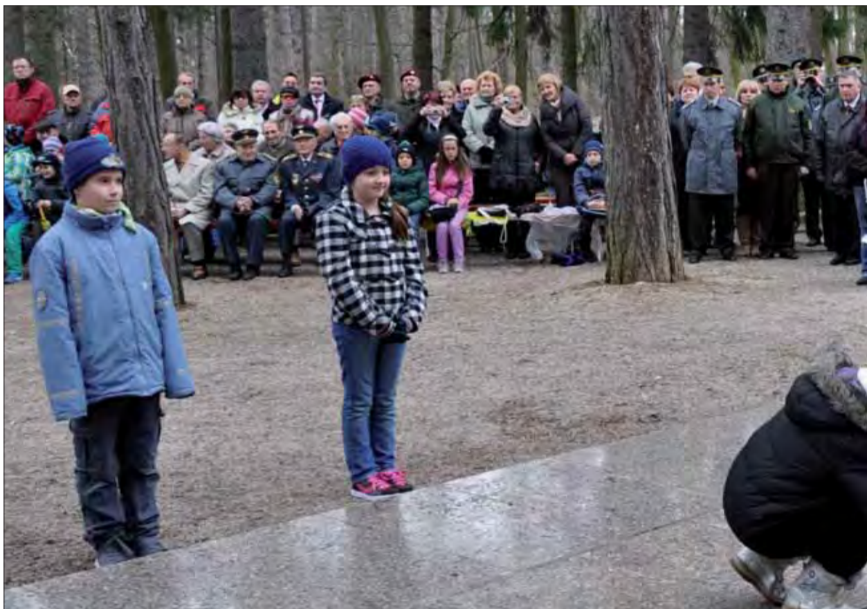
Na trenčianskej Brezine počas pietneho aktu pri príležitosti oslobodenia Trenčína si obeť vojny uctili aj žiaci základnej školy.