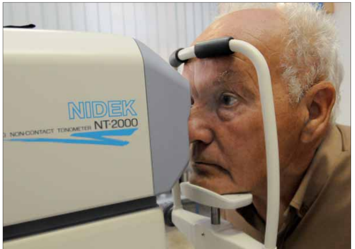
Lekári odporúčajú ľuďom starším ako 40 rokov raz ročne navštíviť očného lekára za účelom preventívnej prehliadky.