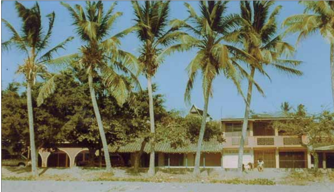
Chalety pod palmami.