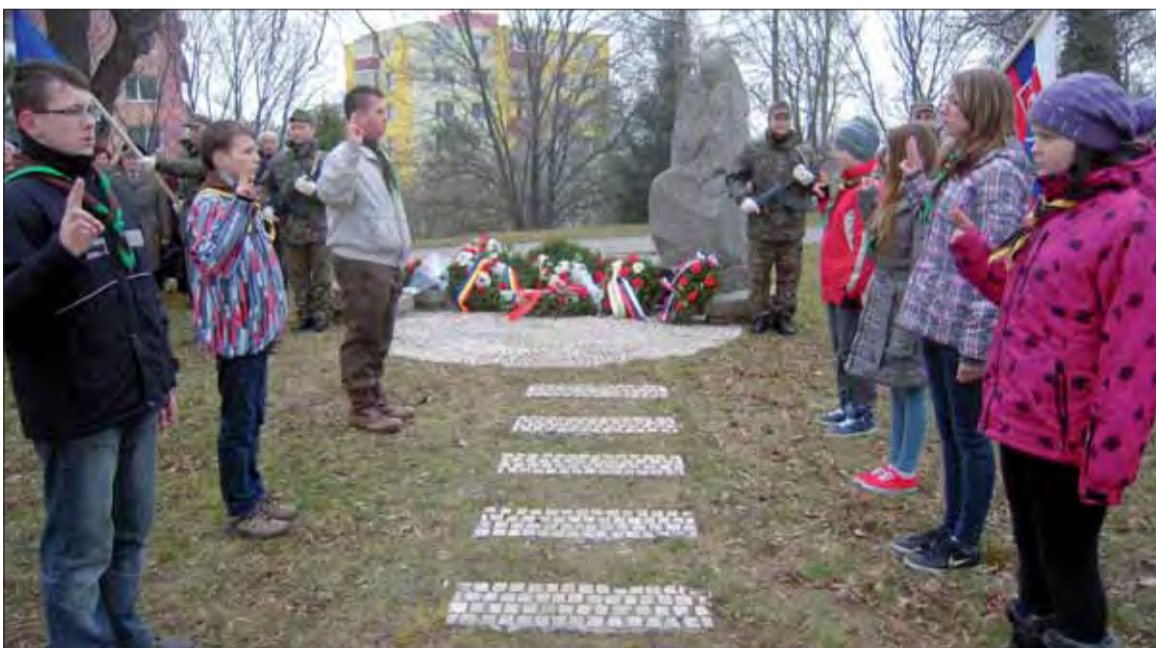
V Rakoluboch nechýbali na pietnej spomienke ani žiaci.