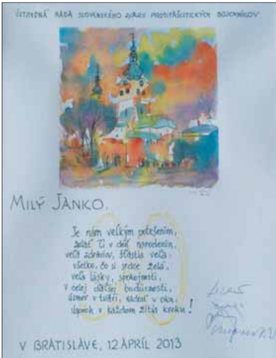
Verš k narodeninám od ÚR SZPB.