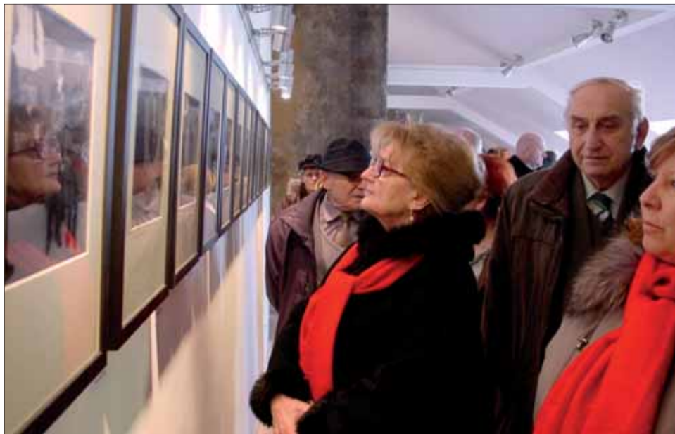
Výstavu si v Trnave prišlo pozrieť množstvo ľudí.

SZPB v Trnave a Mesto Trnava pozvali na slávnostnú vernisáž širokú verejnosť. Okrem čelných predstaviteľov radnice, zástupcov Trnavského samosprávneho kraja, zástupcov ozbrojených síl a hostí z Břeclavi obe dve výstavné siene praskali vo švíkoch. Mládež, dospelí i stárež, žijúci účastníci odboja i vojenskej trnavskej posádky, ktorá odišla do Povstania, ale aj pamätníci oslobodenia sa zišli osláviť výročie oslobodenia Trnavy.