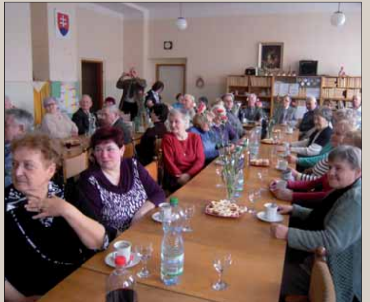
V Novom Meste nad Váhom na ženy a ich sviatok nezabudli.