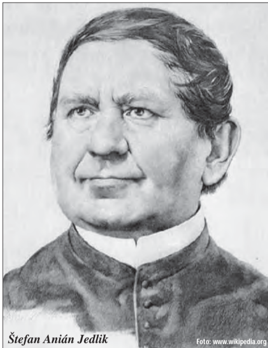
Štefan Anián Jedlik

Slovensko, na Kráľovskej akadémii v Bratislave bol do roku 1840 profesorom fyziky. Potom sa vrátil na svoju alma mater, kde tiež vyučoval fyziku, a po zvolení za rektora viac rokov vykonával i túto funkciu.