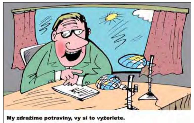
My zdrazíme potraviny, vy si to vyzeriete.