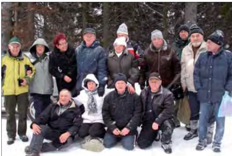
Odbojáři z Turca vzdali hold francúzskym partizánom.