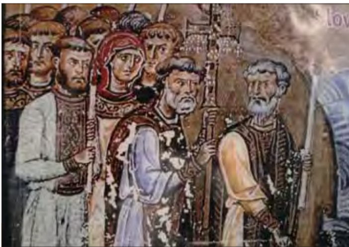
Konštantín a Metod, iluminácia zo Života sv. Vasilisa II., Bulharsko.