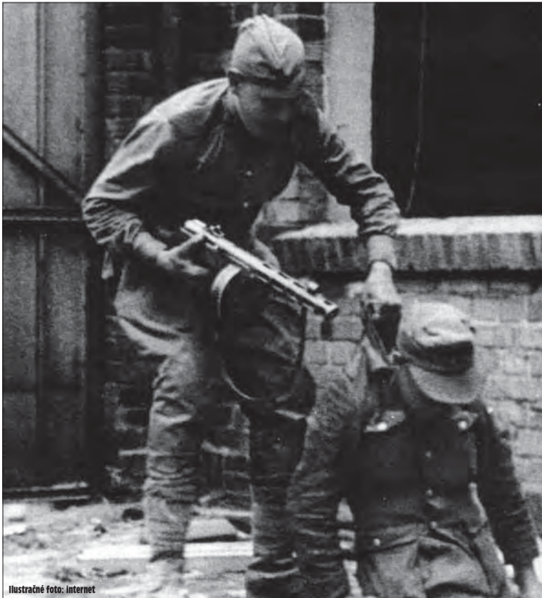
Ilustračné foto: Internet