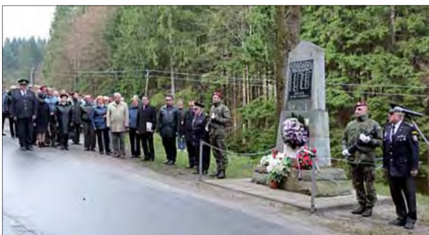
Nápis na pamätníku hlása: „Na tomto mieste dňa 20. apríla 1945 rukou neúprosného vraha položili svoje životy za krajšiu budúcnosť svojej krvou vykupenej vlasti títo občania obce Vysoká nad Kysucou, osada Semeteš.“ Pod nápisom sa nachádza 21 mien, ktorí tak ako aj my dnes, mali svoje životné plány a túžby. Boli vo veku od 16 do 51 rokov.