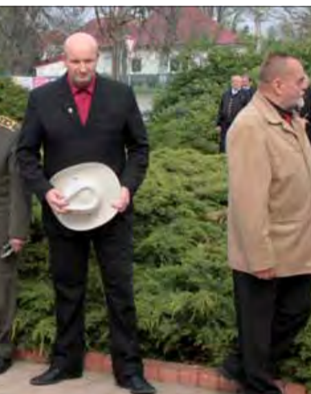
Protifašisti si všimli, že ich predseda ZO im ho nežiadala. My to máme tak zavedené, že sa na nás vďaka starostovi nad fašizmom SZPB a na výročie SNP