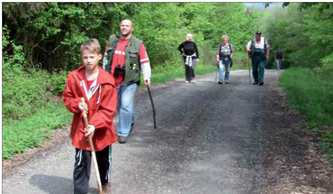
Momentka z pochodu.