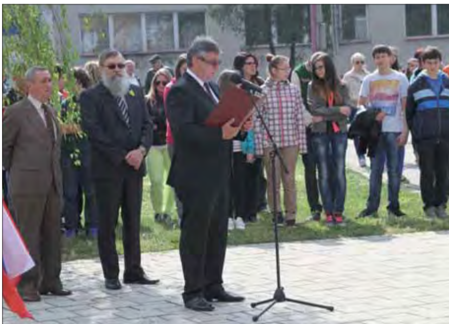
Účastníci spomienkového zhromaždenia v Skalici.