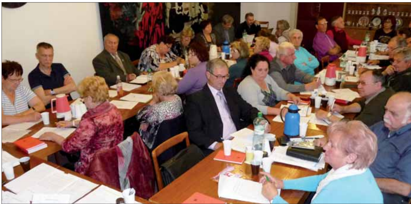
Tajomníci oblastných výborov SZPB, máj 2014.

Spresnený rozpočet na rok 2014; návrh Smernice na zvolanie XV. zjazdu, výročných schôdzí a oblastných konferencií SZPB; správa o činnosti od posledného zasadnutia, a prehľad hlásení tajomníkov oblastných výborov SZPB... To všetko, spolu s radom nevyhnutných organizačných otázok, bolo predmetom ostatného rokovania predsedníctva ÚR SZPB v polovici mája, na ktoré na druhý deň nadväzovala príprava tajomníkov oblastných výborov.