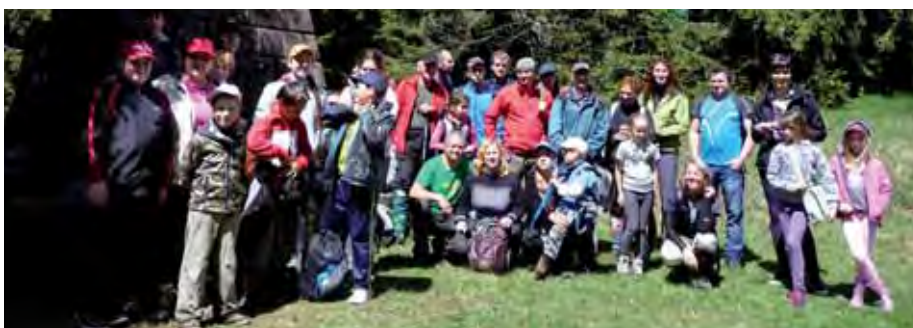
V Dobrej Nive sme výročie konca vojny pripomenuli najprv na členskej schôdzi, za účasti aj europoslancu Vladimíra Maňku. Po nej sme usporiadali pietny akt pri pamätníku obetí 2. sv. vojny a slávnostné stretnutie v kultúrnom dome.