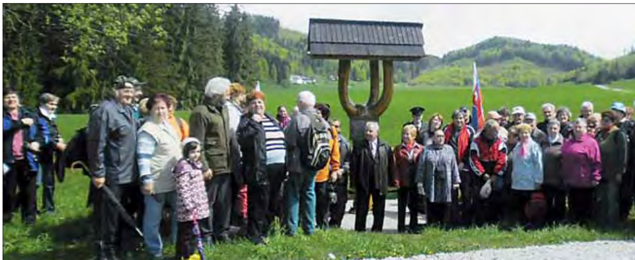
Stretnutie pri symbolickom pamätníku na Veľkej lúke pri Muráni.

Okrem členov SZPB sme sa pri pamätnej tabuli, pripomínajúcej oslobodenie mesta vojakmi 2. ukrajinského frontu a 1. a 4. do Posádkového klubu OS SR, stretli s členmi Klubu vojenských veteránov, občianskych združení a obyvateľov mesta, me- žiakov základných škôl. Po spomienkovom akte bola pripravená výstavka historických ručných palných zbraní, ktorá zauj-