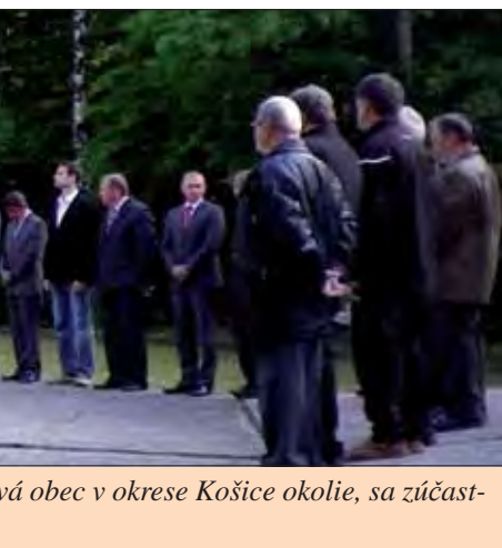
á obec v okrese Košice okolie, sa zúčast-