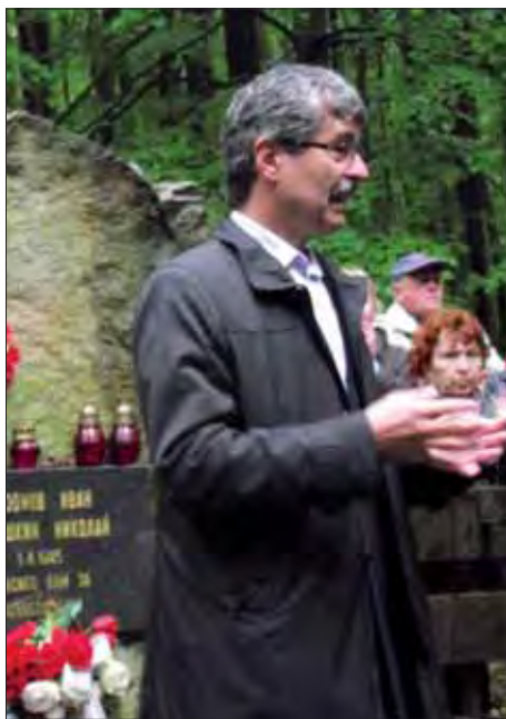
Milan Ftáčnik: „Ani na chvíľu som nezaváhal nad pozvaním, prišiel som dať úctu tým, ktorí tu padli v boji za našu slobodu.“