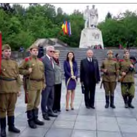
istupcovia ObIV SZPB v Košiciach s člen- Klubu vojenskej histórie Dargov počas láv Dňa víťazstva nad fašizmom a 69. ročia ukončenia druhej svetovej vojny pri mníku padlých hrdinov na Dargove.