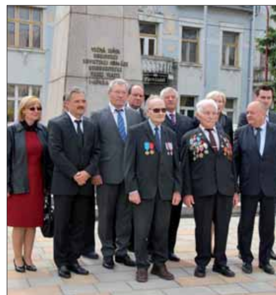
Pred pamätníkom v Trnave.