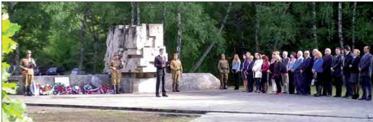
Na pietnej spomienke pri pamätníku v obci Skároš (8. 5. 2014), ktorá bola oslobodená už 17. decembra 1944 ako prvá obec v regióne. Prítomní boli predstavitelia štátnej správy i zástupcovia samospráv a politických strán z obcí mikroregiónu Hornád.