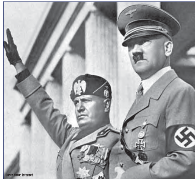
Ilustr. foto: internet