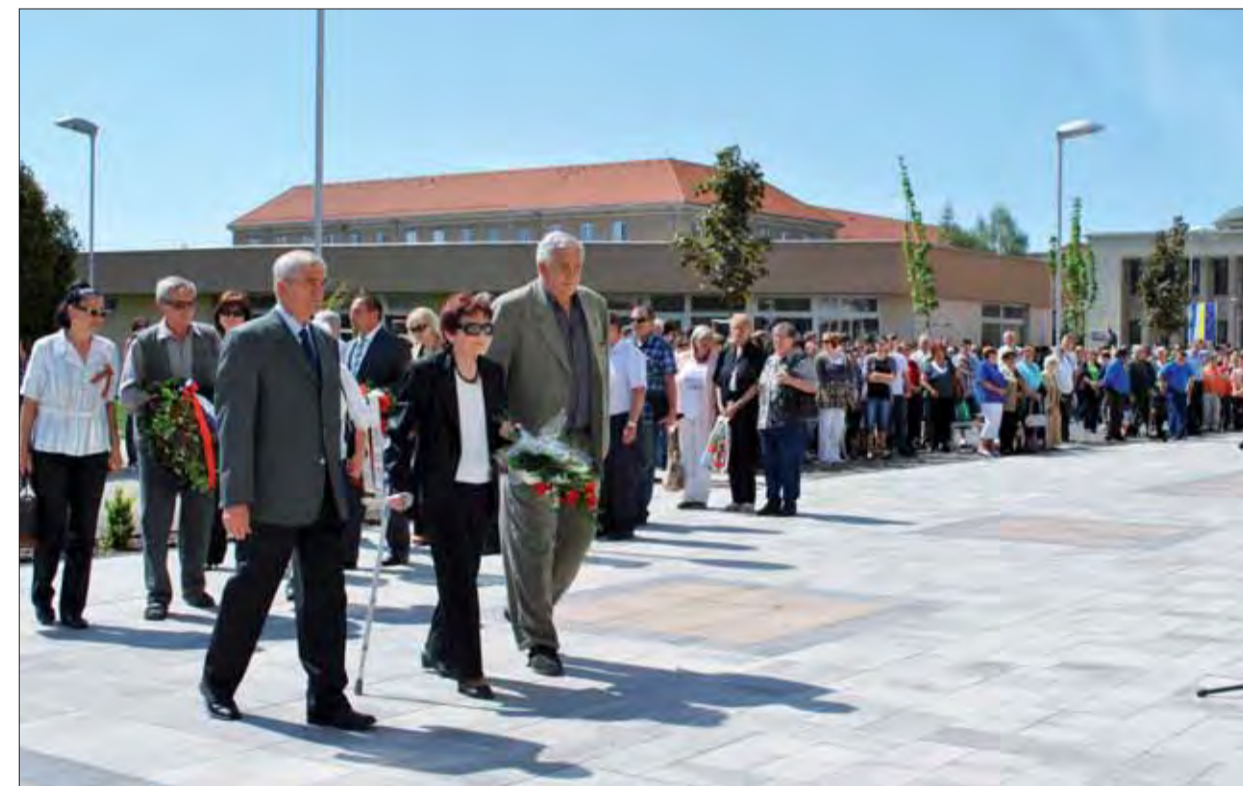
Deň víťazstva v Žiari nad Hronom.