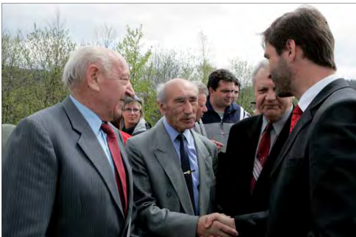
Oslobodenie Polom Javorina, predseda ŽSK s delegáciou SZPB.