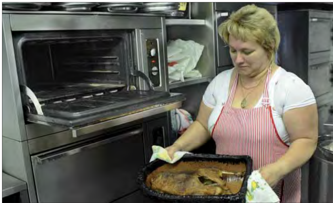
Rúru by sme mali používať na pečenie, a nie na ohrievanie potravín.