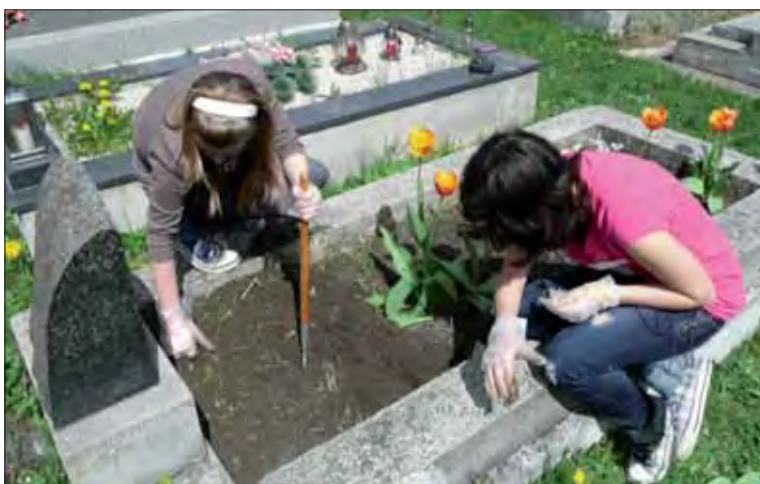
Žiaci v Žiari nad Hronom sa starajú o vojnové hroby.