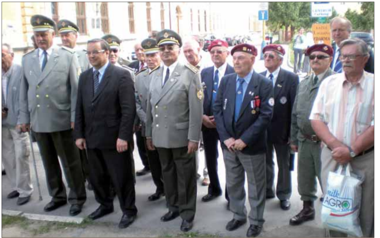
Deň víťazstva nad fašizmom v Prešove.