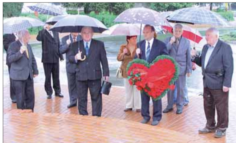
Spomienkové oslavy v Medzilaborciach.

Súčasťou slávnostnej akadémie bol krátky kultúrny program v podaní žiakov ZUŠ Medzilaborce. Spomienkové stretnutie pokračovalo pietnym aktom kladenia vencov k Pamätníku osloboditeľov a prijatím účastníkov primátorom mesta. Vladimír KOKUĽA