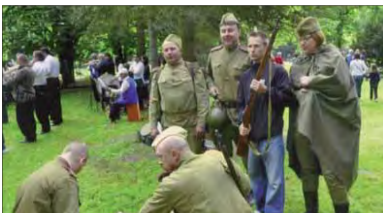
Ukážka z oslobodzovacích bojov Lučenca.