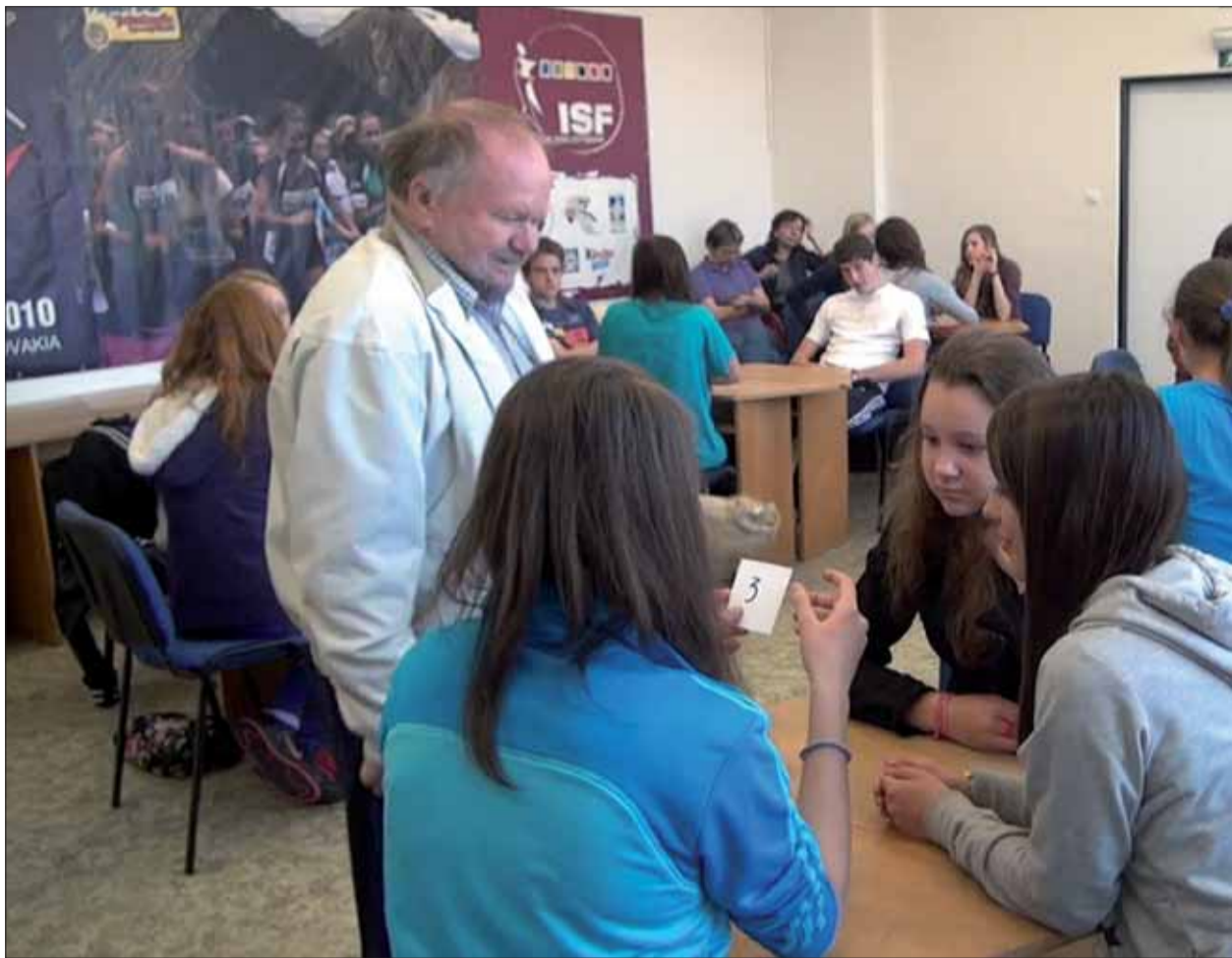
Žiaci na súťaži Poznaj svoje mesto.