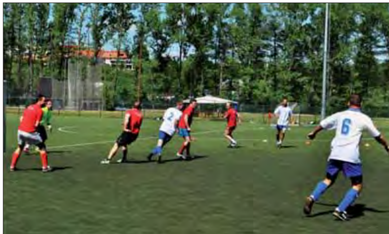
Turnaj vojnových veteránov v malom futbale.

Príjemná atmosféra a súťaživý duch, umocnené slnečným, letným počasím, boli nasledujúci deň 19. mája na vojenskej strelnici Mičina pri Banskej Bystrici sprievodcami ôsmeho ročníka streleckého me-