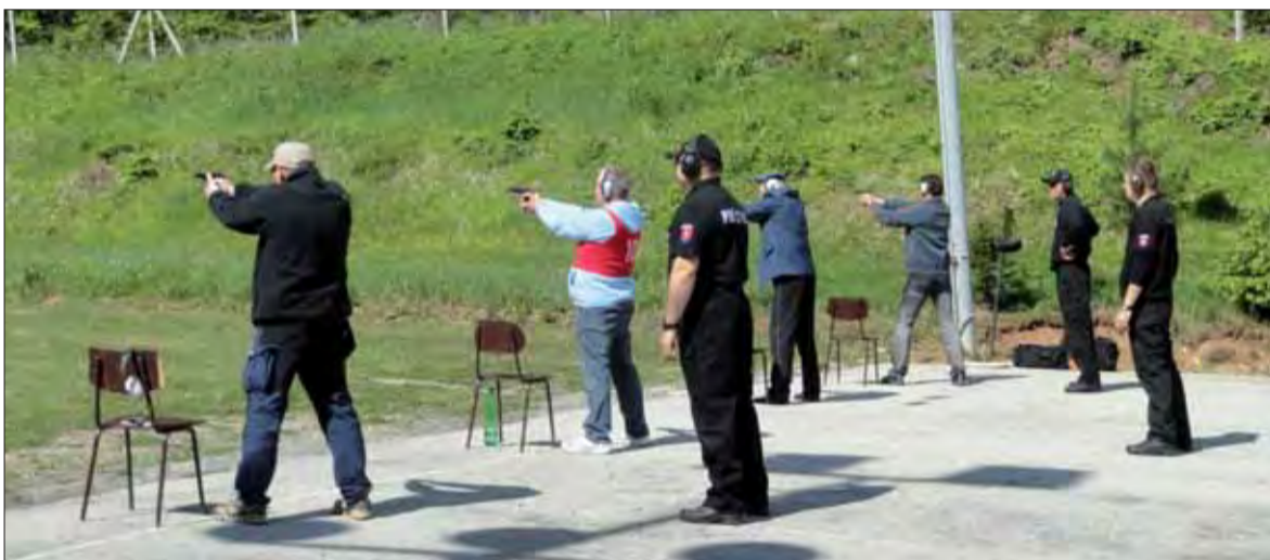
V streleckej súťaži predviedli svoje umenie aj vojenský diplomati akreditovaní v SR.