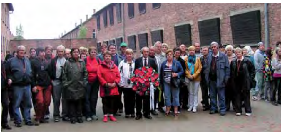
V Osvienčime si Levičania pripomenuli ukrutnosti vojny.