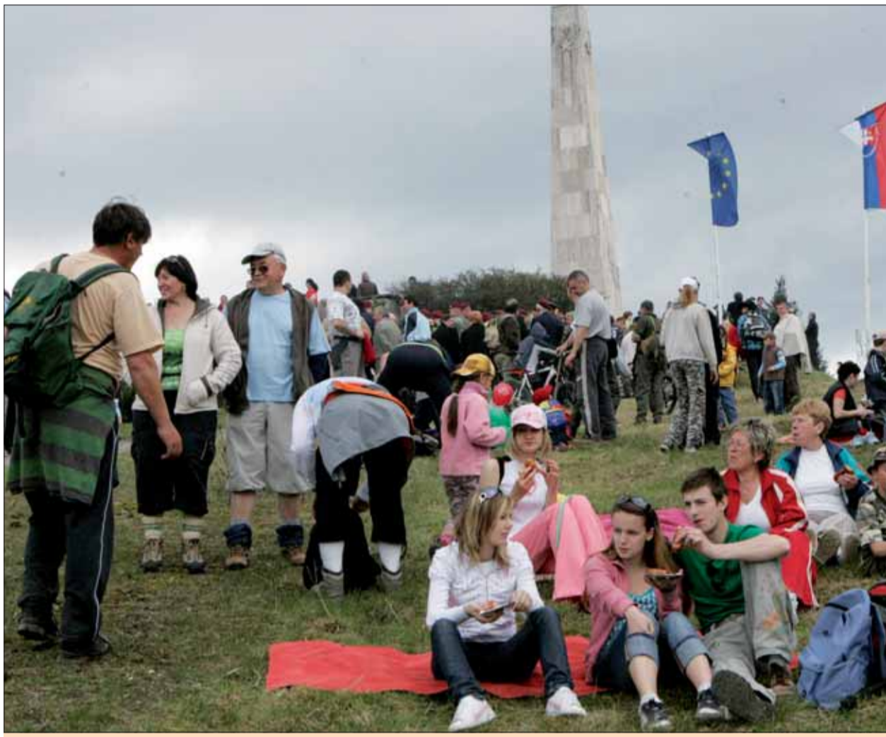
Oslobodenie si na Javorinu prišla pripomenúť aj mladá generácia.