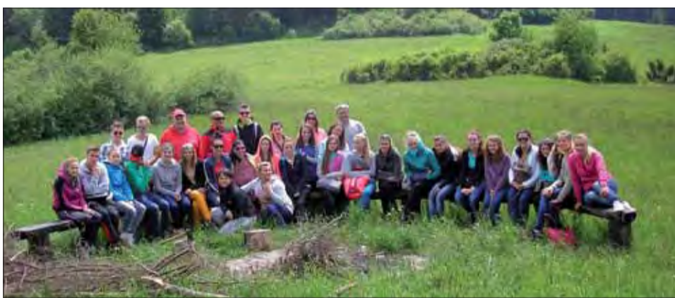
Účastníci výstupu na Marmon pred zapálením vatry.