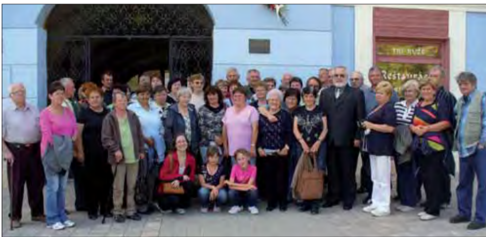
Na tvárach všetkých zúčastnených sa zračili príjemný úsmev.