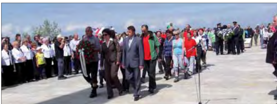
Pietne spomienka na Javorine.