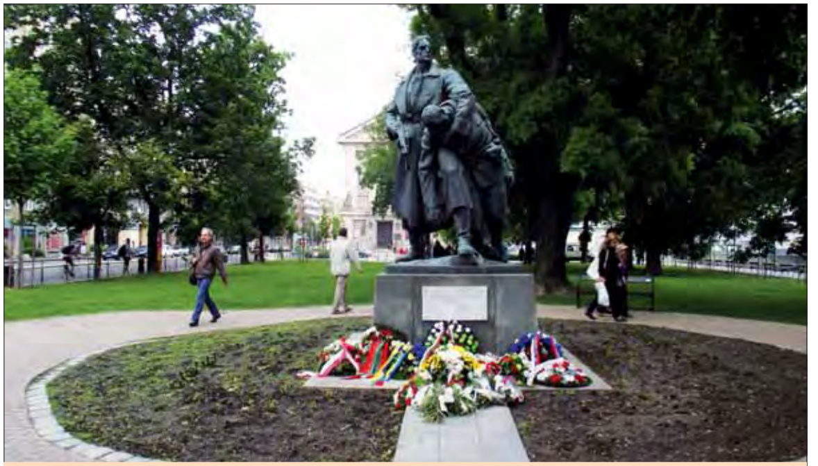
Pamiatku na bojovníkov pripomínajú vence.

Žiaci bulharskej základnej školy potom predniesli verše Boteva, z ktorých je aj u nás známy citát Kto padne v boji za slobodu, ten neumiera. Aj keď za sychravého počasia a v pozornosti nad stúpajúcou hladinou Dunaja, bolo toto stretnutie s občanmi a odbojármi prejavom vďaky a úcty k obča-