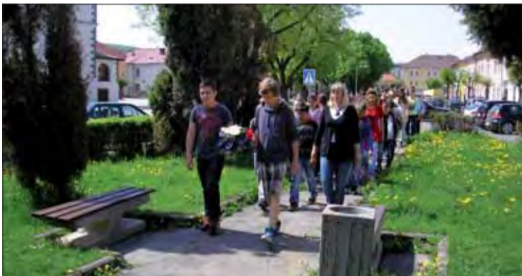
V Podolínci nachýbala na oslavách oslobodenia ani mladá generácia.