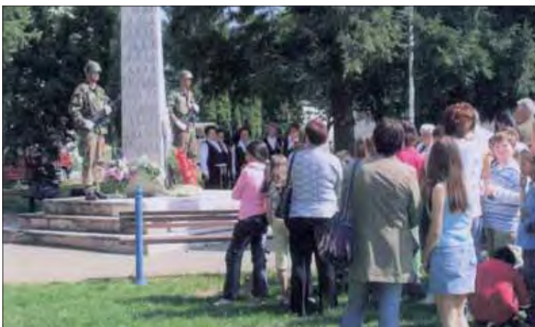
V Tlmáčoch si tiež pripomenuli oslobodenie.