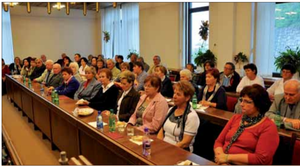
Členovia Oblastnej organizácie z Trenčína v NR SR počas diskusie s poslancami.