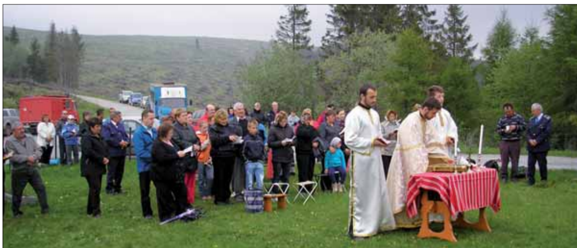
Spomienku na vojnu si pripomenuli aj bohoslužbou.

V Meste Podolínec sa občania a delegácie zišli 7. mája pred mestským úradom, odkiaľ v sprievode cez mesto účastníci prišli k pamätníku padlých, kde položili kvetinové vence. Delegácia mesta bola vedená primátorkou