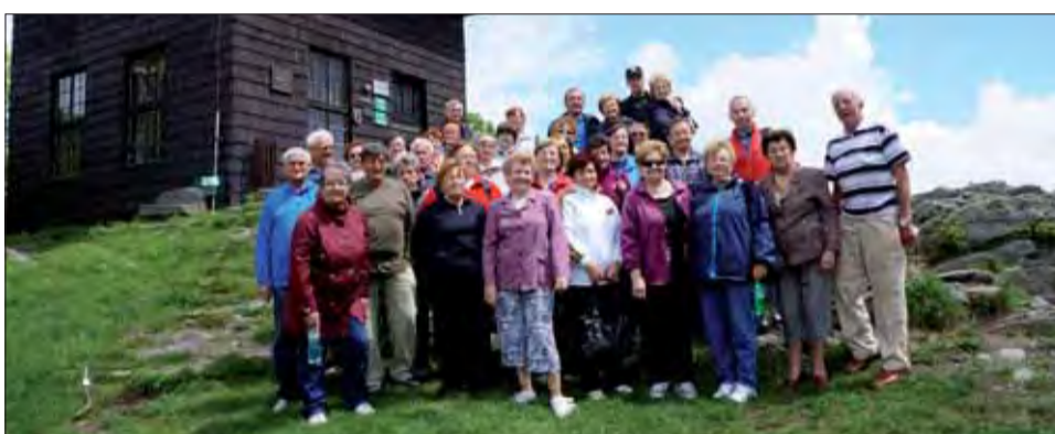
Krásny výhľad zo Sitna všetkých potešil.