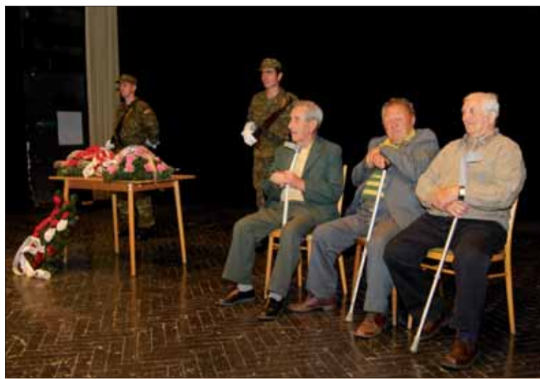
V Poltári si pripomenuli ukončenie druhej svetovej vojny.