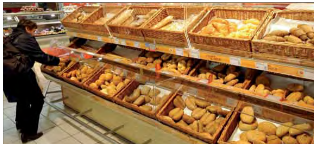
Väčšina ľudí si nevie bez čerstvého pečiva raňajky predstaviť.

V prípade praženic so slatinou, napriek tomu, že ide o kalorické a výdatné raňajky, nemusia byť vždy nevhodné. „Pokiaľ cez deň plánujete vysokohorskú turistiku alebo v práci vynakladáte veľa fyzickej aktivity, dokážete spáliť aj živočišné tuky alebo vajčká, ktoré sú zdrojom plnohodnotných bielkovín,“ povedala Béderová. Pre prácu v kancelárii sú však vhodnejšie ľahšie raňajky, ktorých trávenie nezaťažuje organizmus a neutlmí mozog. red TASR