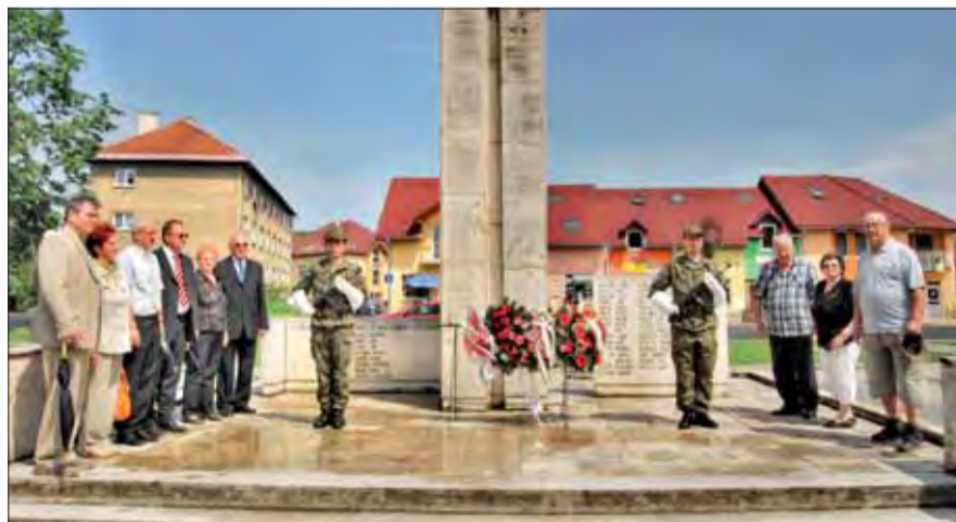
Pietna spomienka v Poltári.