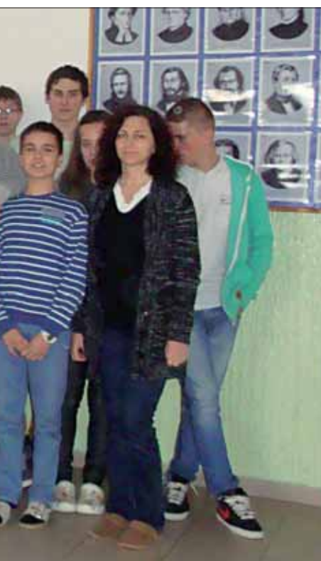
ZŠ vo Svidníku.