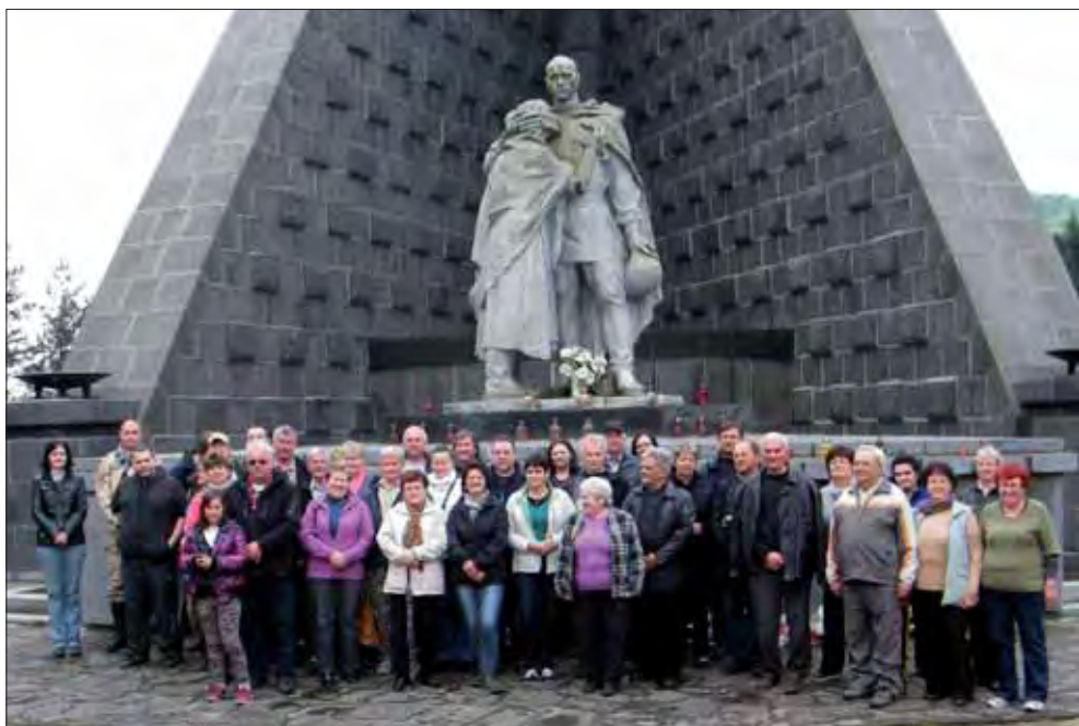
Členovia ZO SZPB z Dolných Vesteníc pri pamätníku na Dukle.