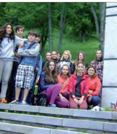
ri pamätníku, ku ktorému žiaci položili ov.