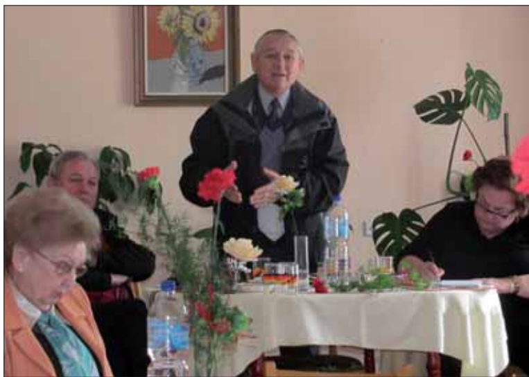
Z rokovania predsedníctva ObIV SZPB v Rimavskej Sobote.