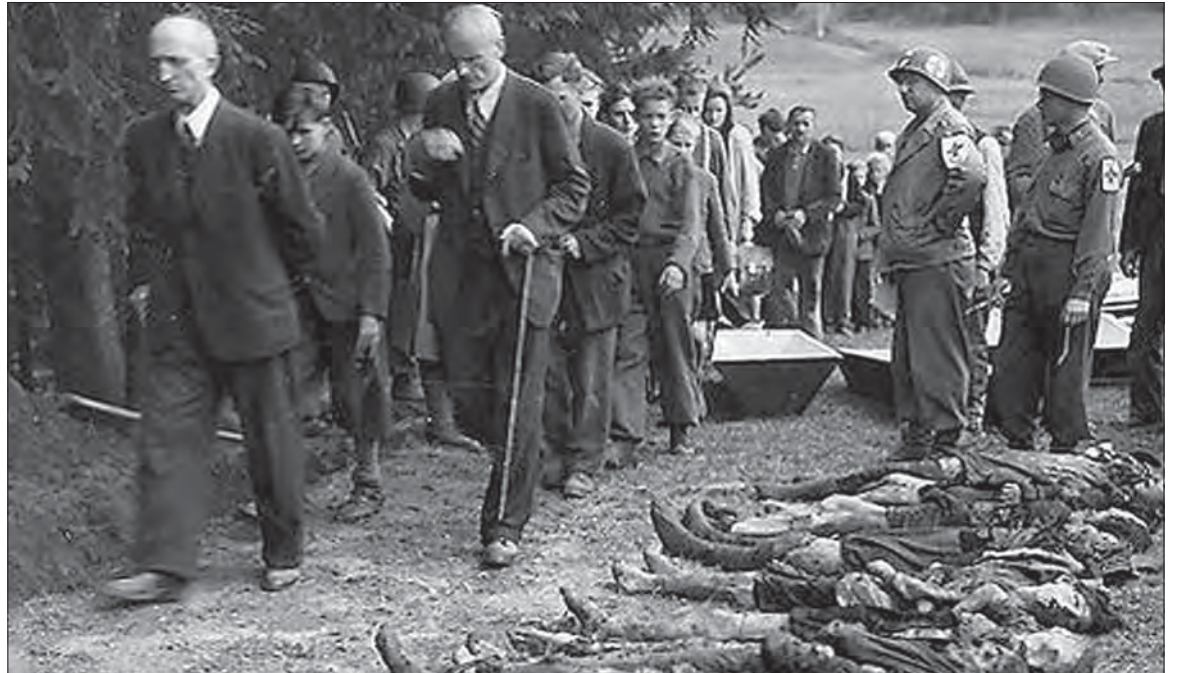
Odsun Nemcov bol odplatom za hrôzy v 2. svetovej vojne. Americkí vojaci prinútili sudetských Nemcov prejsť okolo mŕtvol židovských žien.

Podľa kapitoly 6, článku 3 Nemecko neuplatní námietky proti spojeneckým štátom ani jednotlivcom vzhľadom na použitie ne-