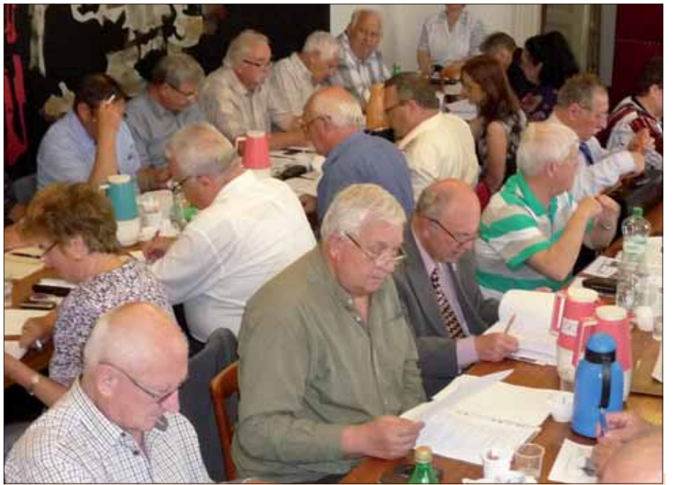
Momentka z rokovania.