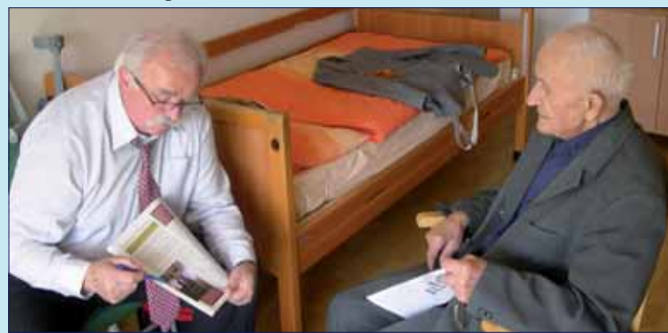
No a tu o vás písala Ročenka odbojárov.

Po vojne sa vrátil do civilného života a začal pracovať v Bieli v okrese Trebišov na železničnej stanici, pri obsluhu telegrafu a osobnej pokladni. Po určitom čase bol preložený na železničnú stanicu Čierna n/Tisou. V roku 1960 zakladá v Čiernej n/T. ZO