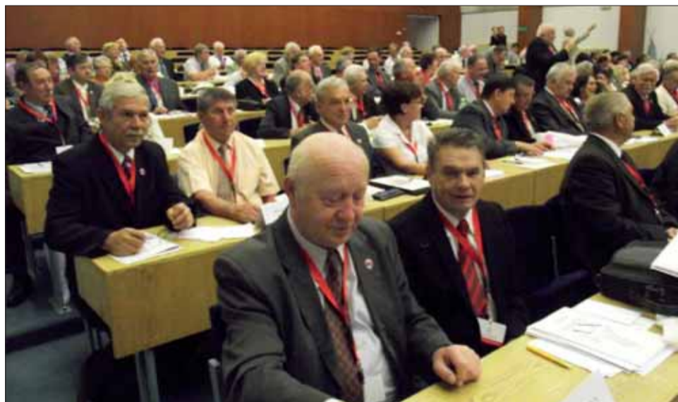
Pohľad na rokovaciu sálu a delegátov.