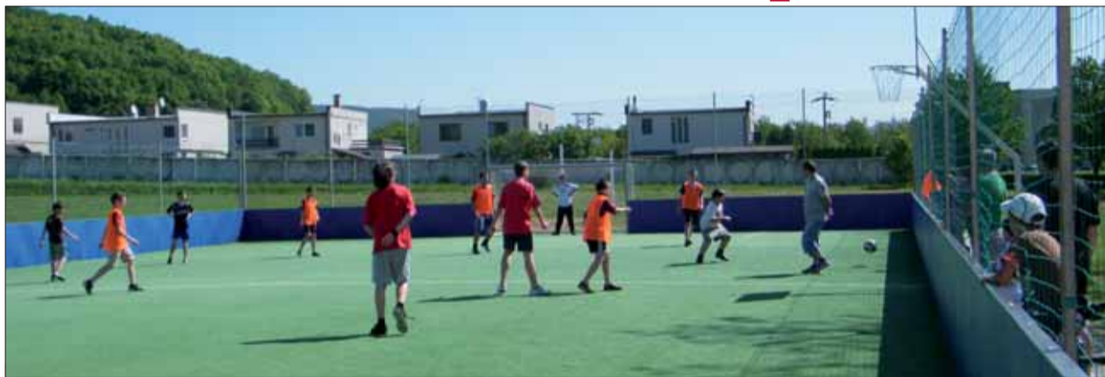
Aj športom sa dá pripomenúť si ukončenie druhej svetovej vojny.