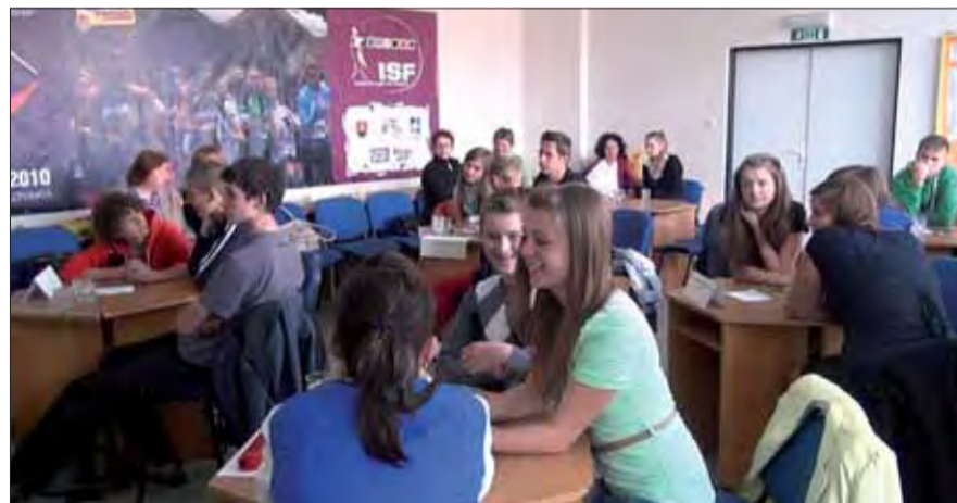
Školáci predviedli svoje vedomosti o druhej svetovej vojne.