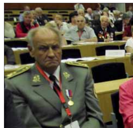
Pohľad na delegáciu maďarských antifas...