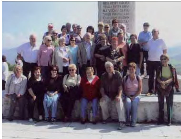
Členovia ZO SZPB Tr. SNP v Banskej Bystrici počas výletu.