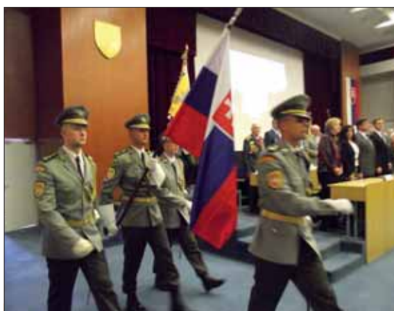
Vlajkonosiči Ministerstva obrany SR.