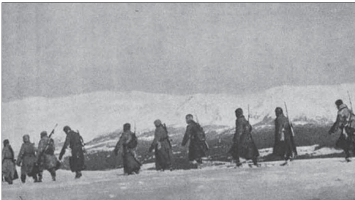
Na prednáške odprezentovali aj historické fotografie z obdobia bojov 1. československého armádneho zboru o Liptovský Sv. Mikuláš.