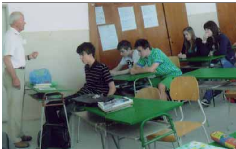
Beseda so žiakmi.