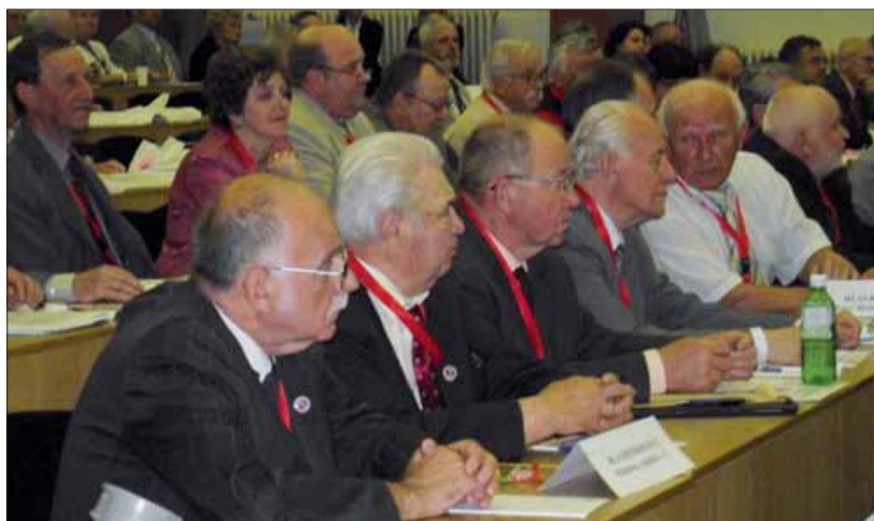
Delegáti zjazdu z východného Slovenska a z Nového Mesta nad Váhom.