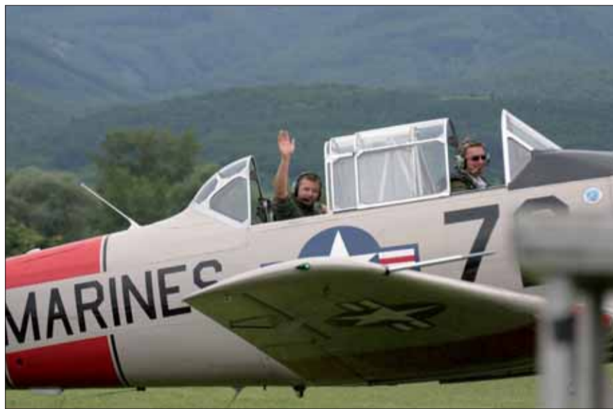
Na leteckom dni sa predstavilo množstvo lietadiel.