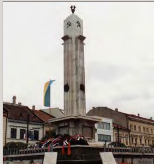
Pohľad na pamätník v Prešove.