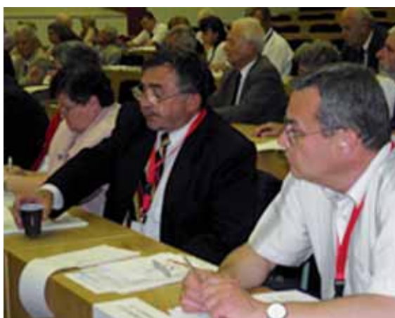
Delegáti zjazdu počas rokovania.