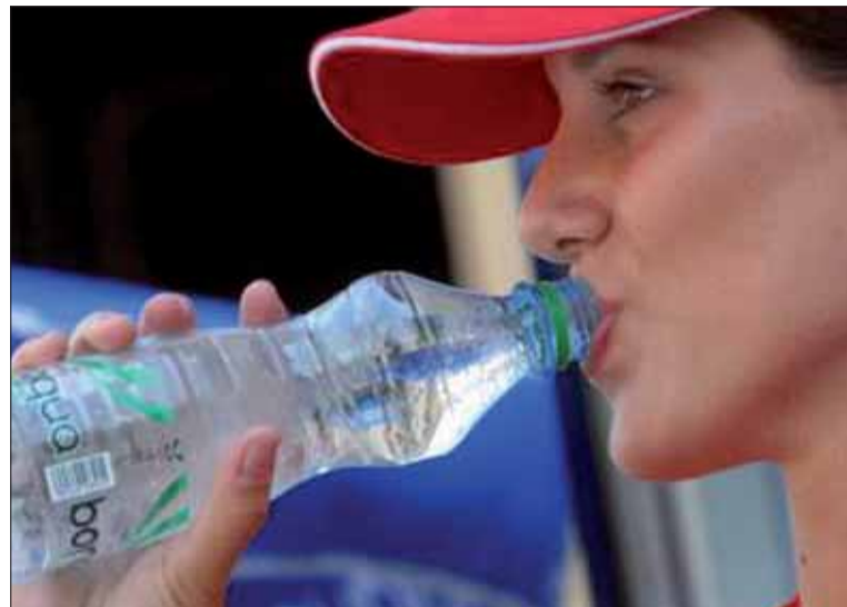
V lete je dodržiavanie pitného režimu veľmi dôležité.

Oxid uhličitý zabraňuje rozmnožovaniu väčšiny mikroorganizmov. Môže priaznivo ovplyvňovať chuť minerálnej vody a v malom množstve podporiť trávenie. Vodu s obsahom oxidu uhličitého by však nemali piť dojčatá, deti a osoby trpiace napr. na ochorenia srdca, gastritídu alebo vredové ochorenie žalúdka a diabetici so sklonom k acidóze. Pri príprave stravy pre dojčatá je potrebné odstrániť oxid uhličitý varom.