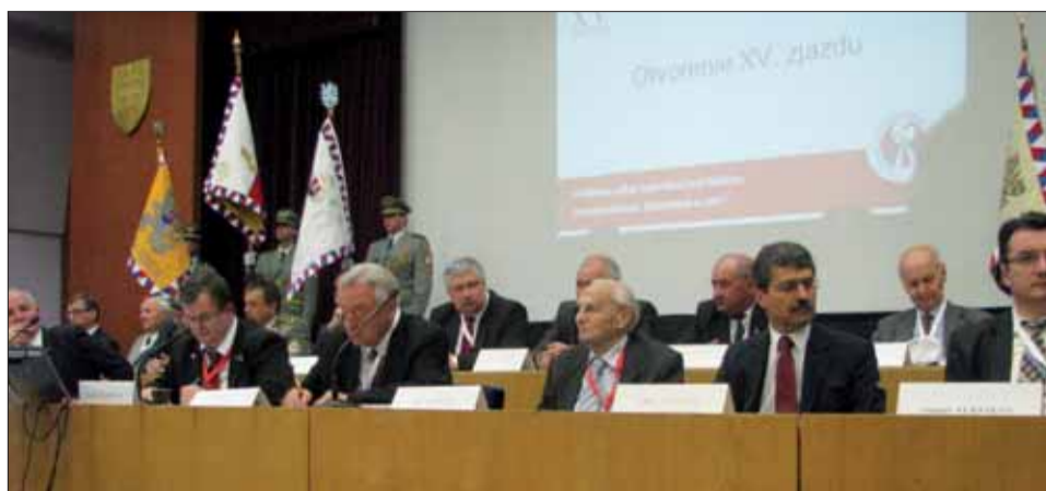
Pohľad na časť čestného predsedníctva XV. zjazdu SZPB.