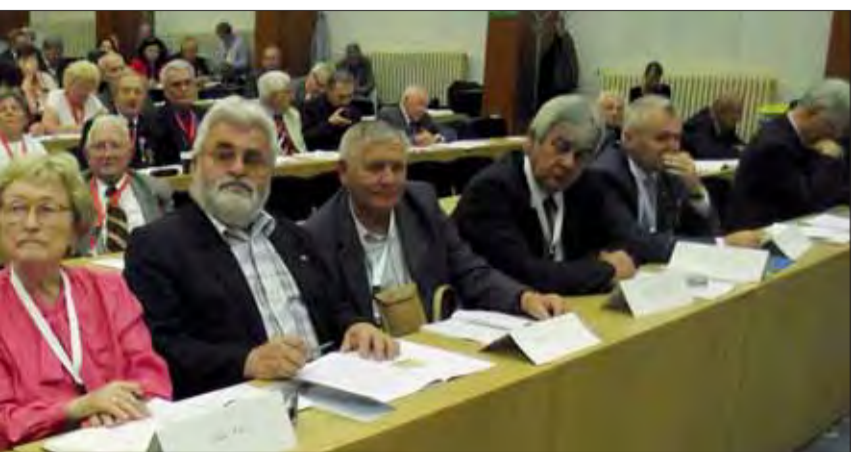
...stov a ďalších čestných hostí XV. zjazdu SZPB.