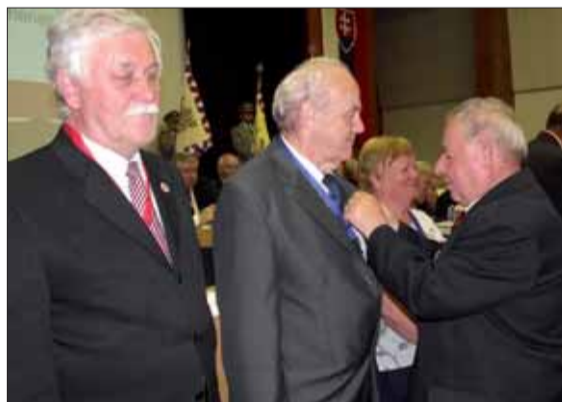
Niektorí delegáti zjazdu a hostia boli ocenení.