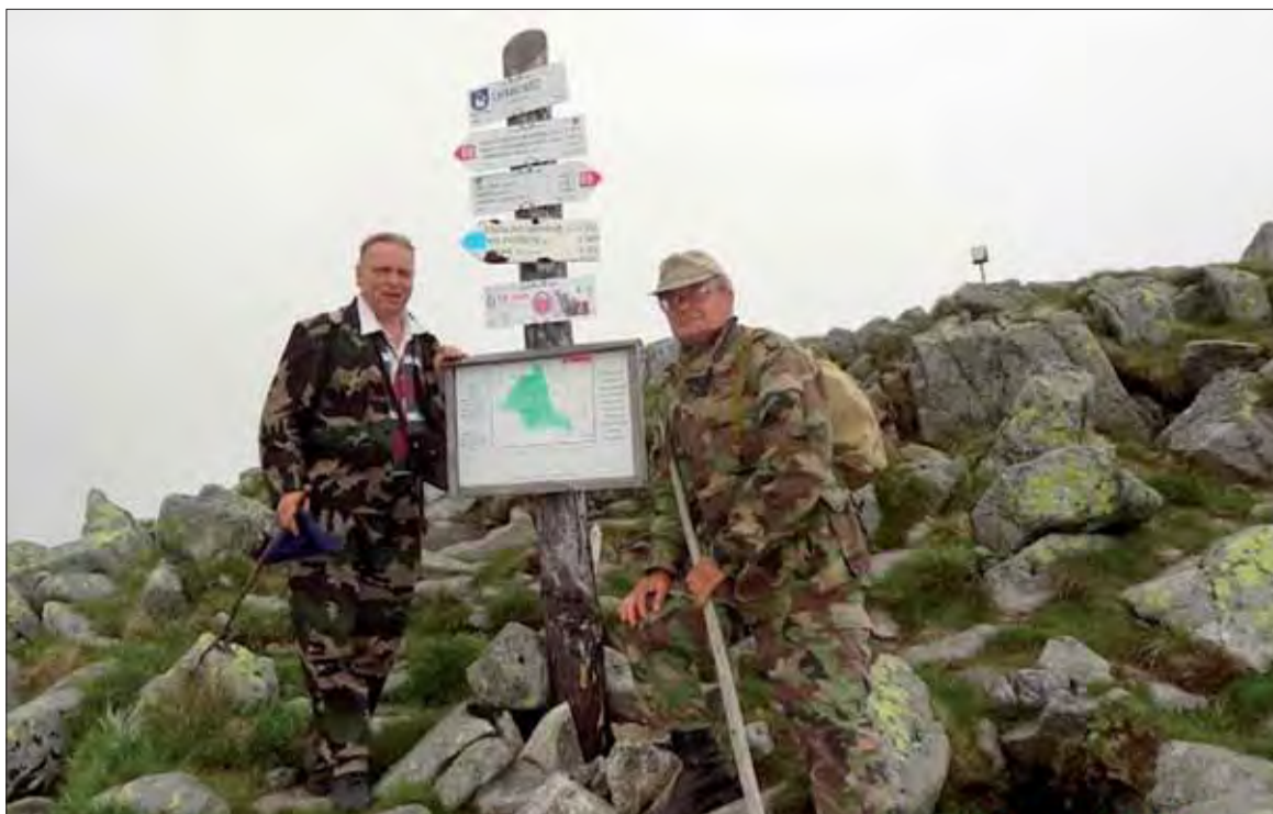
Deviateho júna sa konal už 10. ročník výstupu na Chabenec.

Na útulni Ďurková každému, kto sa vrátil z vrcholu, organizáto-