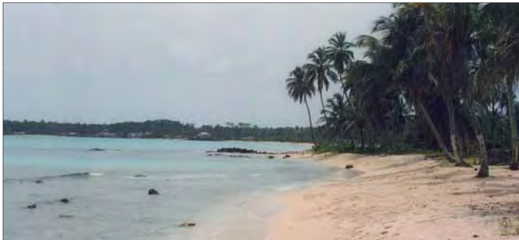
Pláž na karibskom ostrove kukurice.

letisku Isla del Maíz, kde sme pristáli, si nás všimlo iba niekoľko zvedavcov, ktorí nám s úsmevom zamávali. Majitelia rekreačného zariadenia nás výdatne pohostili znamenitými jedlami. Dozvedeli sme sa, že nikaragujská kuchyňa patrí medzi najzaujímavejšie v Latinskej Amerike. V priezračnej vode okolo ostrova sa darí morským krabom, krevetám