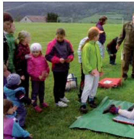
Vydarené podujatie k MDD v Pohoreleji.