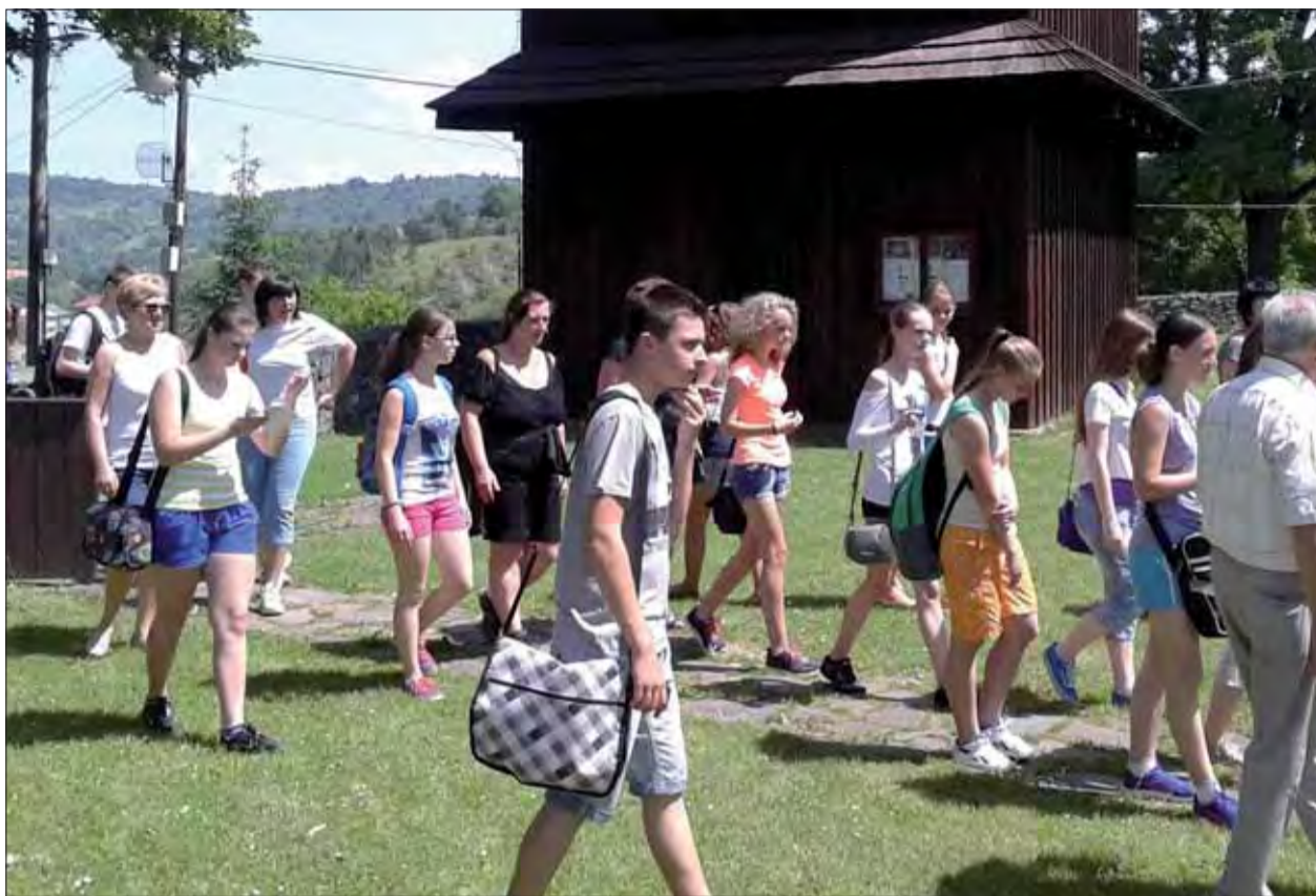
Putujeme Banskou Bystricou.