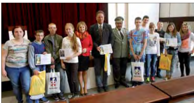
Úspešní riešitelia „medzníkov“ 2. sv. vojny.