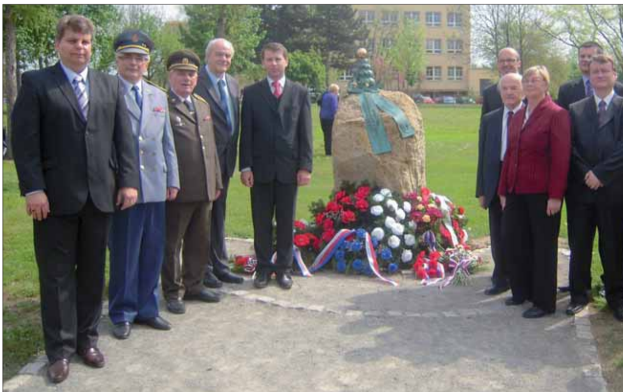
Družba základných organizácií SZPB Myjava a ČSBS Kyjov trvá už 55 rokov. Keď sa spolu stretnú, vždy je o čom sa poinformovať.

Ostatné stretnutie sa uskutočnilo v Kyjove pri príležitosti odhalenia nového pamätníka k výročiu oslobodenia mesta. Snímka zachytáva delegácie ZO SZPB Myjava a ObV SZPB z Nového Mesta nad Váhom, ktoré položili vence k pamätníku u Kyjova.