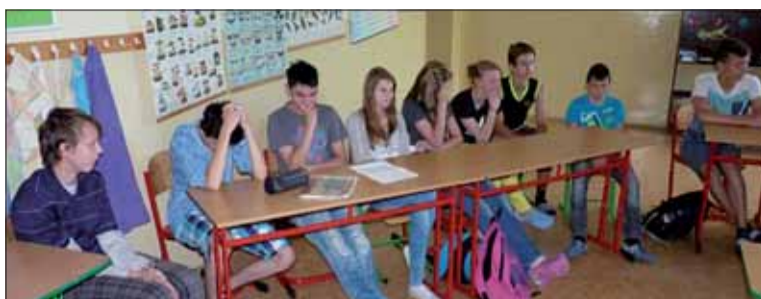
Partizáni, protifašisti... kto sú tí „naj“?