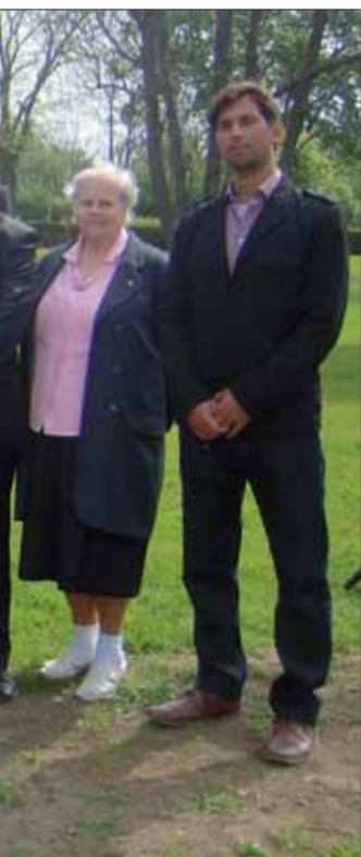
...sa porozprávať, vzájomne