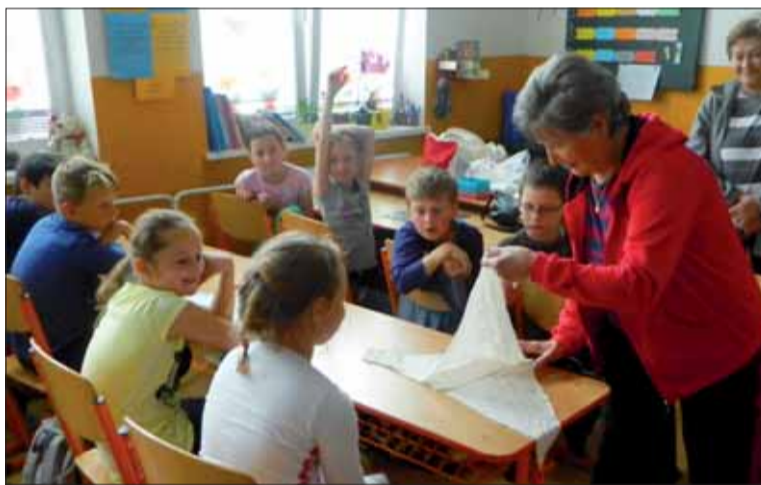
Po partizánskych chodníkoch 2014.