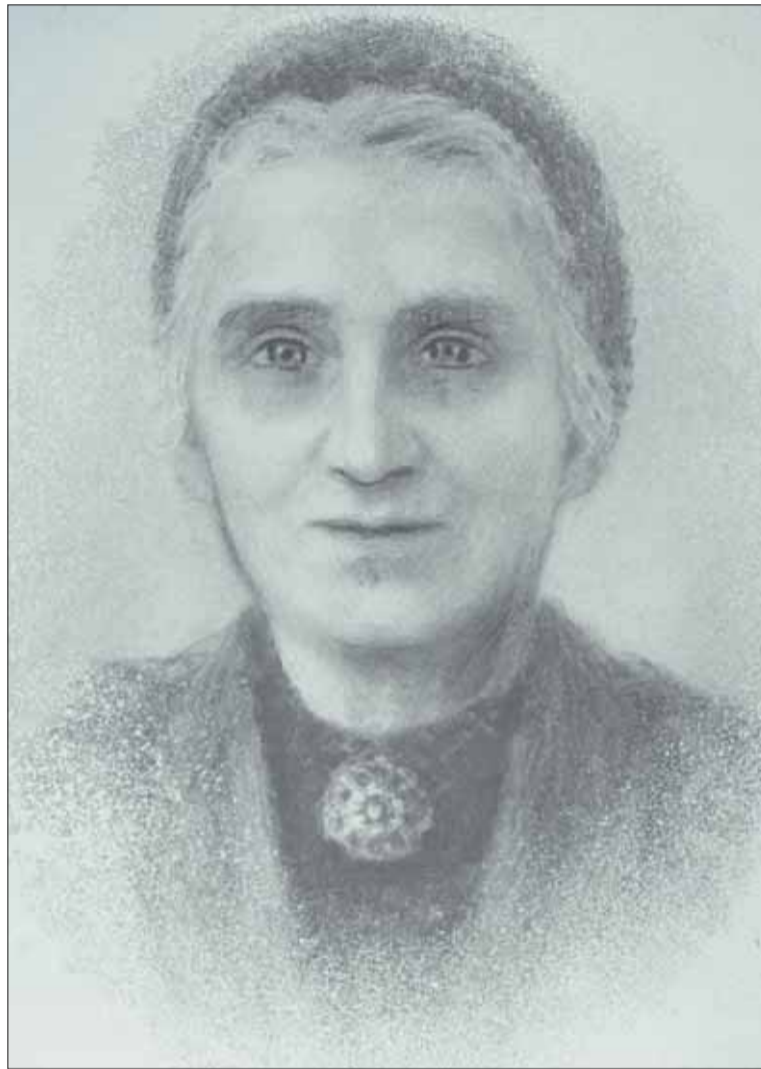
Na snímke slovenská spisovateľka, dramatička a prekladateľka Terézia Vansová.