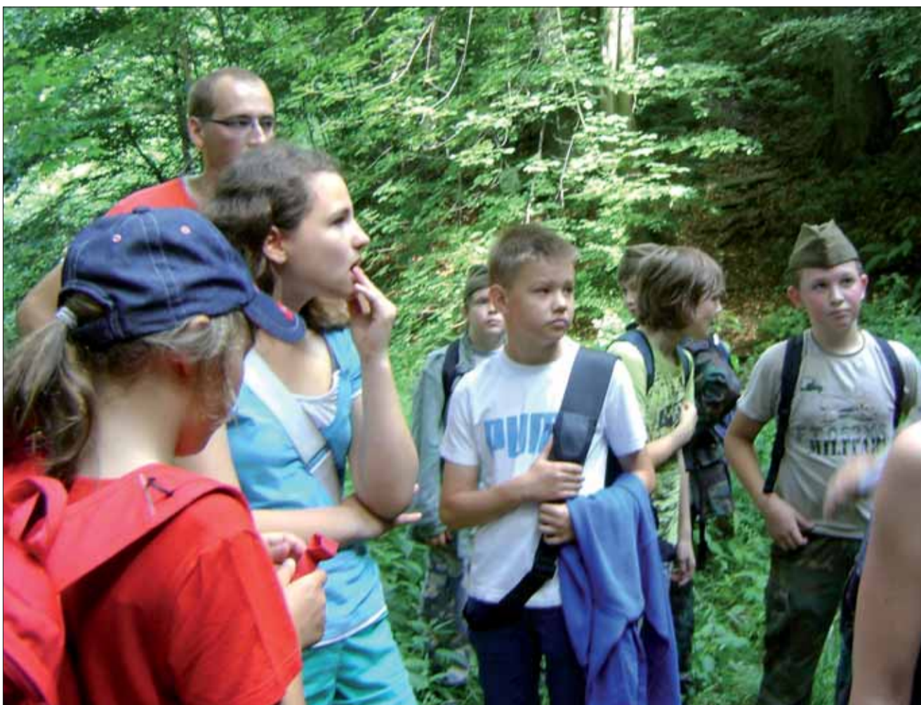
Vojnové príbehy žiaci z Lubietovej pozorne počúvali.