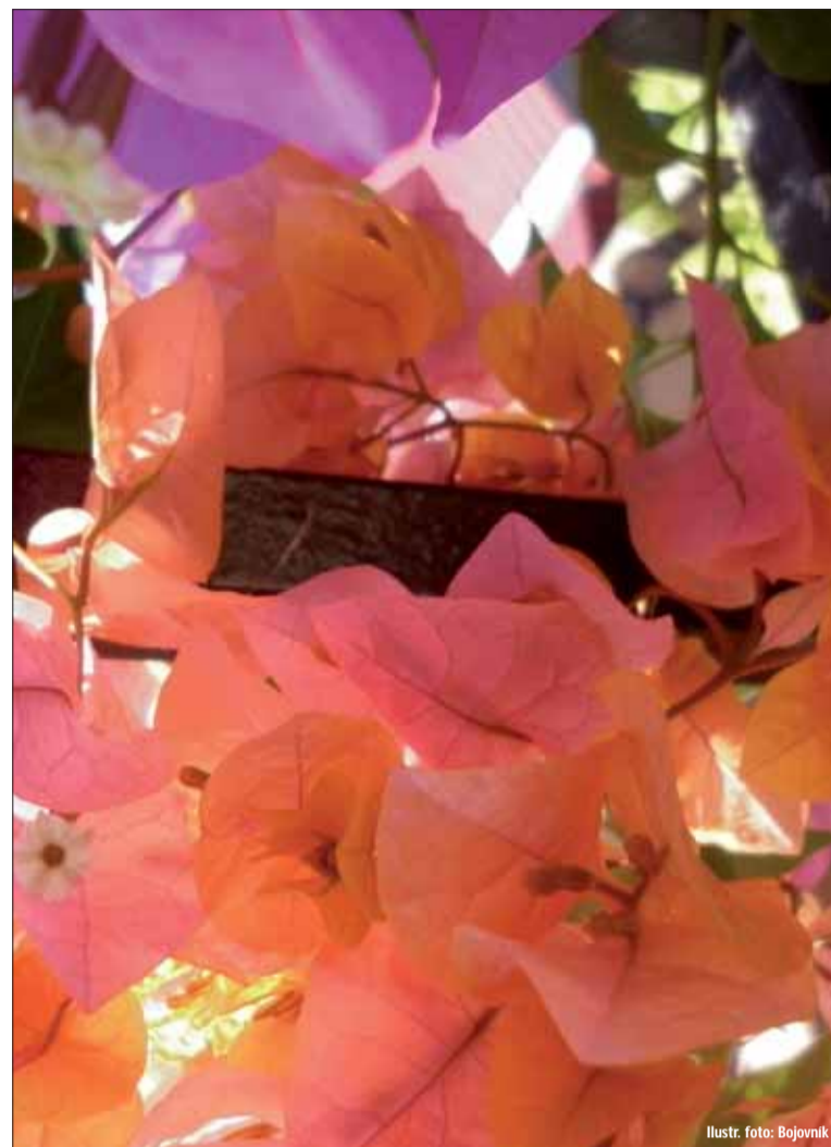
Ilustr. foto: Bojovník