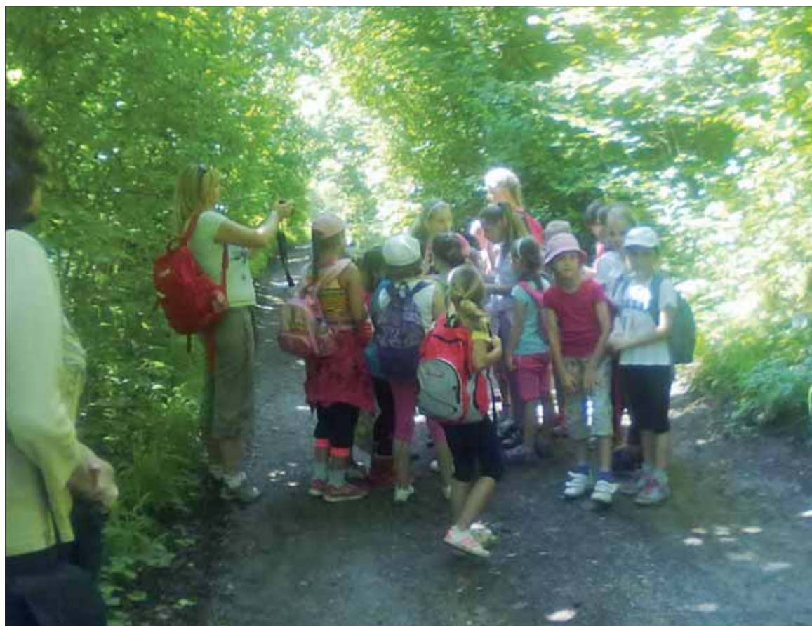
Deti zo ZŠ v Medzibrode spoznávajú vojnovú históriu v prírode.

duché, ale i napriek tomu deväť detí by bolo dobrými lovcami. Po súťaži sme pokračovali v trase. Pred koncom som rozdelila deti na chlapcov a dievčatá. Nasledovala ďalšia súťaž. Keďže partizáni veľakrát museli mlčať, rozprávali sa gestami. Chlapcom som napísala vetu „Videl som na lúke jeleňa“ – dievčatá museli podľa ukazovania uhádnuť, čo im chlapci hovoria. Veľa sme sa nasmiali. Dievčatá dostali vetu „O päť metrov je potok“. Vynašli sa obidve skupinky. Natolko sa im to zapáčilo, že som im dala ešte jednu vetu. Slniečko už začalo páliť a my sme dorazili v zdraví do hlavného tábora. Deti si posadali okolo ohniska, povybalovali nedojedenú desiatu, pitie, niektoré si urobili z palíc udice a čakali na ďalšie prekvapenie. To dorazilo o 11.00 hod. vo forme policajného auta. Policajti nám porozprávali o ich práci a deti si mohli vyskúšať