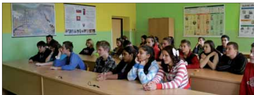
Beseda o druhej svetovej vojne ôsmakov v Revúcej zaujala.