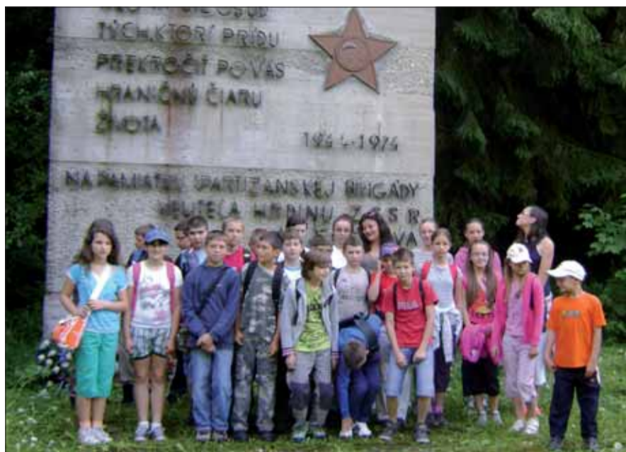
Lubietovskí žiaci počas „vyučovania“ v prírode a spoznávania vojnovnej histórie.