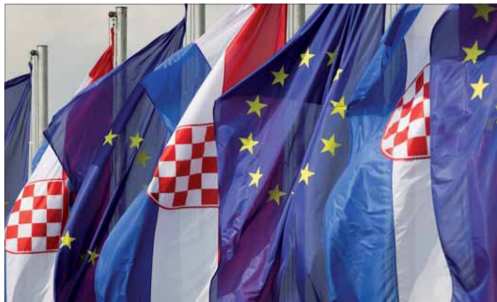
Európska únia sa opäť rozširovala. Od 1. júla po vstupe Chorvátska má 28 členov. Chorvátske vlajky spolu s vlajkami EÚ už visia v Záhrebe.

Dovolenkujúci sa v prípade núdze, ako sú dopravné nehody, úmrtia, úrazy či straty cestovných dokladov, môžu obrátiť na vysunuté konzulárne pracovisko slovenského zastupiteľského úradu v Splite. Otvorené bude od 1. júla do 31. augusta v priestoroch Honorárneho konzulátu SR v Splite na ulici Kralja Zvonimira 14/XI,