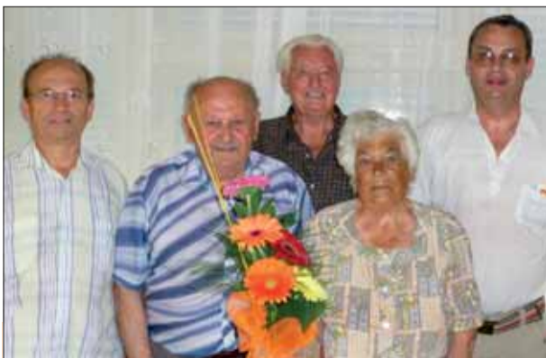
Oslávkyňa zablahoželali aj členovia Obľúbený ZO SZPB.