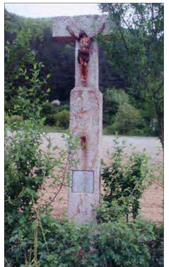
Pohľad na zanedbaný pamätník.