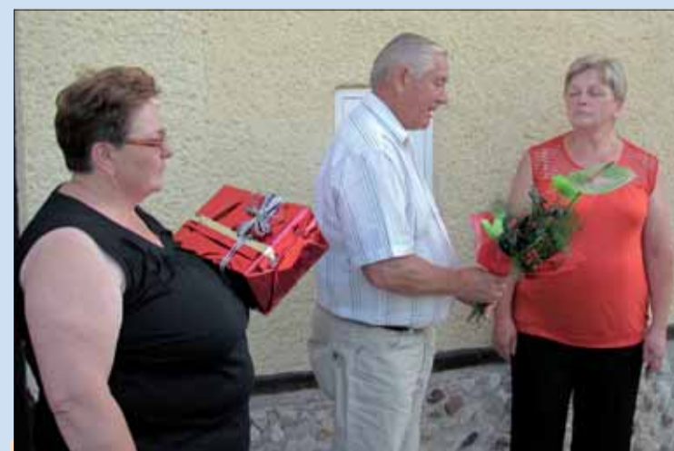
Obľv v Rimavskej Sobote zablagoželal jubilantke.