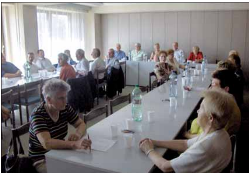
Slávnostné rokovanie OblV SZPB v Humennom.