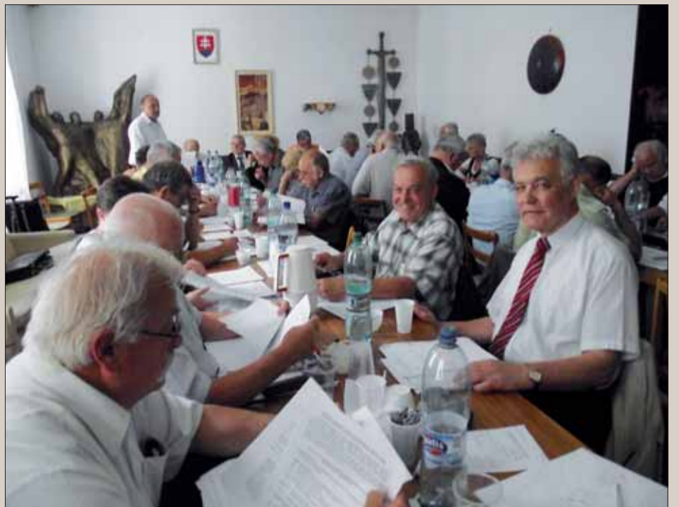
Pohľad na rokovanie Ústrednej rady SZPB 27. 6. v Bratislave.