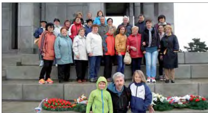
Skaličania počas návštevy Bratislavy neobišli ani Slavín, kde položili vence k pamätníku.