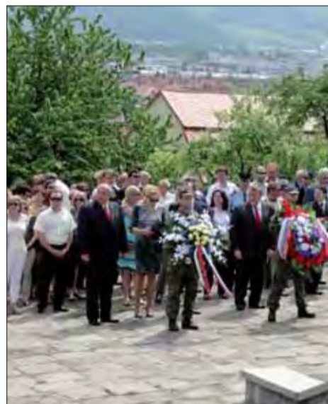
Oslavy oslobodenia v Humennom.