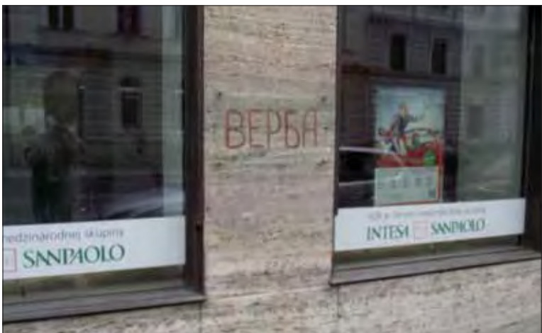
Krycí názov VERBA používali vojenské jednotky ženistov Červenej armády, ktoré odmiňovali centrum oslobodeného mesta Bratislavy začiatkom apríla 1945.