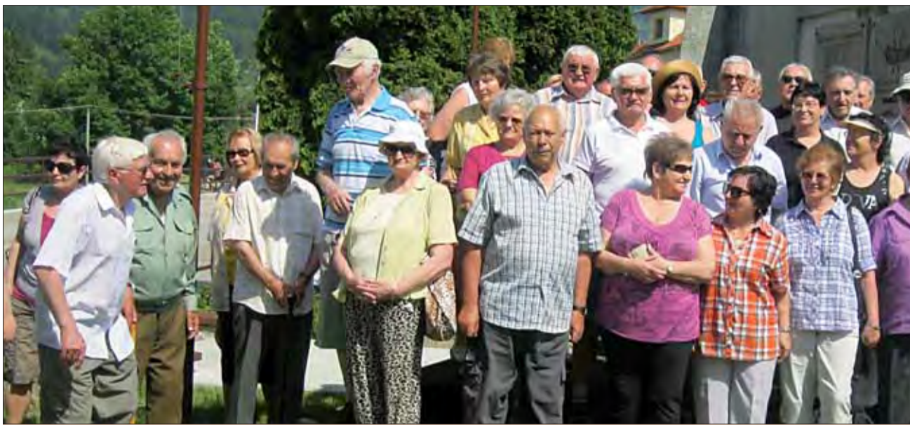
Členovia ZO SZPB Jána Rýsa Triedy SNP B. Bystrica a ZO SZPB Špania Dolina pri pomníku Osloboditeľov obce Lúčky.