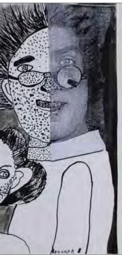
nusková – 8 r.