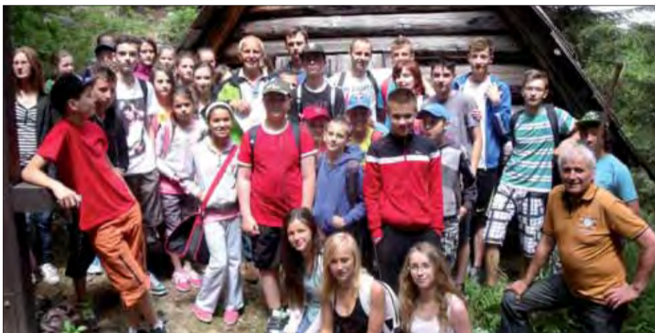
Spoločná snímka tematický zjazd so žiakmi základnej školy k partizánskej nemocnici v Roháčoch pod vrchom Salatín.