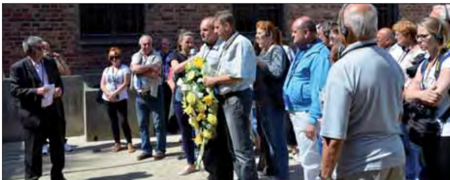
Na znak piety sme na tomto pamätnom mieste položili veniec z kvetov a zapálili svetlo kahanca.