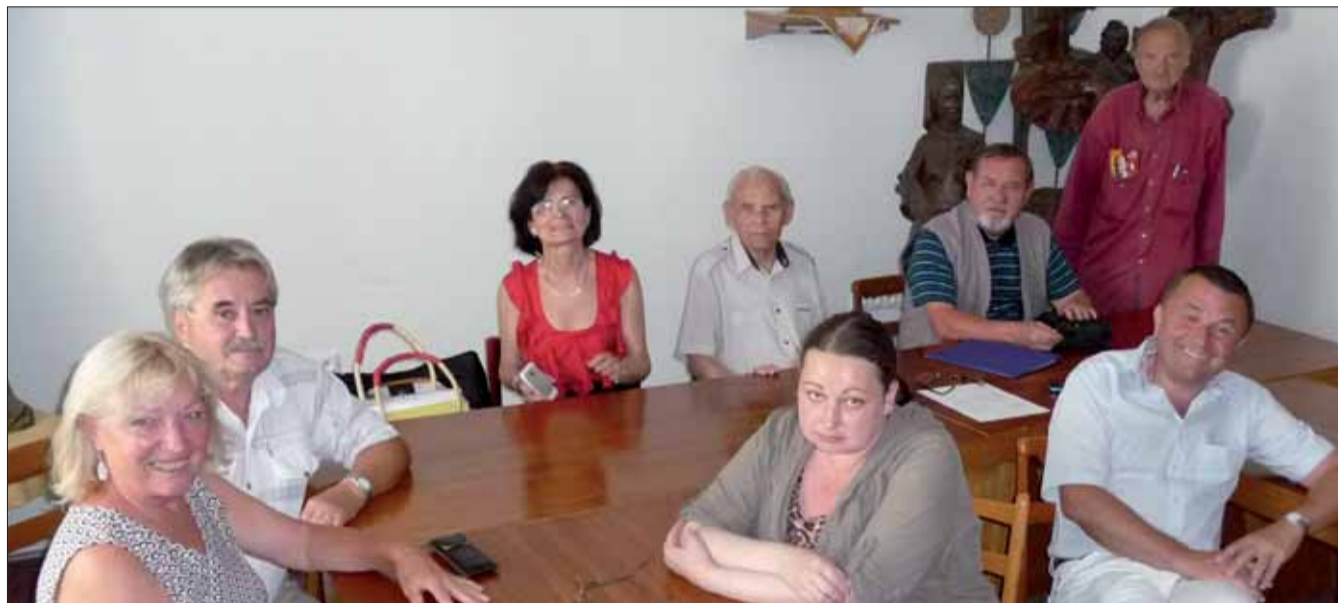
Júnová členská schôdza 19. ZO SZPB Bratislava – Petržalka riešila taký široký rozsah tém, že by sa zaň nemuselo hanbiť ani výročné rokovanie.

Podľa rusnovosti.ru, 26. jún 2014A. M., podľa nydailynews.com