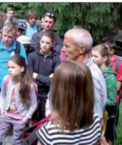
protifašistického odboja a veterán