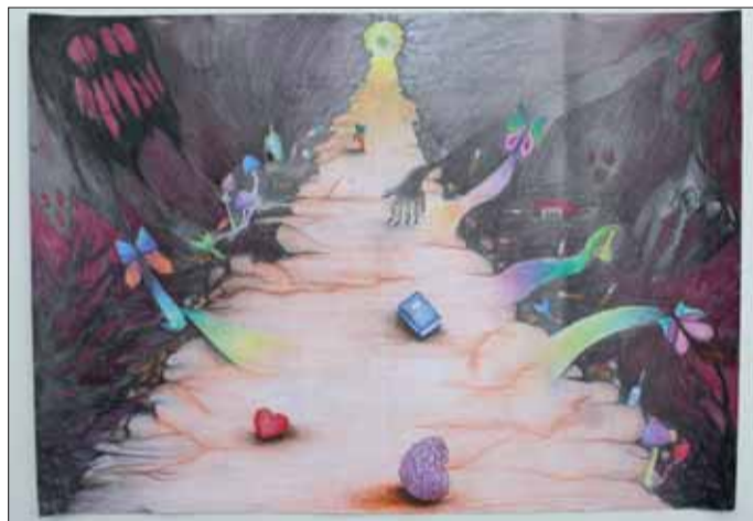
2. miesto – Katarína Lehotská.