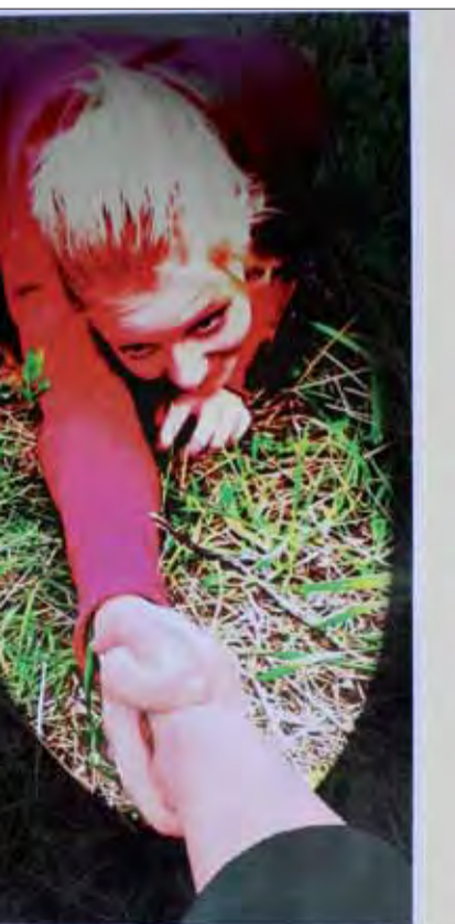
anová – 13 r.