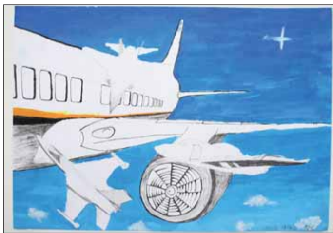
1. miesto – Jakub Vereb – 10 r.