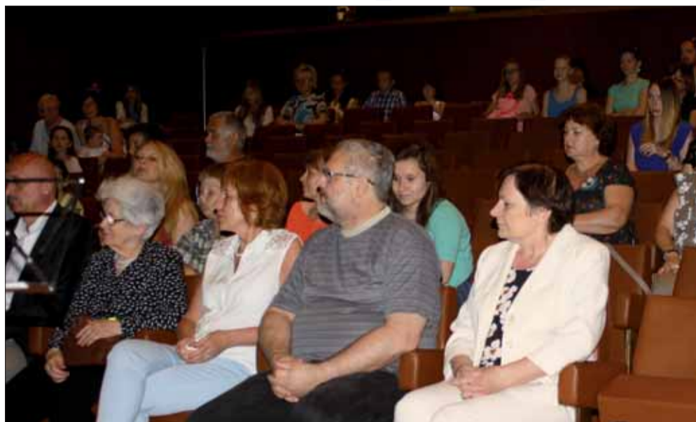
Momentka zo slávnostného odovzdávania cien.

Vo vzťahu detí k téme SNP sme si, najmä v literárnej kategórii, všimli, že najlepšie práce sú tie, kde deti opisujú svoj vlastný pohľad a vnímanie vojnových udalostí, prípadne posudzovanie toho, ako k SNP pristupujú ich rovesníci. Veľakrát citlivo a inteligentne.