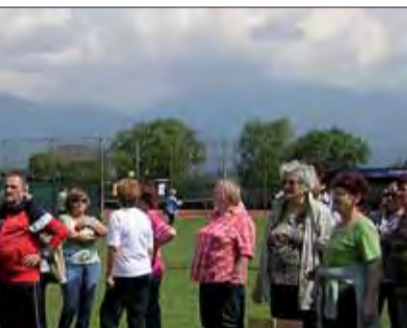
futbalovom ihrisku v Dražkoviach pri v strelbe zo vzduchovky, vo vrhu guľou, e, v behu a raritou bol hod kuchynským ie má na to lepšie predpoklady. Š. Tichý