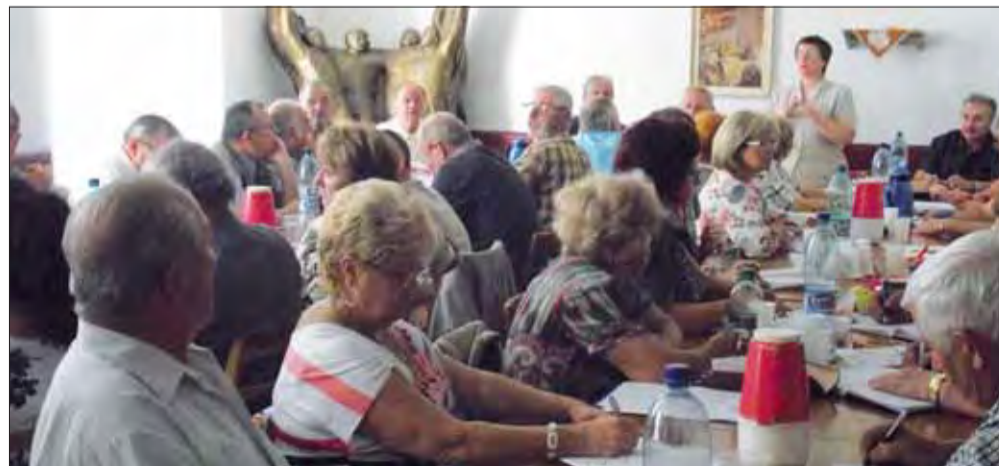
Väčšina tajomníkov oblastných výborov sa porady zúčastnila.