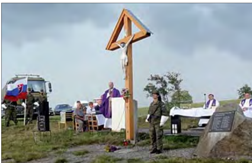
Súčasťou spomienky v lome nad Rimavicou bola aj svätá omša.