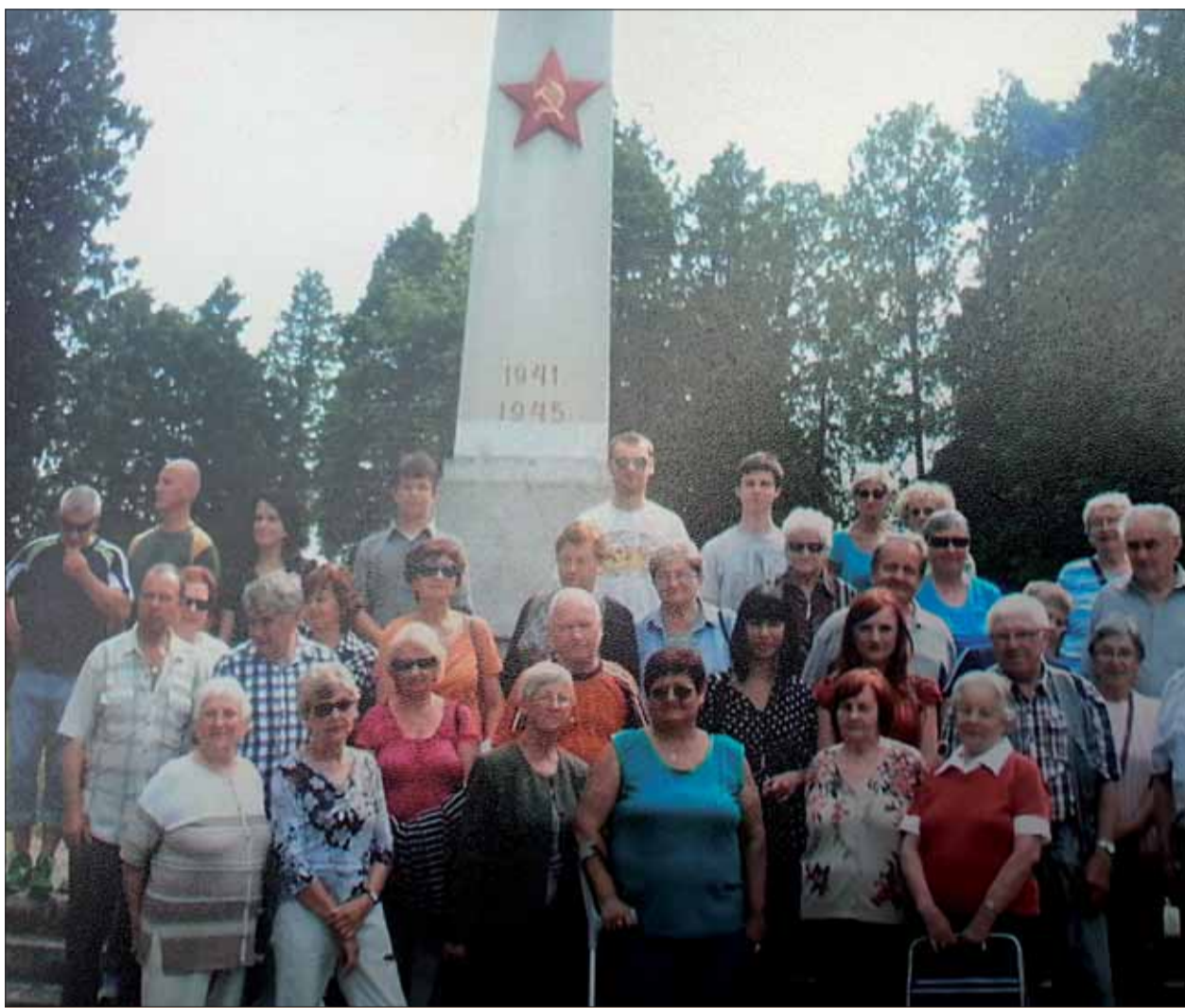
Účastníci poznávacieho výletu do Žiliny.