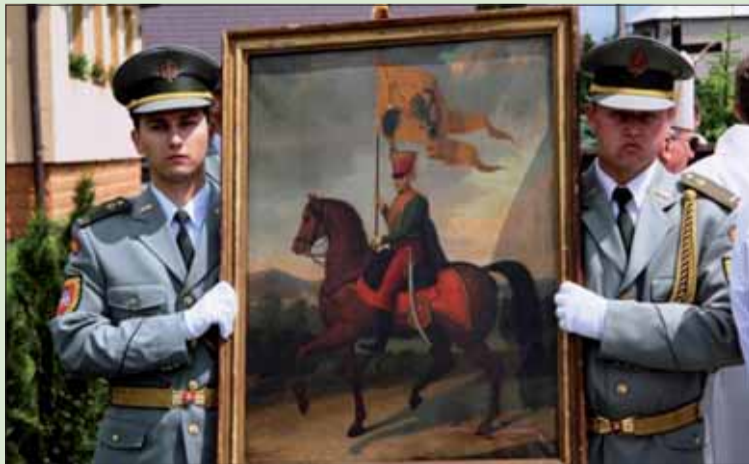
Vojaci nesú obraz s „večným vojacom“