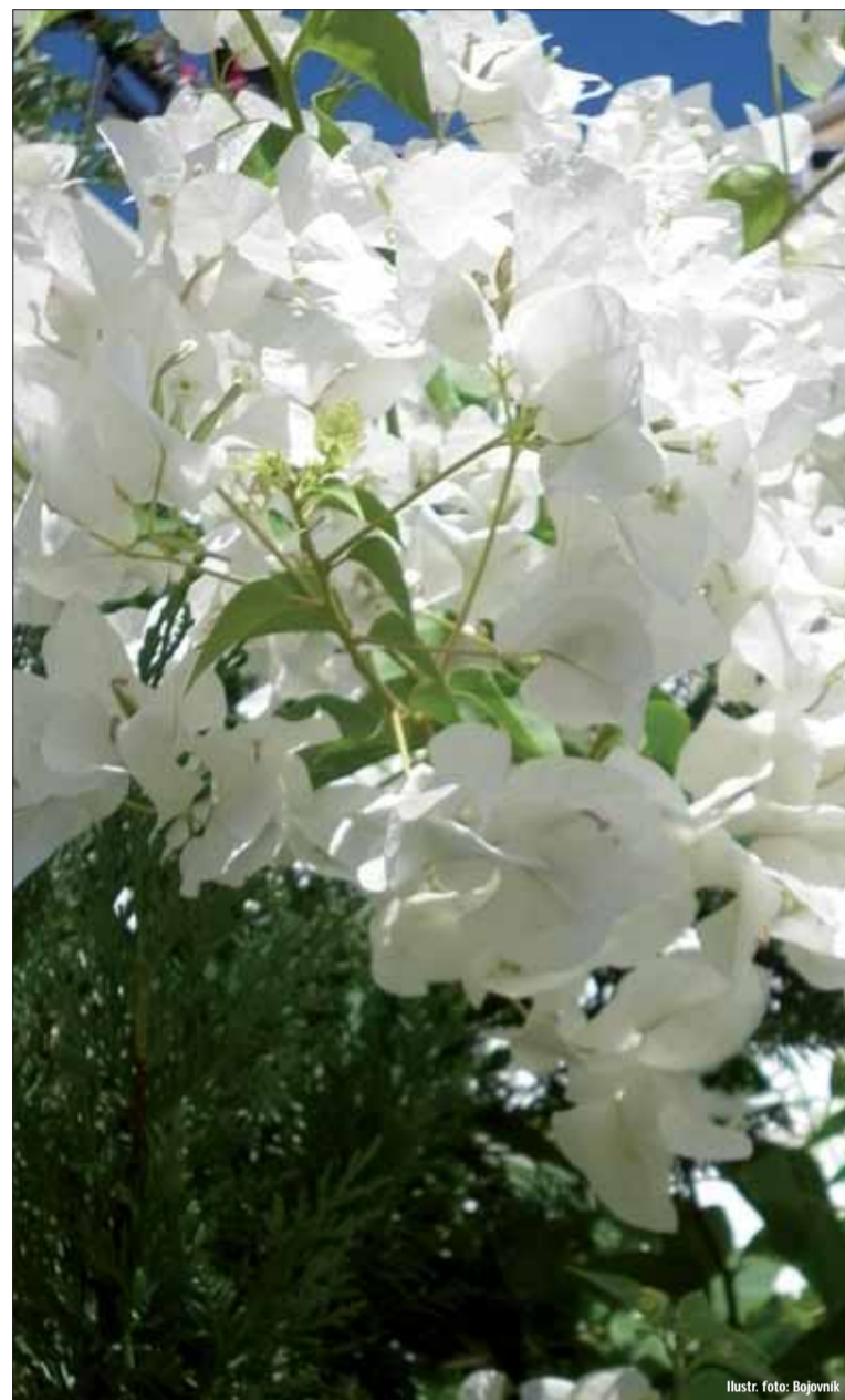
Ilustr. foto: Bojovník