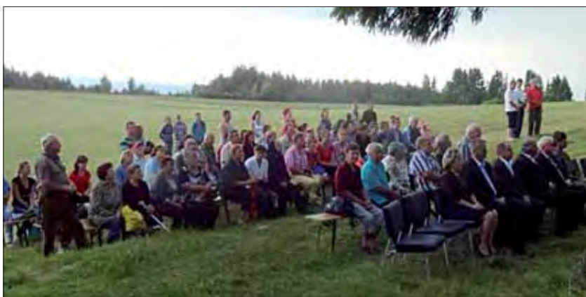
Pád lietadla v Lome nad Rimavicou si prišlo pripomenúť množstvo ľudí.