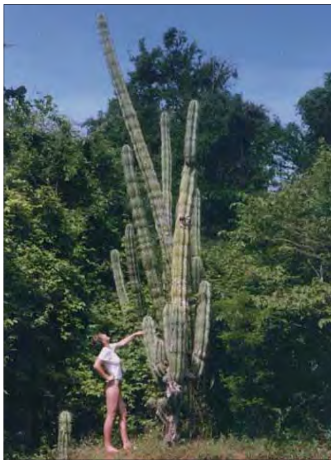
Desať metrové kaktusy na pobreží.

Pláže v Pochomile sú pripravené pre každého a okrem nich sa využívajú pláže v El Velere a El Transite. Obe sú skalnaté, čo vyžaduje zvýšenú pozornosť plavcov pri prílive. Z El Velera (blízko prístavu Puerto Sandino) sa možno dostať za necelú hodinu na pláž Poneloya pri Leone