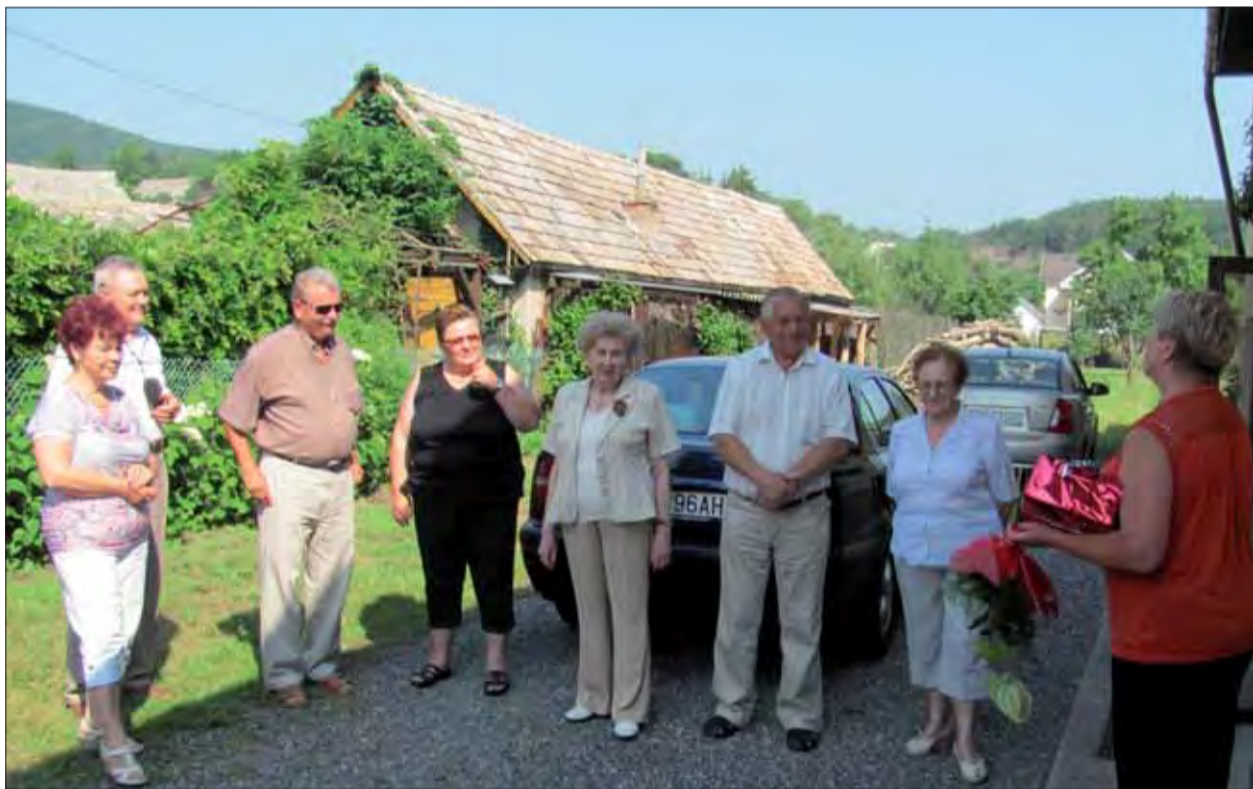
ObIV SZPB v Rimavskej Sobote sa stretol v obci Driečany.