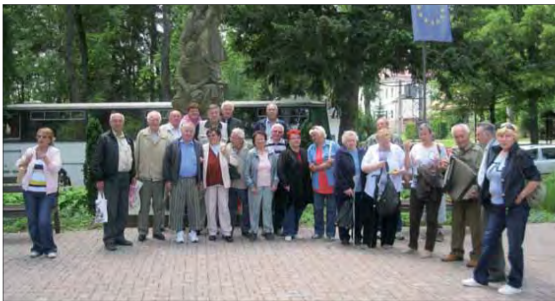
Účastníci podujatia v Španej Doline.

Základná organizácia SZPB Špania Dolina zorganizovala v polovici júna v spolupráci so spoločenskými organizáciami a vedením obce podujatie „Spoznávajú ZO SZPB v regióne“.