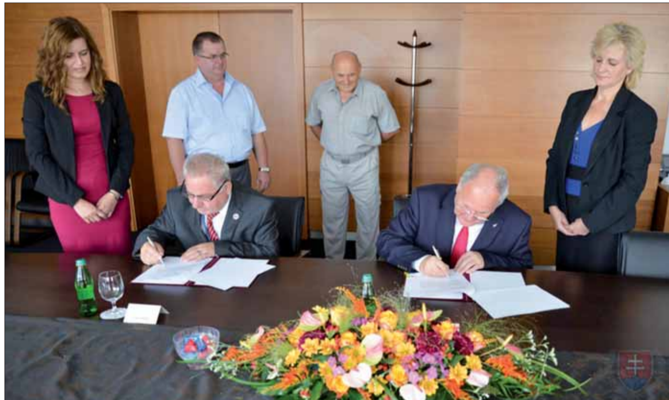
Minister školstva Dušan Čaplovič a predseda SZPB Pavol Sečkář pri podpise zmluvy o spolupráci.