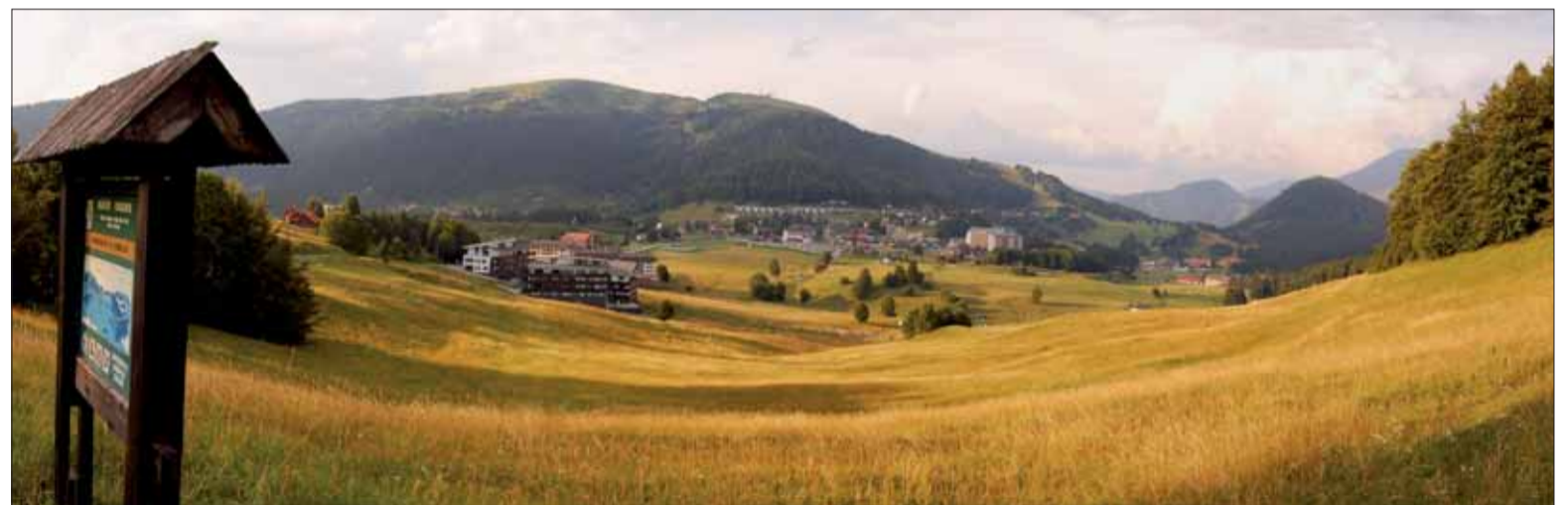
Letný pohľad na Donovaly v súčasnosti.