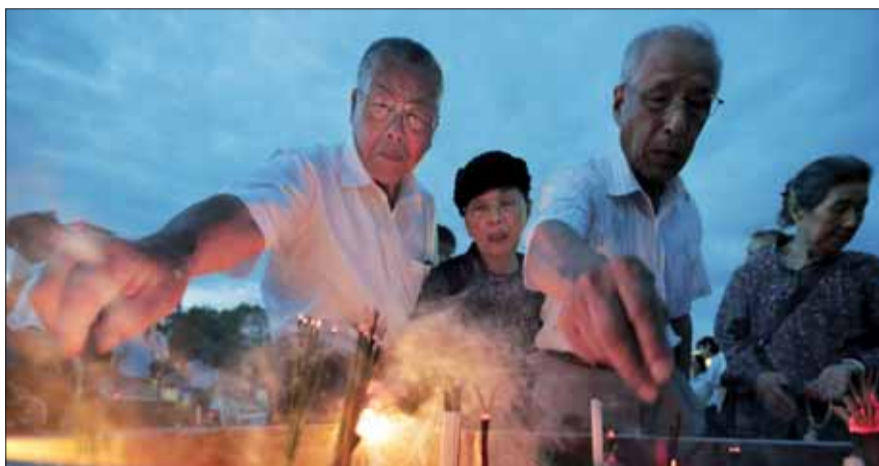
Ľudia zapalujú vonné tyčinky a modlia sa pri pamätníku obeť zhodenia atómovej bomby v Parku mieru pri príležitosti 67. výročia zhodenia atómovej bomby na mesto Hirošima 6. augusta 2012.

Desiatky tisíc ľudí, vrátane pozostalých, príbuzných, vládných predstaviteľov a zahraničných hostí, si 6. augusta v miestnom parku pripomenuli 67. výročie