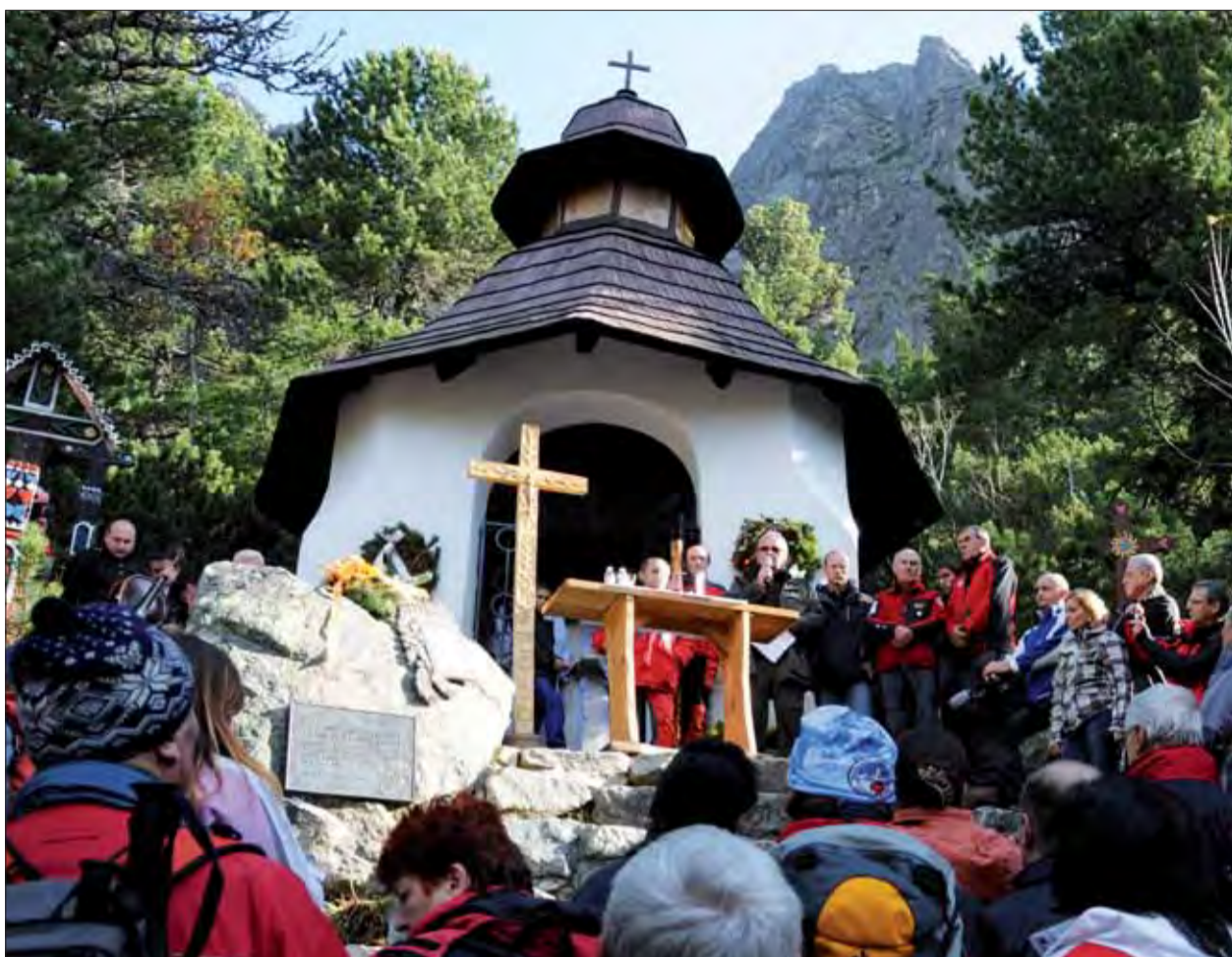
Pamätná tabuľa v Symbolickom cintoríne, ktorá pripomína obeť leteckej havárie na Zadnom Gerlachu z roku 1944