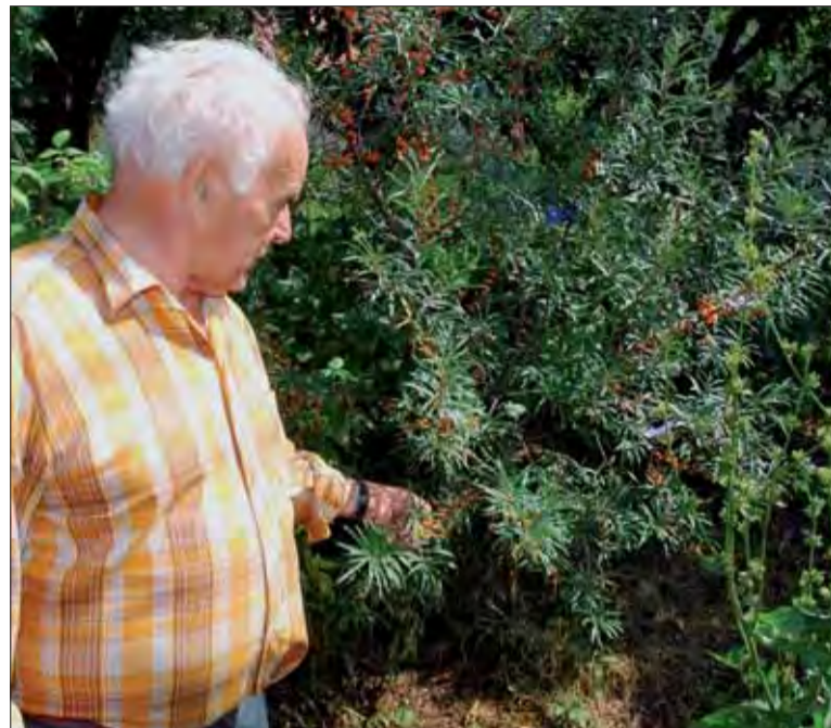
Ešte pred zberom sa tiež treba oboznámiť, ktorá časť sa z rastliny zbiera.

Botanička odporúča naštudovať si v dostupnej literatúre, ako si namiešať správnu bylinkovú zmes.