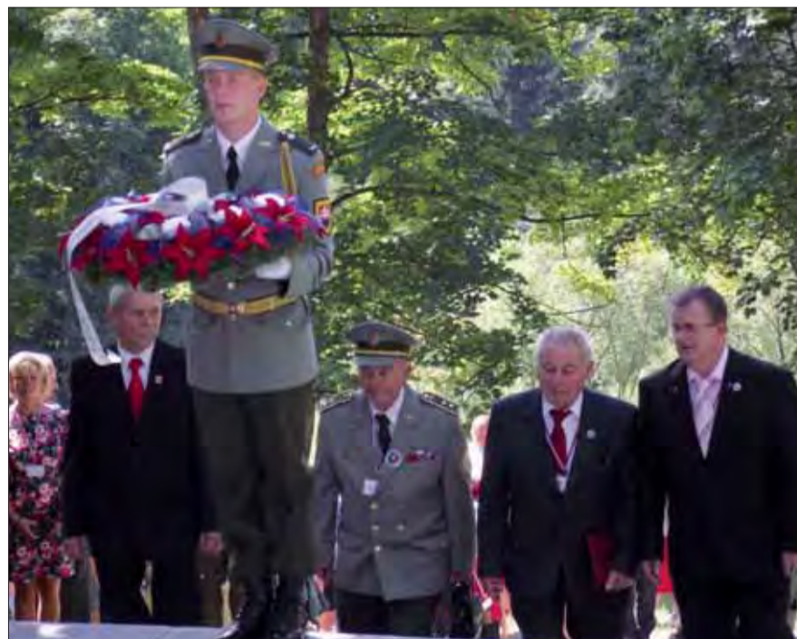
Delegácia SZPB počas pietnej spomienky na Kališti.

Oblasťný výbor Slovenského zväzu protifašistických bojovníkov v Banskej Bystrici spolu s Múzeom SNP, Banskobystrickým samosprávnym krajom a ďalšími spoluorganizátormi, pripravili dôstojnú spomienku na obeť Kališťa a účastníkov boja proti fašizmu, na ktorú pozvali domácich a zahraničných ústavných činiteľov, diplomatov, predstaviteľov štátnej správy, samosprávy, zástupcov vypálených obcí, partnerských organizácií a ďalších hostí. red