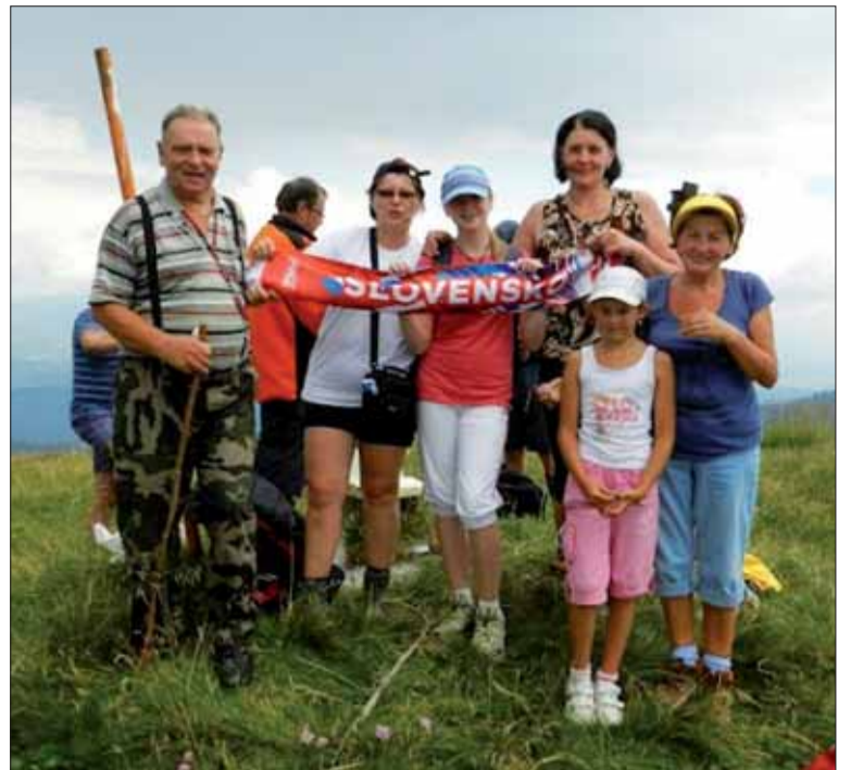
Účastníci výstupu na Veľký Bok.