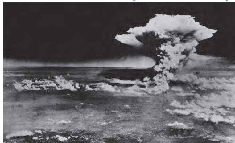
Na archívnej snímke zo 6. augusta 1945 poskytnutej americkou armádou pohľad na hrbovitý oblak, ktorý stúpa k oblohe asi hodinu po výbuchu atómovej bomby v japonskej Hirošime.

Už v priebehu druhej svetovej vojny sa podarilo v USA realizovať nákladný, tzv. manhattanský projekt, ktorého cieľom bolo zostrojiť atómovú bombu. Prvý pokus s ató-