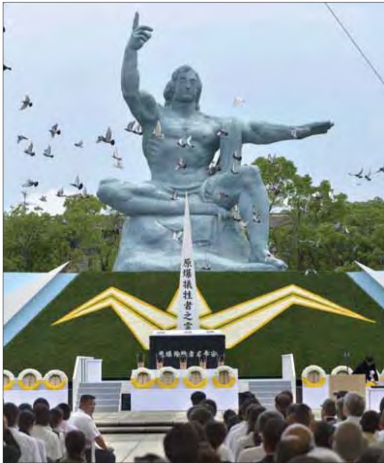
Holubice poletujú nad Sochou slobody pri príležitosti 67. výročia zhodenia atómovej bomby na Nagasaki 9. augusta 2012.

Na mieste epicentra výbuchu, na Ústrednom námestí v Parku mieru, vybudovali v rokoch 1949-56 pamätný komplex podľa návrhu architekta Kenzóa Tanga. Od roku 1955 sa v Hirošime a Nagasaki každoročne konajú medzinárodné konferencie za zákaz atómových a vodíkových zbraní. V septembri 1956 bola otvorená nemocnica pre obeť bombardovania vo štvrti Sendamati. V auguste 1964 Svetová rada mieru udelila Hirošime ako prvému mestu na svete zlatú medailu Joliotia – Curieho. red TASR