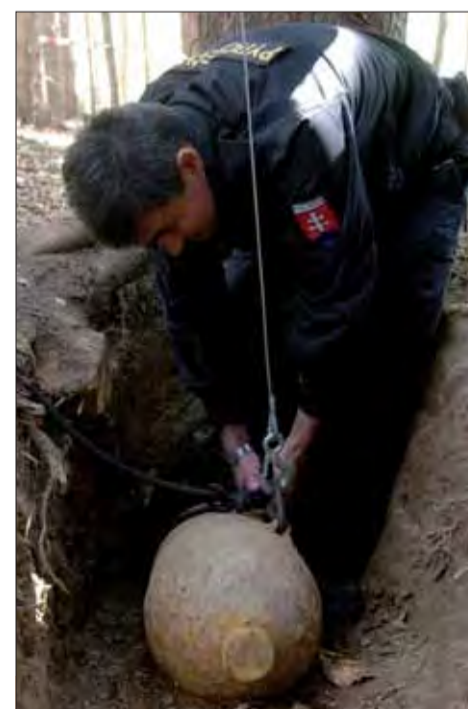
Nálezy munície z obdobia druhej svetovej vojny nie sú zriedkavé.

Nález zhruba 50 vojenských nábojov tiež nahlásil na linku 158 aj 33-ročný muž, ktorý na ne narazil počas výkopových prác za rodinným domom v obci Janík, taktiež v okrese Košice okolie. Privolovaný pyrotechnik uviedol, že ide o päť kilogramov pechotných nábojov rôznych kalibrov z obdobia druhej svetovej vojny. Muníciu prevzal na zneškodnenie, uviedla policajná hovorkyňa. red