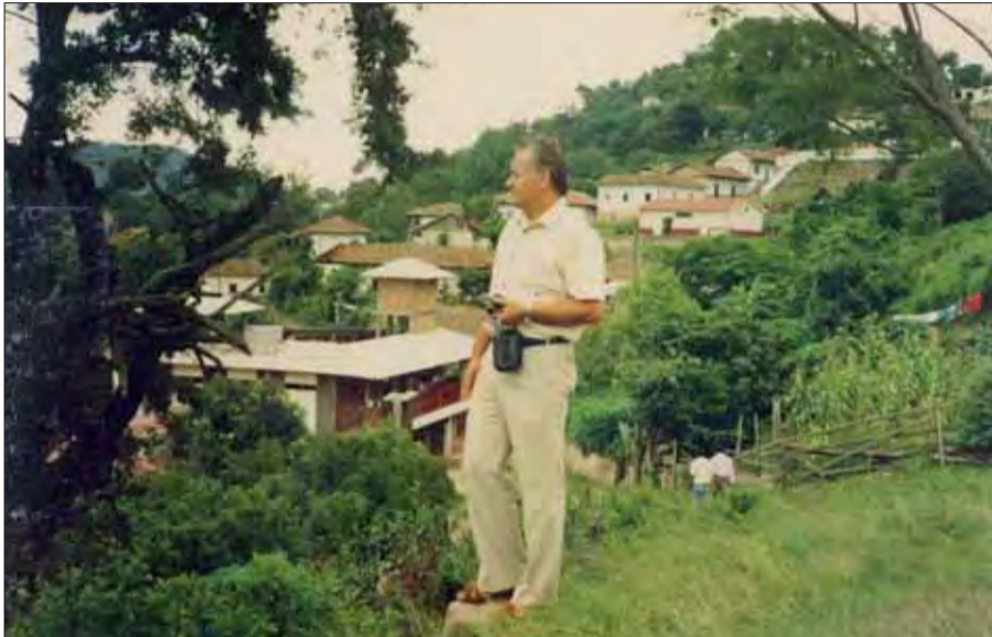
Na kopci dedinky Santa Lucia.

Prechádzali sme zeleným údolím medzi kvetinovými záhonmi. Všade panoval pokoj, dokonca aj vtáci chceli svojim spevom potvrdiť, že centrum krásy a umenia je práve tu.