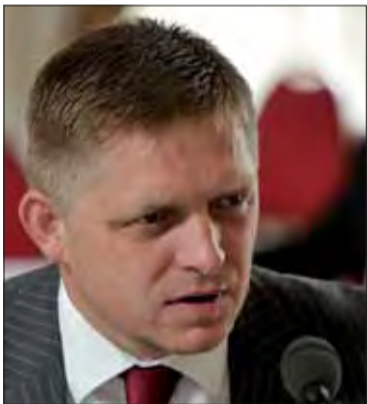
Robert FICO predseda vlády SR

– V dnešnom svete sa odohráva opätovne boj medzi rôznymi ideológiami, náboženstvami a politickými predstavami. Na výslnie sa v mnohých prípadoch dostáva aj neofašizmus. A tu si myslím, ten odkaz SNP je jednoznačný. Je našou povinnosťou nezabúdať na tie hrôzy, ktoré nacisti napáchali, a odkaz boja proti fašizmu šíriť nasledujúcim generáciám.