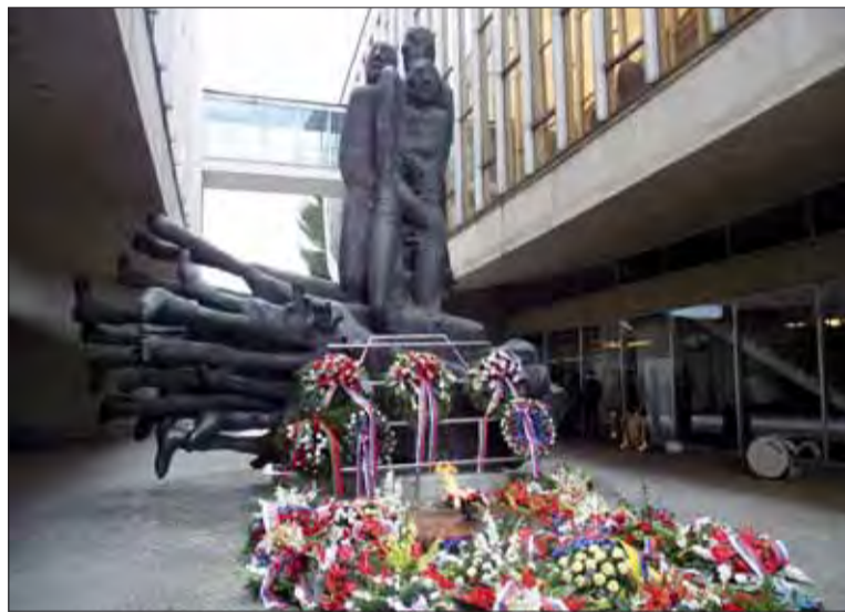
Oslavy SNP sa každoročne konajú v Banskej Bystrici.