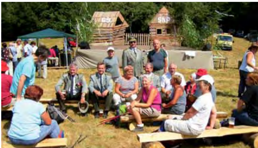
Beseda s turistami počas osláv v Petrovciach.