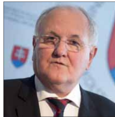
Dušan ČAPLOVIČ minister školstva, vedy, výskumu a športu

ne spravodlivosti a bojovali proti útlaku. A to je zároveň aj dôvod, pre ktorý treba SNP pripomínať a veľa o ňom učiť na školách.