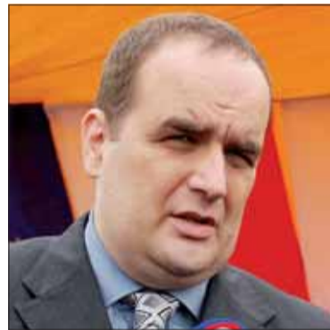
Pavol FREŠO predseda SDKÚ-DS

v 90. rokoch sme chodili „utierať prach“ z pamätníkov SNP. Aj napriek nízkemu záujmu o túto udalosť som však tradíciu zachoval a každý rok som si chodil SNP pripomínať na viaceré miesta. Našťastie sa situácia postupne mení a výročie Slovenského národného povstania si dnes pripomína viac a viac ľudí. A to je dobré. O povstaní by sme mali hovoriť atraktívnym a moderným spôsobom a vzbudiť aj u mladých ľudí záujem o našu vlastnú históriu. Je dôležité, aby práve mladí prichádzali na miesta späté so SNP a dozvedeli sa o hrdinských krokoch svojich dedov a pradedov. Tieto kroky minulosti môžu byť pre nich povzbudením pri riešení problémov našej doby.