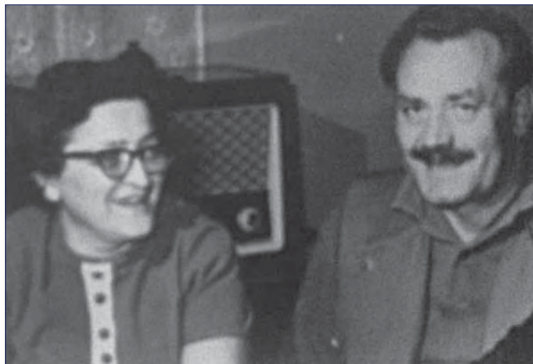
Spoločná fotografia manželov Novákovcov.

a postupne plnila aj úlohy, ktoré súviseli najmä s doručovaním dôležitých zásielok a informácií pre ilegálnych pracovníkov a príslušníkov 2. čs. paradesantnej brigády. Liptovský Hrádok