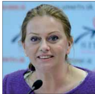
Monika FLAŠÍKOVÁ-BEŇOVÁ europoslankyňa (Smer-SD)

– Aj v súčasnosti si ekonomicky sužovaná Európa vyžaduje prijatie odvážnych opatrení, ktoré prinesú podnety pre jej ďalší rozvoj. Keď si pripomenieme tú jednotu, ktorú sme mali vo vážnych chvíľach, tak môžeme ďaleko lepšie čeliť aj tomu, čo tu zažívame dnes – to znamená obrovskú krízu, ktorá v rámci Európy hrozí. A tam má zmysel byť znova jednotní tak, aby Slovensko mohlo kráčať smerom vpred.