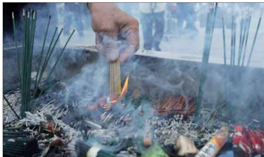
Muž zapaluje sviečku pri Dóme atómovej bomby v hirošimskom Parku mieru počas spomienkovej ceremónie pri príležitosti 68. výročia zhodenia atómovej bomby na Hirošimu 6. augusta 2013.

Dátum 6. august sa stal Svetovým dňom boja za zákaz jadrových zbraní – známy je aj pod názvom Deň Hirošimy. V ten deň v roku 1945 americké letectvo zhodilo jadrovú bombu na japonské mesto Hirošima. O tri dni neskôr, 9. augusta 1945, letectvo USA bombardovalo jadrovou náložou aj mesto Nagasaki. Ten dátum si svet pripomína ako Deň Nagasaki.