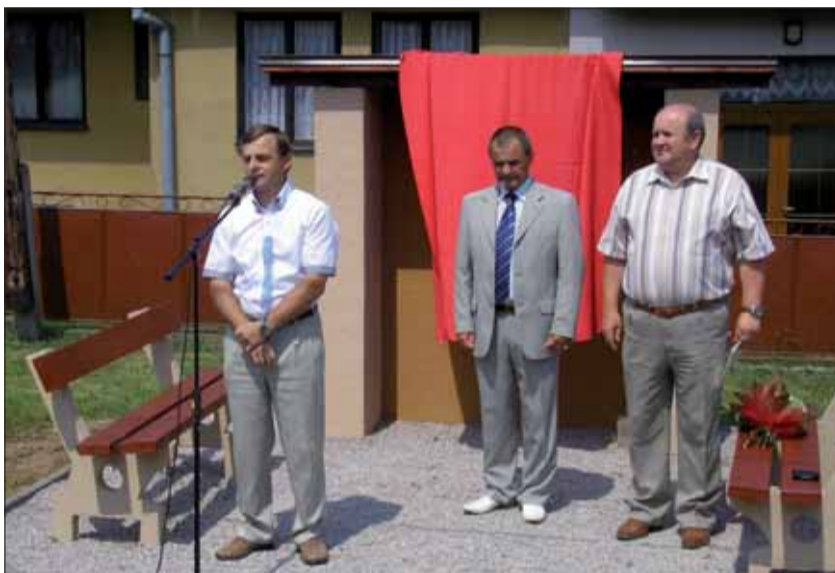
Tesne pred odhalením pamätníka v Šambrone.