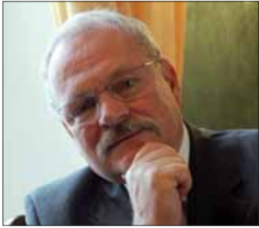
Ivan GAŠPAROVIČ prezident SR

■ Prečo si jeho odkaz treba pripomínať aj v súčasnosti?