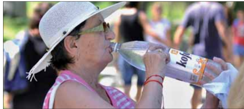
Príjem tekutín treba zvýšiť aj počas teplých dní, v opačnom prípade môže dôjsť k zníženiu tlaku krvi a ku kolapsu.

krátkodobá pamäť. Fyzické príznaky, ktoré svedčia o miernej dehydratácii, sú sucho v ústach a na jazyku, suchá pokožka, zvýšená frekvencia tepu.