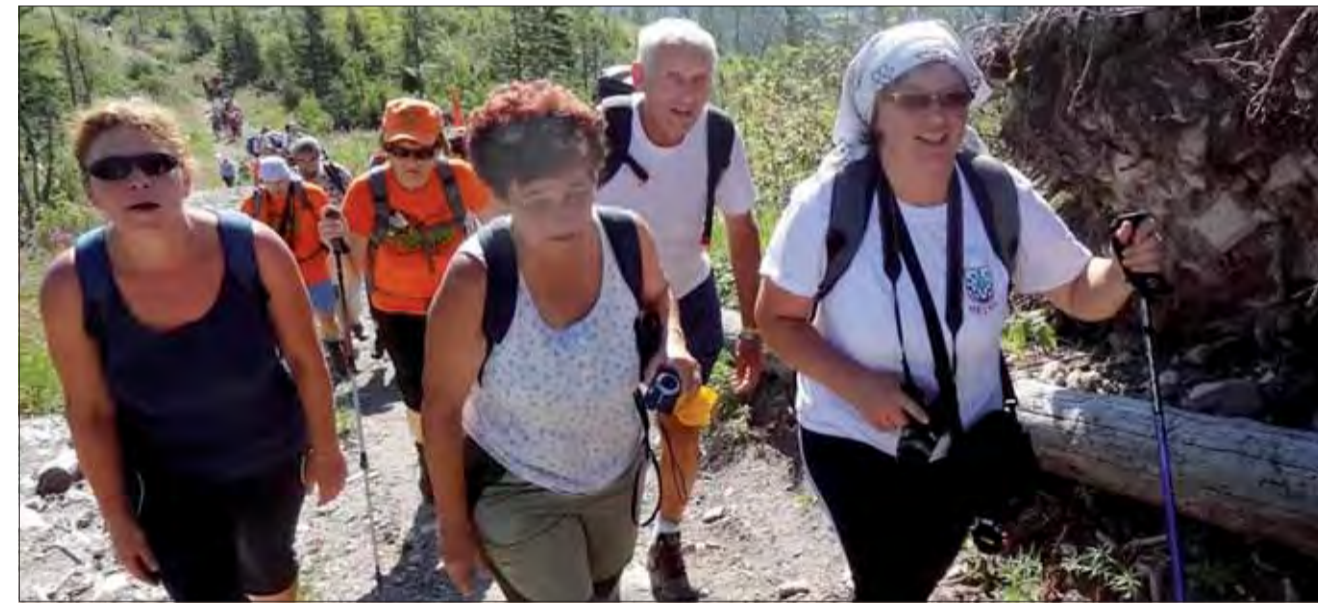
Výstup na Veľký bok dal niektorým poriadne zabrat'.