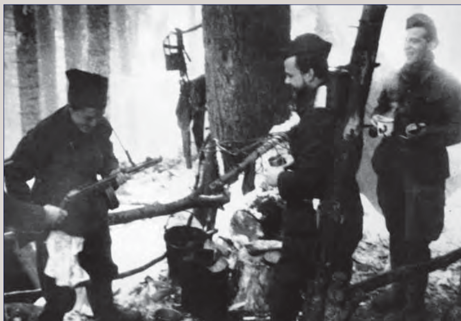
Spomienky na vojnové udalosti zostávajú v pamäti všetkých veteránov.