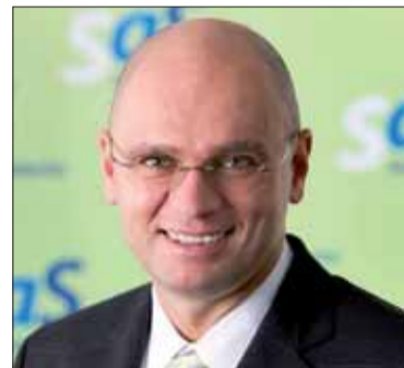
Richard SULÍK predseda SaS

– Pre hrdinstvo Slovákov a Sloveniek, z ktorých mnoho položilo pre našu budúcnosť to najcennejšie, svoje životy, a táto ich najvyššia obeta si zasluhuje nielen úctu, ale aj pripomínanie, že tu bol národ, ktorý nám otvoril dlhú cestu do budúceho spoločenstva hrdých národov Európy. A taktiež preto, že aj dnes sú stále aktívne skupiny vyznávajúce myšlienky fašizmu či nacizmu, ktorým je treba jednoznačne odpovedať: NIE, pretože to by bola cesta k intolrancii a nenávisti, keď stál človek proti človeku, keď zlyhávalo svedomie, krivili sa charaktéry a likvidovali sa všeludské hodnoty.