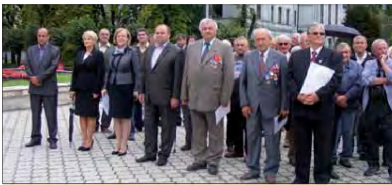
Pri pamätníku osloboditeľov v Revúcej.