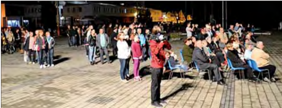
Záujem obyvateľov je nefalšovaný.