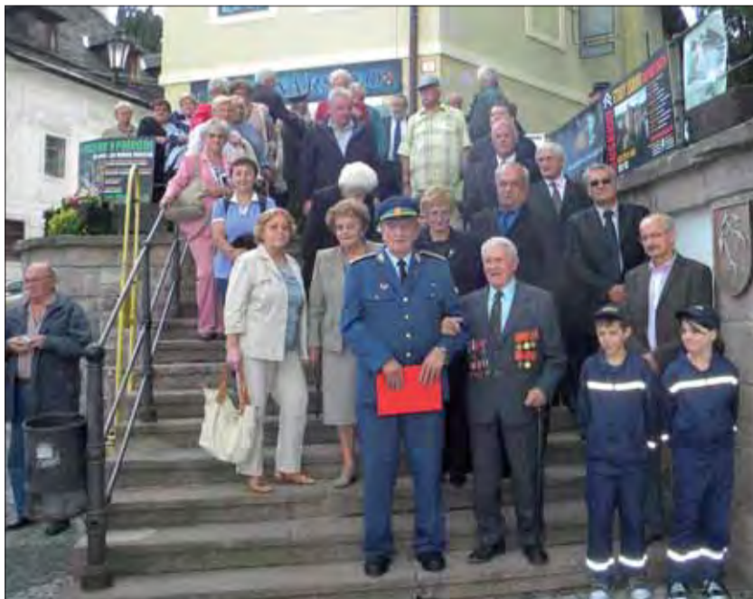
Štiavničania spomínali aj na oddiel Sitno.