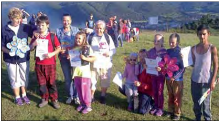
Stretnutie pri Skalke.