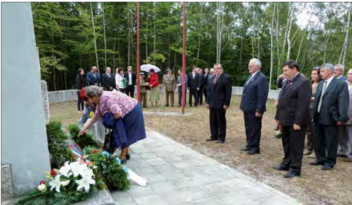
Oslavy SNP v Bardejove.