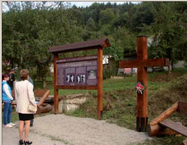
V Mladoni nezabúdajú na hrôzy vojny.