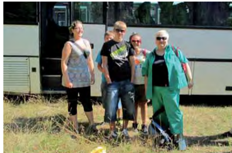
Žiaci ZŠ s MŠ Cinobaňa.