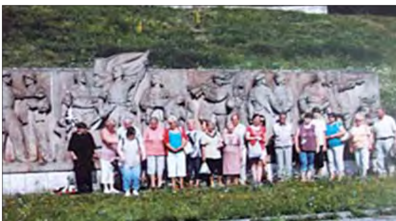
V Zemianskych Kostolanoch nezabúdajú na SNP.