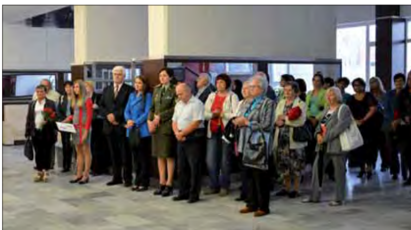
Kvôli dažďu sa oslavy SNP v Dunajskej Stredě konali v priestoroch mestského kultúrneho strediska.