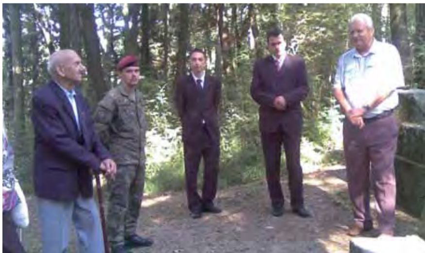
Obľv SZPB každoročne pri pamätníku zavraždených vzdáva úctu všetkým zavraždeným antifašistom.