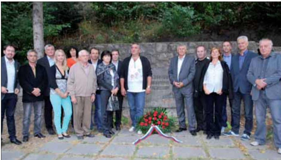
Na SNP spomínali aj v Košiciach.