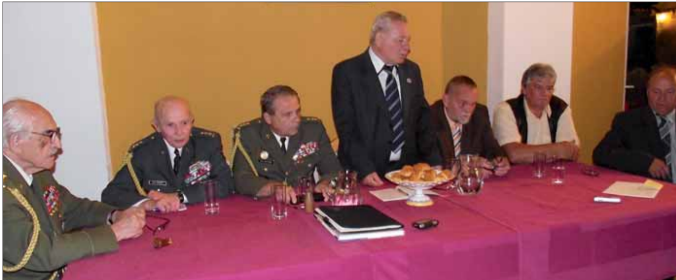
Predsedníctva SZPB a ČSBS rokovali v Bratislave a v Limbachu.