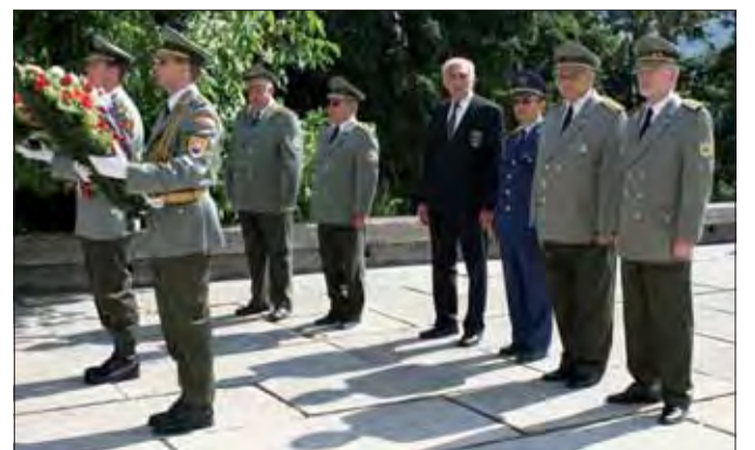
Na oslavách SNP v Banskej Bystrici.