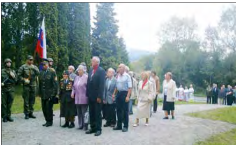
Oslavy SNP v Martine.