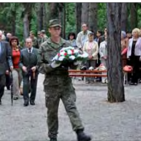
69. výročia SNP sa zúčastnili aj priami boja spoločne s členmi SZPB.