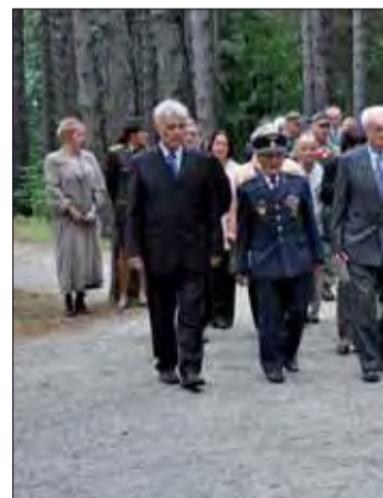
Pietneho aktu pri príležitosti účastníci protifašistického odboja