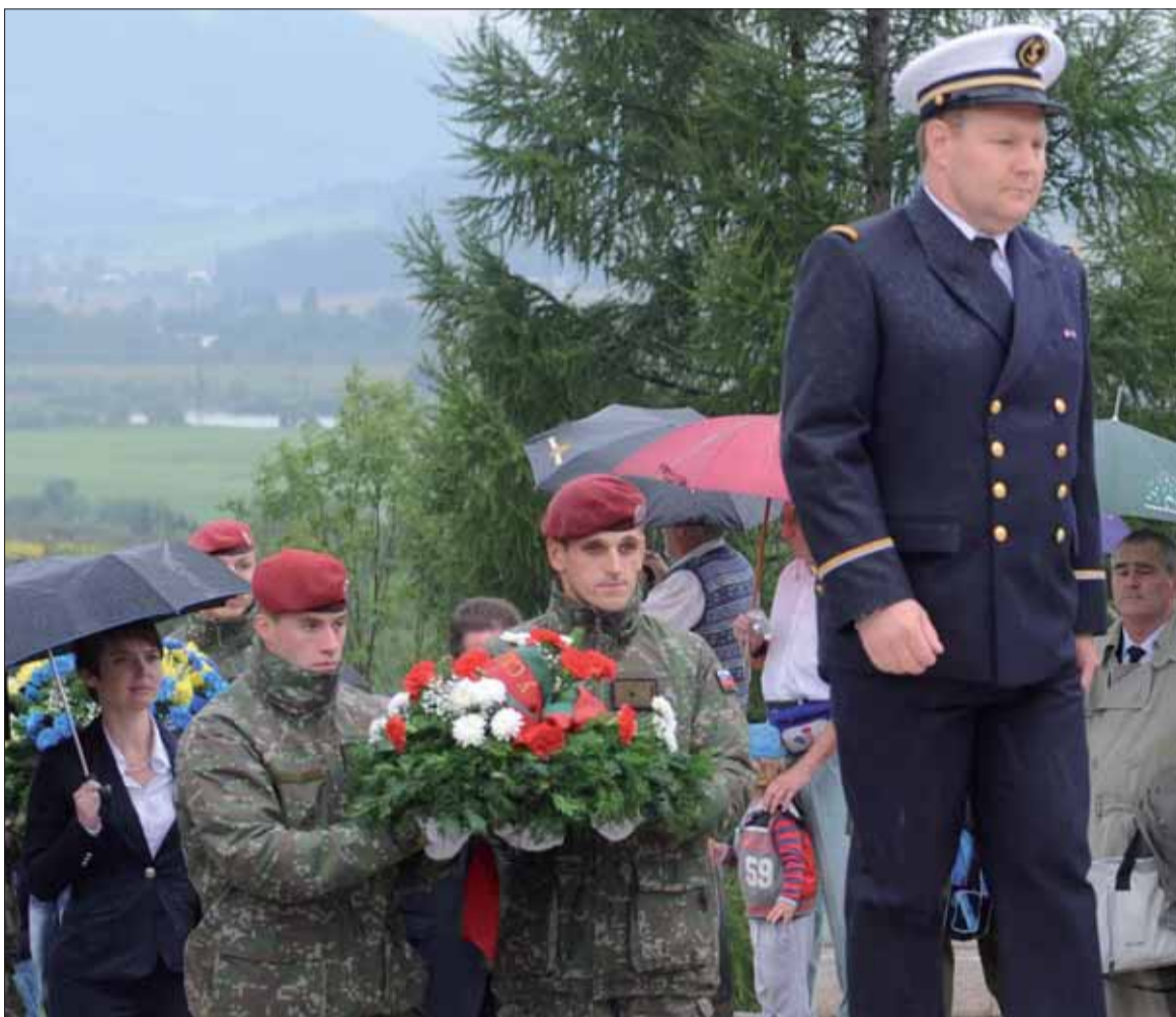
Oslavy SNP v Strečne.