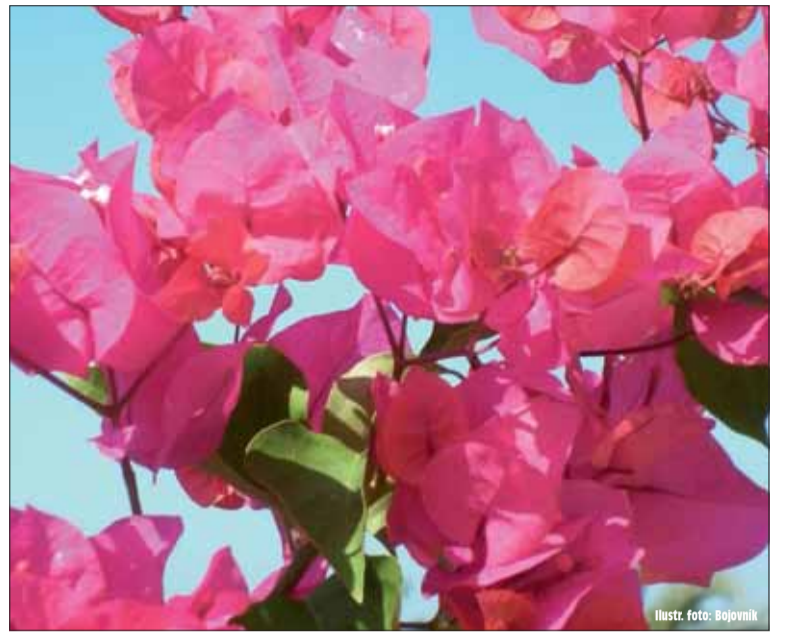
Ilustr. foto: Bojovník