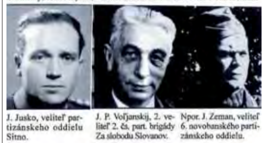
Partizáni spomínaní v článku.