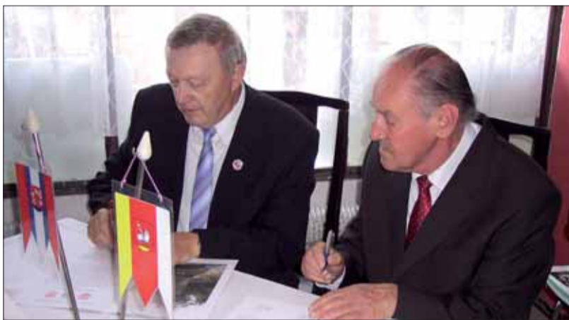
Podpis dohody o vzájomnej spolupráci medzi ZO SZPB Pohorelá a Liptovská Teplička.