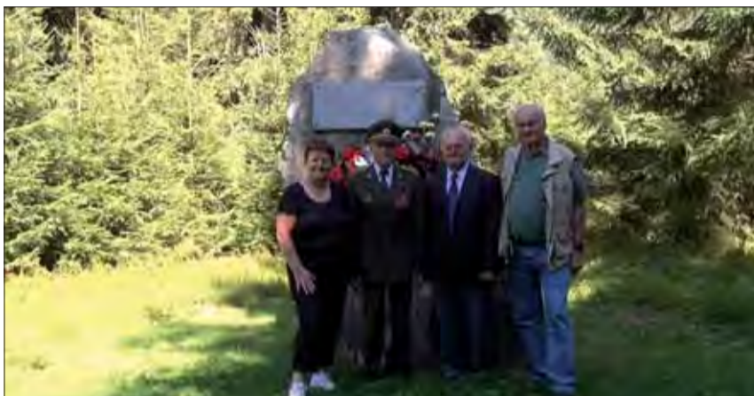
Po osadení novej tabule na Lúčkach.