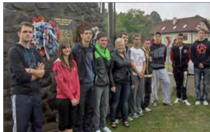
Súťažiaci si preverili aj vedomosti z obdobia druhej svetovej vojny.

a zorganizoval OblV SZPB v Humennom. Organizačný štáb pripravil v spolupráci s HDK pri OblV vydanie lektorských listov obsahujúcich tézy pre súťaž – stručný prehľad o novodobých dejinách Slovenska zahŕňajúci obdobie 1. svetovej vojny, udalosti súvisiace s mníchovským diktátom z 29. 9. 1938, SNP