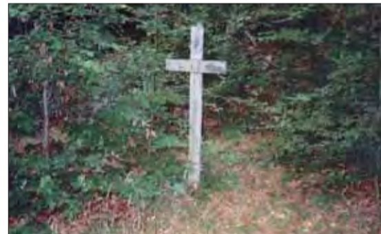
Hrob J. Pol'ského.