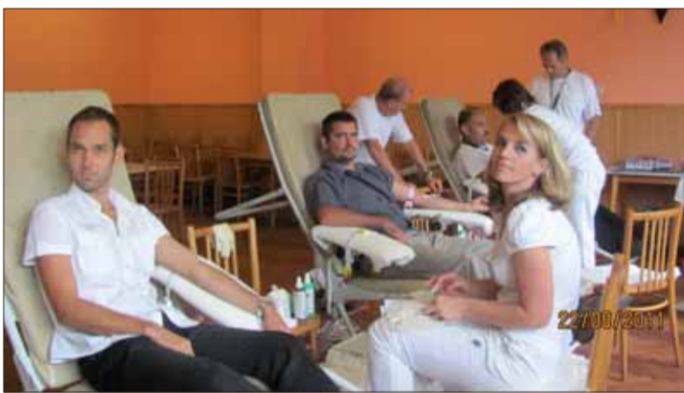
Už siedmykrát sa konala vo Svidníku Duklianska kvapka krvi.