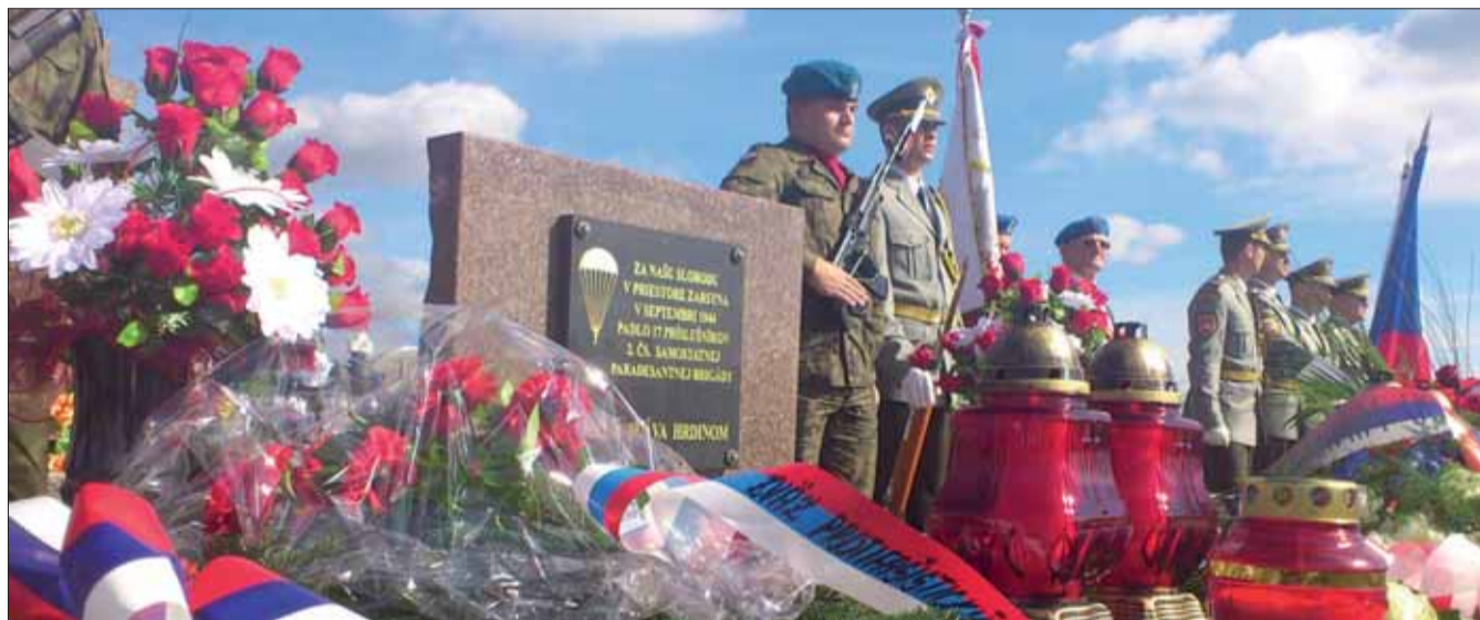
Oslavy 68. výročia Karpatsko-duklianskej operácie.