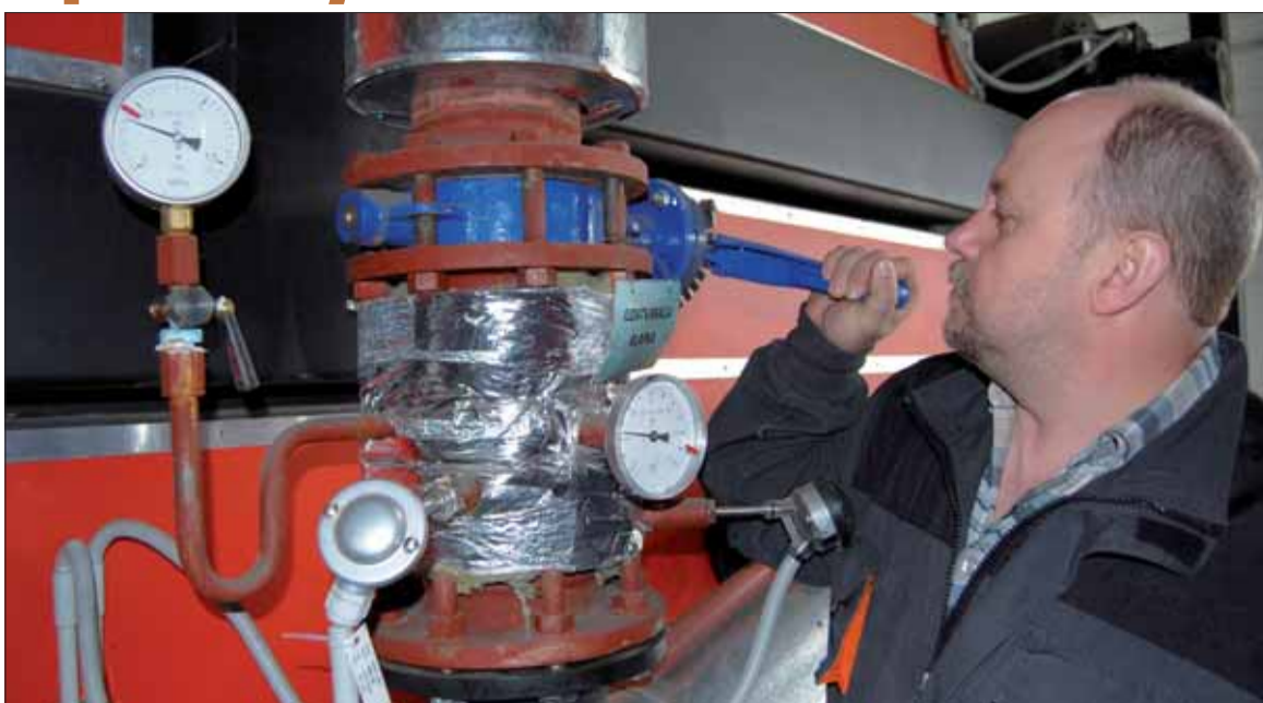
Pred začiatkom vykurovacej sezóny by mal urobiť servisnú prehliadku vykurovacích telies odborník.

„Zanesenie sa môže prejavovať častým zhasínaním horáka alebo prehrievaním kotla. V mnohých prípadoch to vedie až k začerneniu stien pri komínových vý-