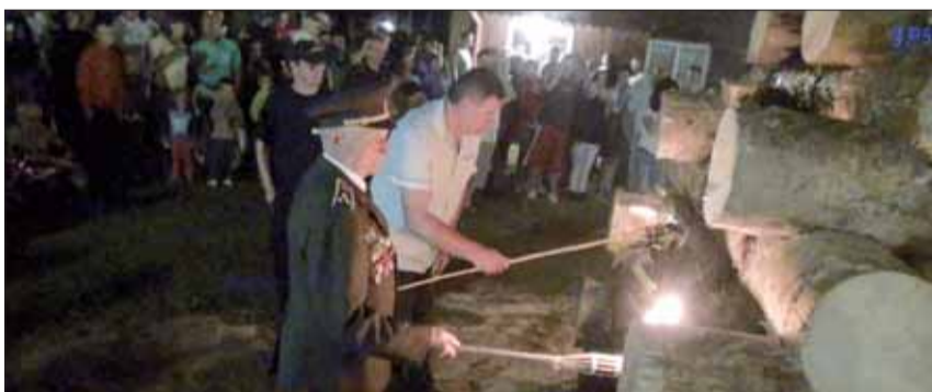
Zapaľovanie vetry v Podturni.