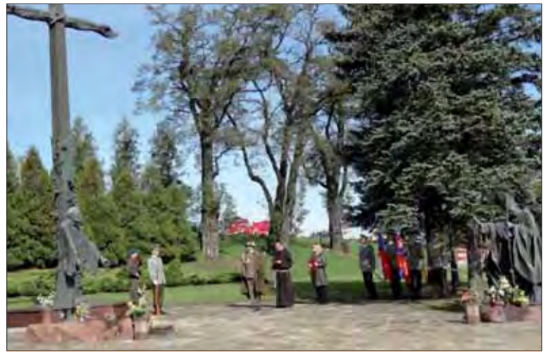
Pietny akt pri Krži zmlievania.

Karpatsko-duklianska operácia patrí medzi najvýznamnejšie historicko-vojenské udalosti československých dejín počas druhej svetovej vojny pri oslobodzovaní národných štátov. Zúčastnili sa jej vojská 1. a 4. ukrajinského frontu Červenej armády, jednotky 1. Československého armádneho zboru v ZSSR pod vedením armádneho generála Ludvíka Svobodu. Vojaci Červenej armády a 1. čl. armádneho zboru sa ponáhľali na pomoc povstalcov. Duklianska operácia znamenala