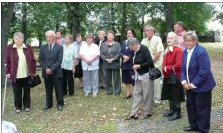
Pietna spomienka v Dúbrave.