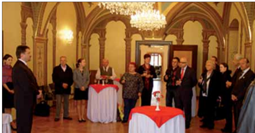
Otvorenie výstavy v Banskej Bystrici.

Po ukončení výstavy, ktorá potrvá do 8. novembra, budú vystavené dokumenty doplnené a trvalo umiestnené v Múzeu slovincov na hrade Rajhenburg u Brestanici. Juraj DROTÁR