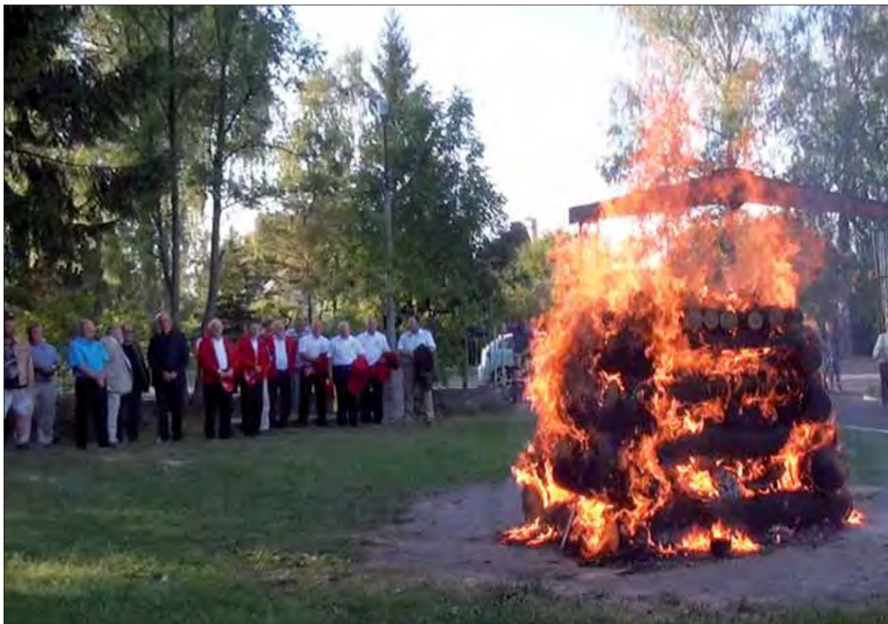
Povstalecká vatra v Liptovskom Jáne.