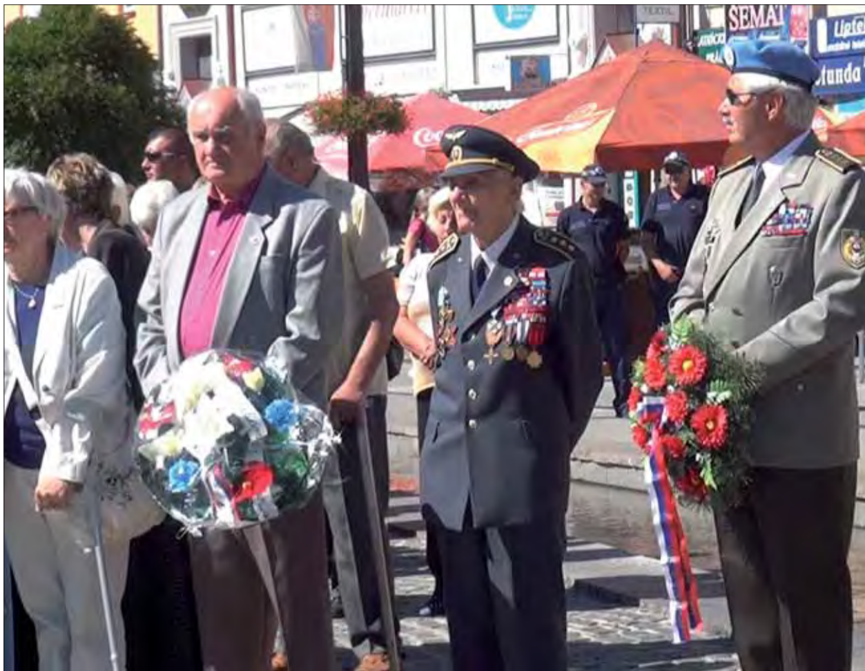
Oslavy SNP v Liptovskom Mikuláši.

v Dúbrave zaspieval slovenskú hymnu a po položení venca k pamätníku obetí vojny predniesla báseň žiačka ZŠ v Dúbrave. Po príhovore tajomníka OblV SZPB a zástupkyne starostu spevokol žien v krátkom kultúrnom programe zaspieval piesne k ucteniu SNP. V obidvoch obciach boli účastníkmi spomienkových osláv väčšinou členovia ZO v obci a po skončení im prichystali občerstvenie na obecných úradoch.