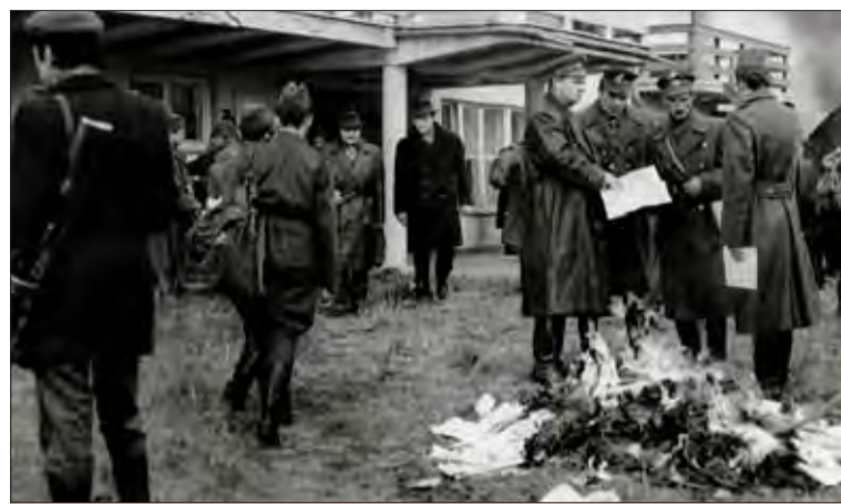
Donovaly. Pred ústupom do hôr