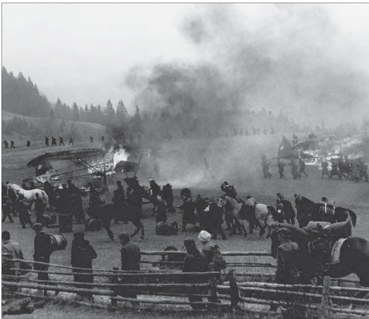
Ústup povstalcov do hôr

Odpoveď bola stručná a jasná. Slovné hodnotenie nie je známe. Projektu boli odborníkmi odbornej komisie pridelené body. Celkom