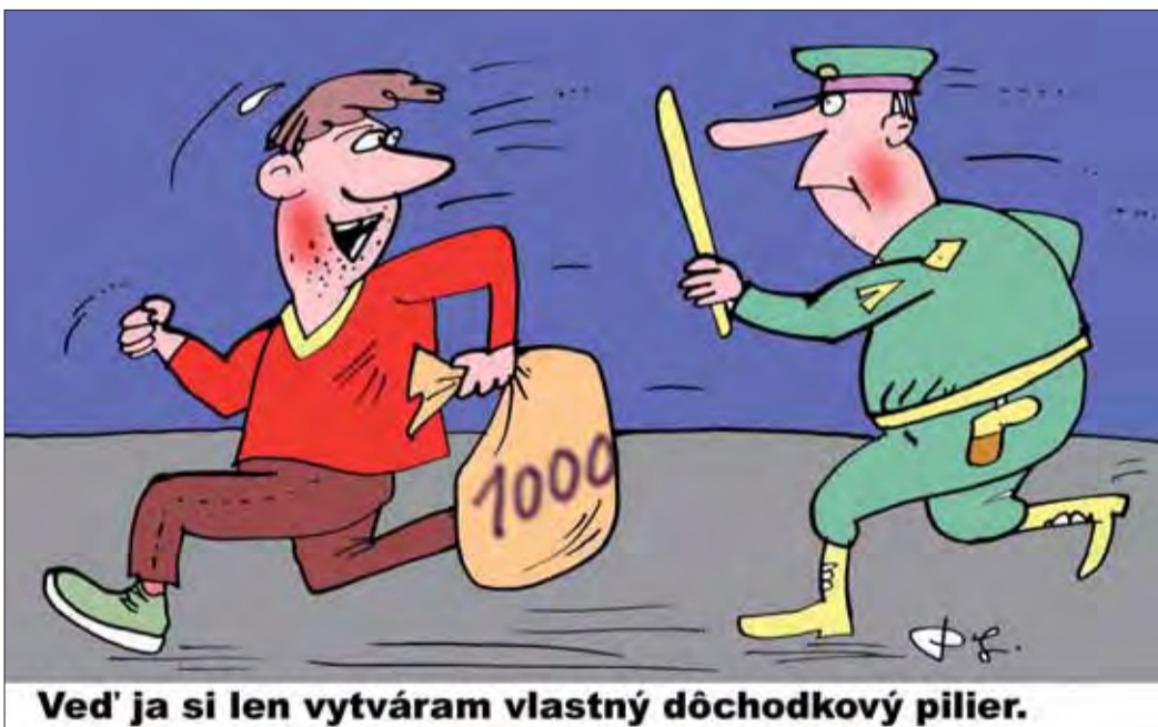
Ved' ja si len vytváram vlastný dôchodkový pilier.