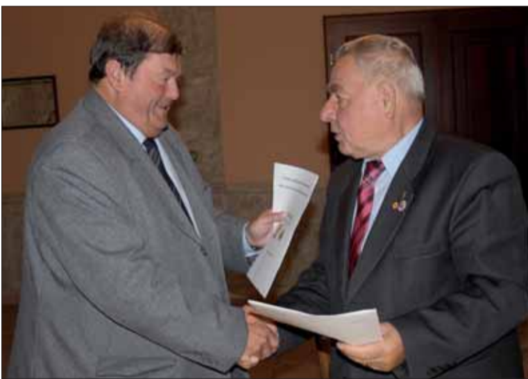
Predsedovia si gratulujú k spoločnému vyhláseniu.

Tento pamätník bol odhalený počas 68. výročia oslobodenia Buchlovíc Rumunskou armádou a osadený je pri pamätníku obetiam 1. a 2. sv. vojny.