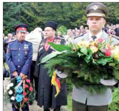
Nemecký veniec a ruskí veteráni na Dukle.