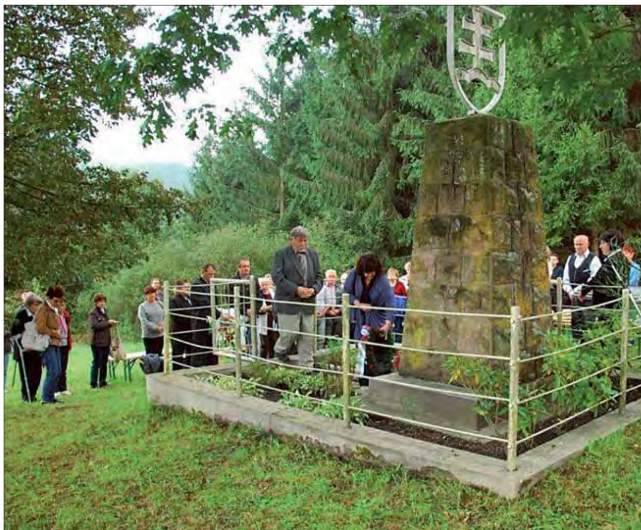
Horné Hámre, pamätník Gul'ometné hniezdo.