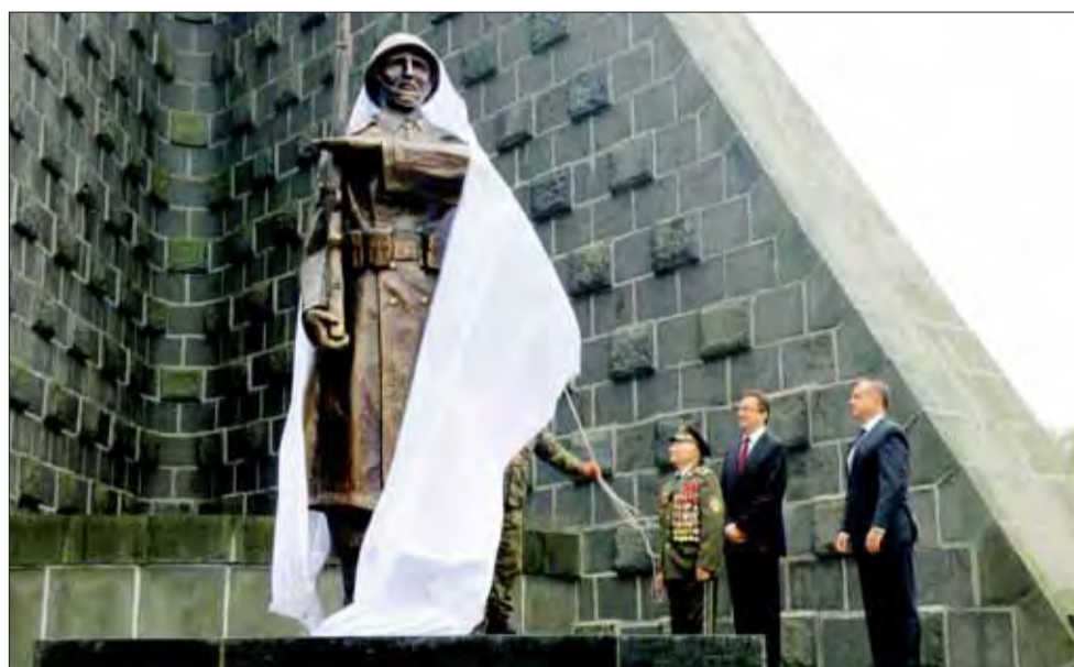
Odhaľovanie staronovej sochy v Duklianskom priesmyku.