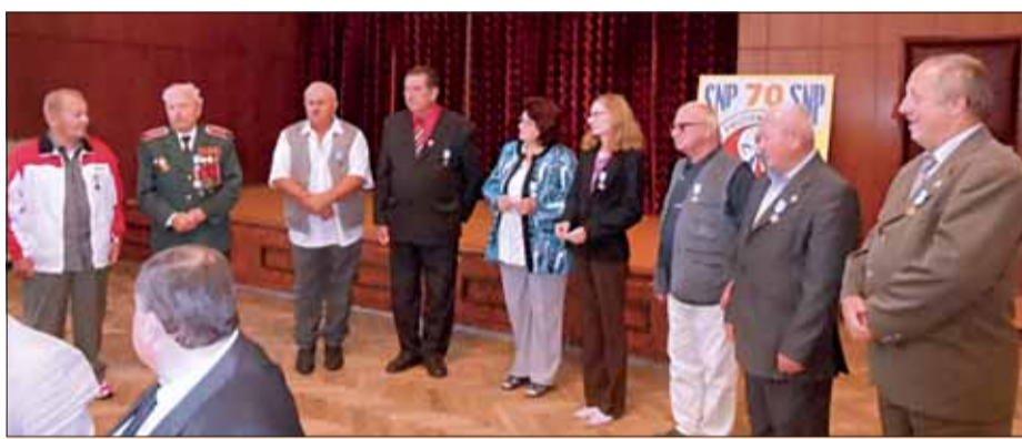
Odvzdávanie ocenení v Novosade.