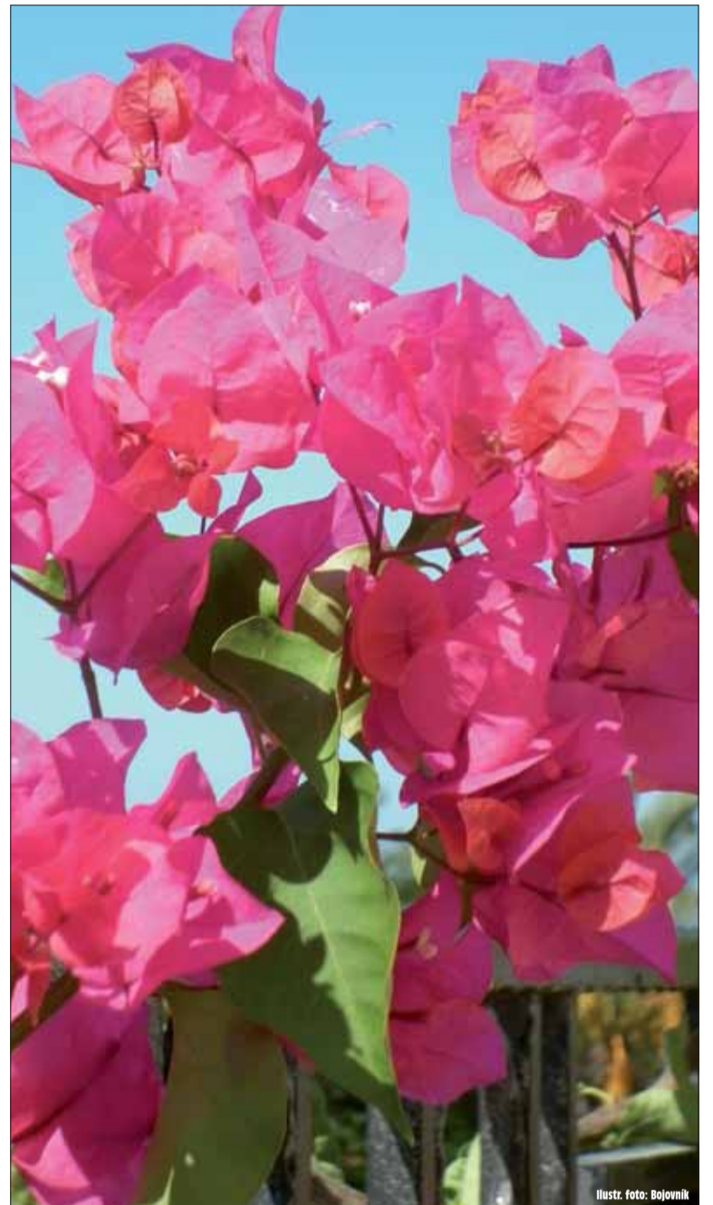
Ilustr. foto: Bojovník