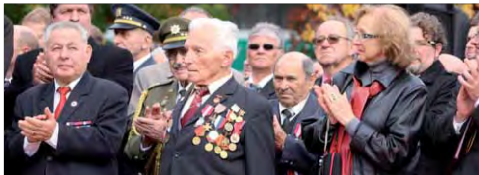
Členovia ÚR SZPB spoločne so slovenskými a českými veteránmi.