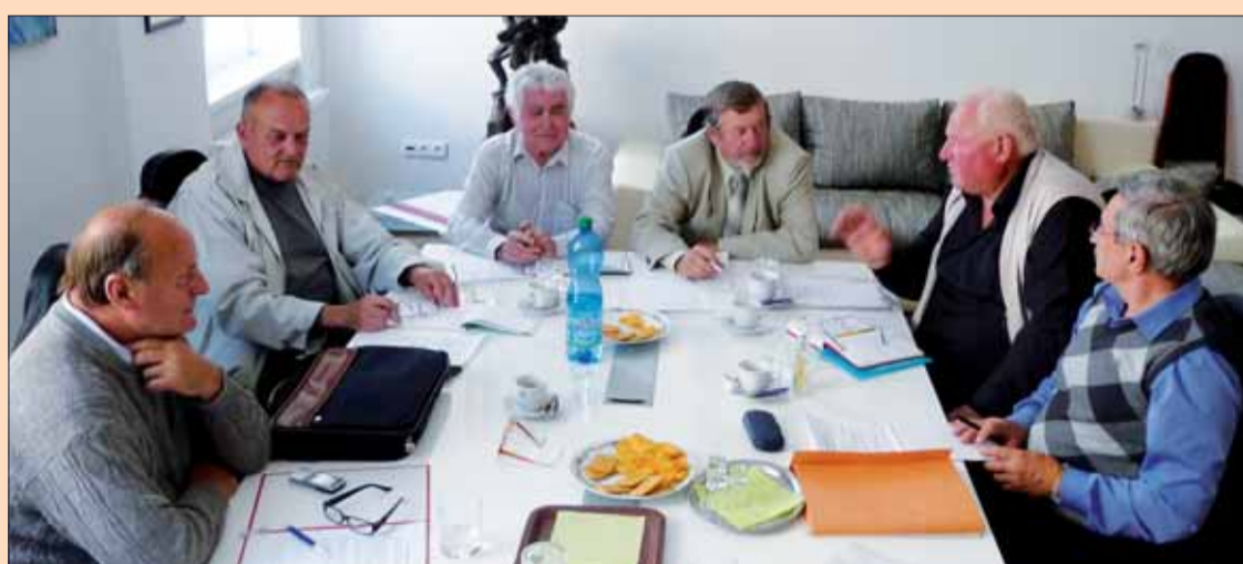
Dňa 30. septembra sa zišla novozvolená redakčná rada ročníkov odbojárov, dvojtýždenníka Bojovník a webovej stránky SZPB, ktorá si zo svojho streda za predsedu zvolila

Dejiskom poslednej rozlúčky s Jozefom Nálepkom bola 15. októbra obec Smežany v okrese Spišská Nová Ves.