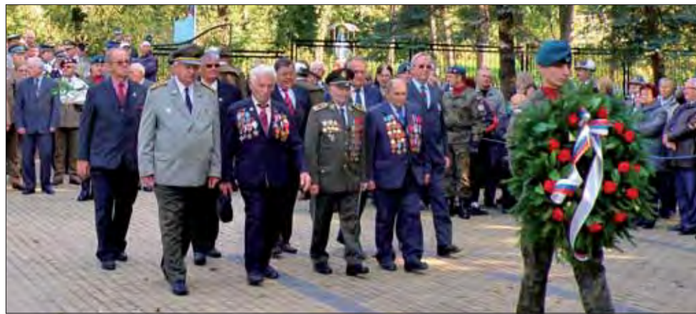
Delegácia SZPB kladie veniec k pomníku 2. čs. paradesantnej brigády v Nowosielciach.