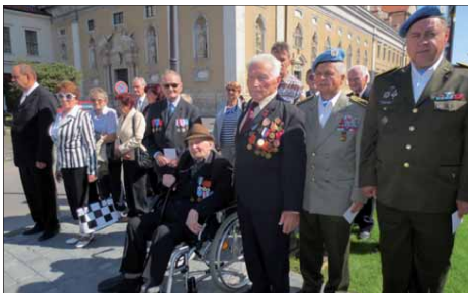
Trnavskí protifašisti počas výročia SNP.