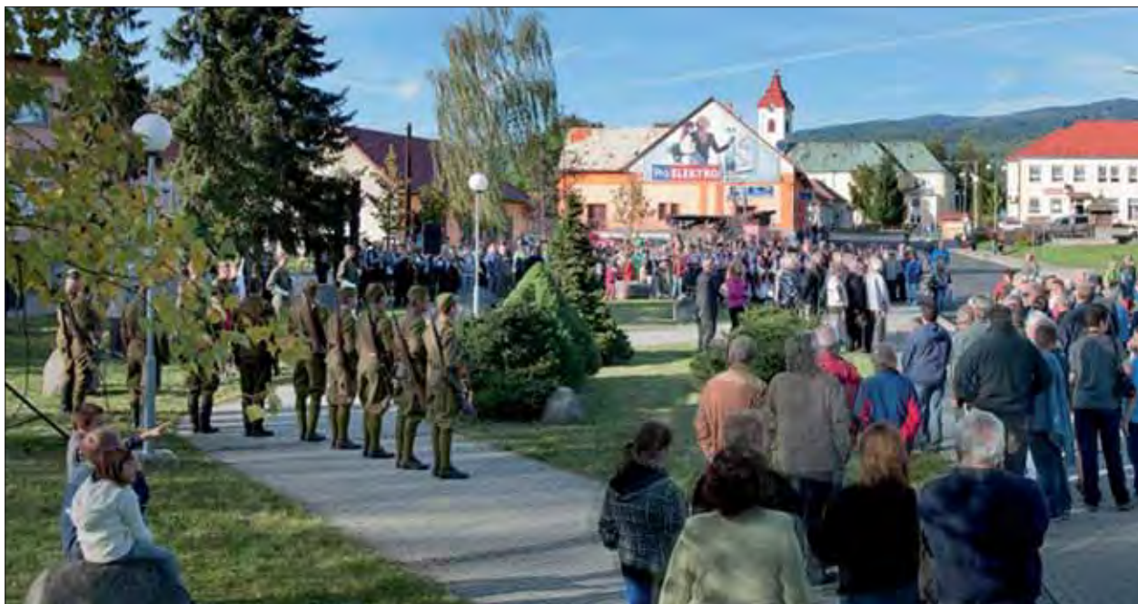
Účastníci Partizánskej prehliadky v Detve pri pietnom akte.