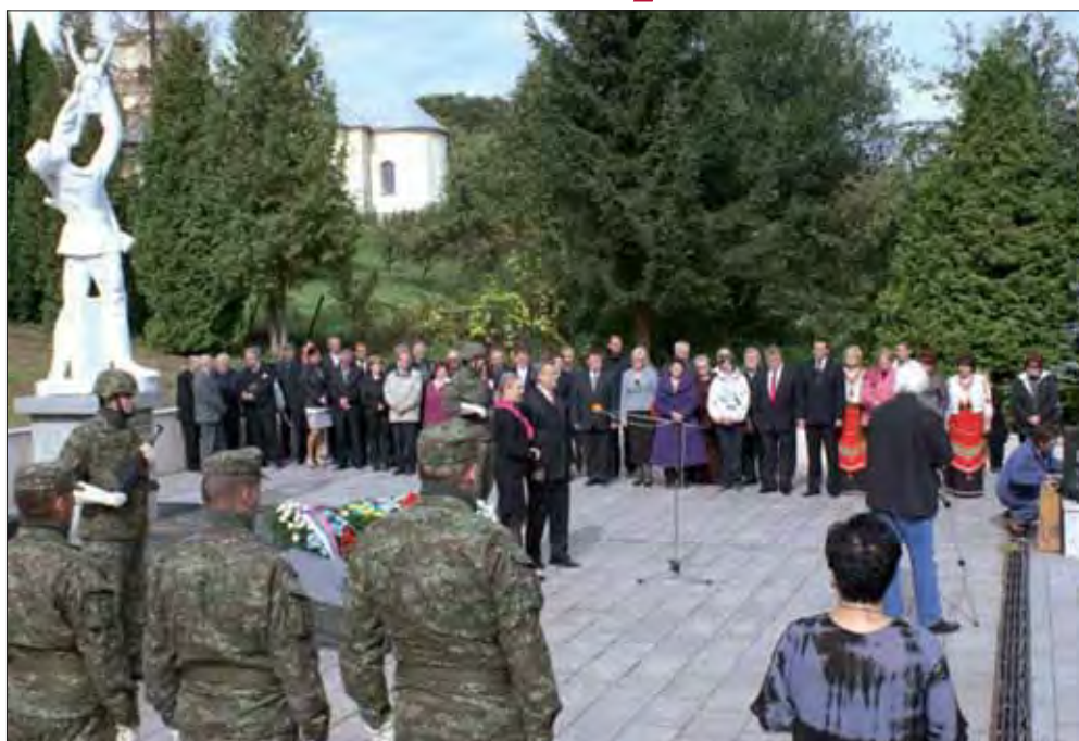
Pietna spomienka oslobodenia Kalinova.