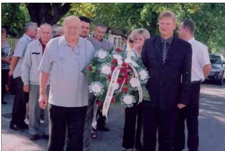
Oslavy SNP v Tomášovciach.