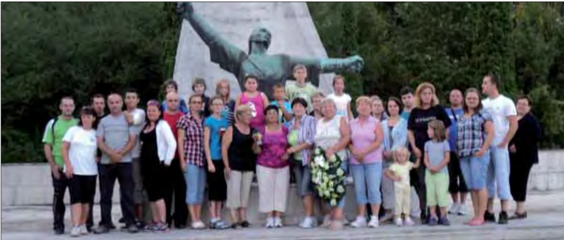
Členovia a sympatizanti ZO SZPB v Heľpe počas výletu.