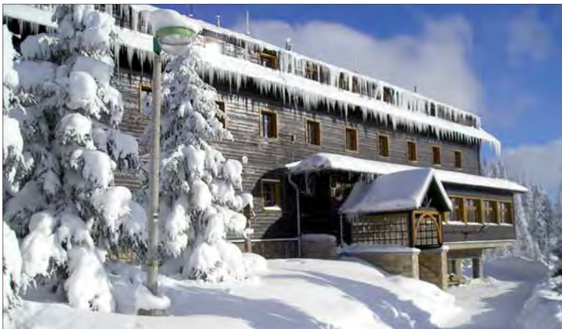
Pohľad na hotel v zime.

V detskom kútiku, ktorý je situovaný v blízkosti recepcie, majú deti k dispozícii hračky, knižky, hry a, samozrejme, televíziu, kde si môžu pozrieť svoje obľúbené roz-