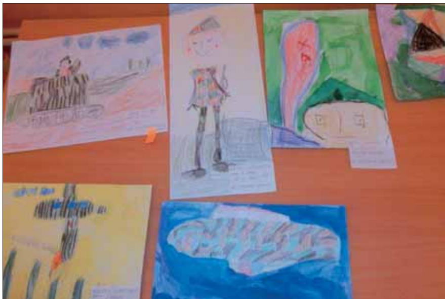
Pohľad na výtvarné práce detí.