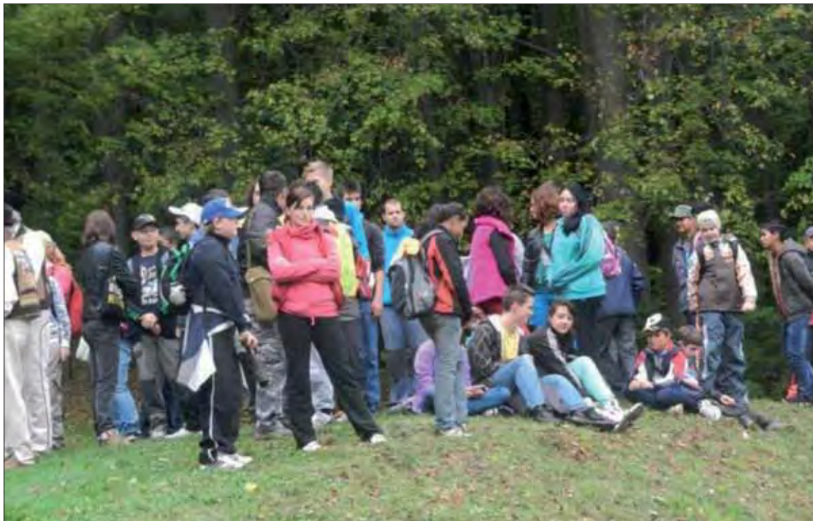
Mládež v Gemerskej Polomke sa zaujíma o udalosti druhej svetovej vojny.