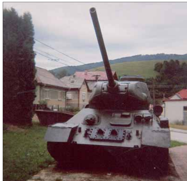
Oslobodzovacie boje o Klenovec a povstalecké tradície pripomína legendárny sovietsky tank.

Návštevu Klenovca som si dobre načasoval – 10. augusta, v deň narodenín Vladimíra Mináča. Stojím pred rodným domom bratov Mináčovcov. Nuž teda nedožité deväťdesiate narodeniny slovenského barda, ktorý po druhej svetovej vojne tvoril jadro formujúcej sa takzvanej povstaleckej generácie. Baťko Mináč, ako sme ho nie tak dávno volali. Novinár, publicista, esejista, kultúrny činiteľ, prozaik, funkcionár, spoločensky angažovaný človek. Prešiel povstaleckými bojmi, nemeckými zajateckými tábormi, a táto jeho životná skúsenosť sa premietla do značnej časti jeho tvorby. Autor