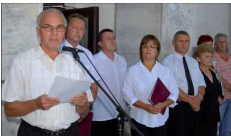
Oslavy SNP v Poltári.