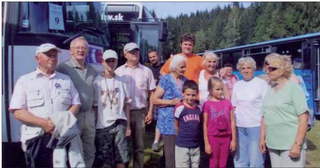
Bojničania na Kališti.

častnili na stretnutí generácii v Kališti, na Jankovom Vŕšku, v Banskej Bystrici