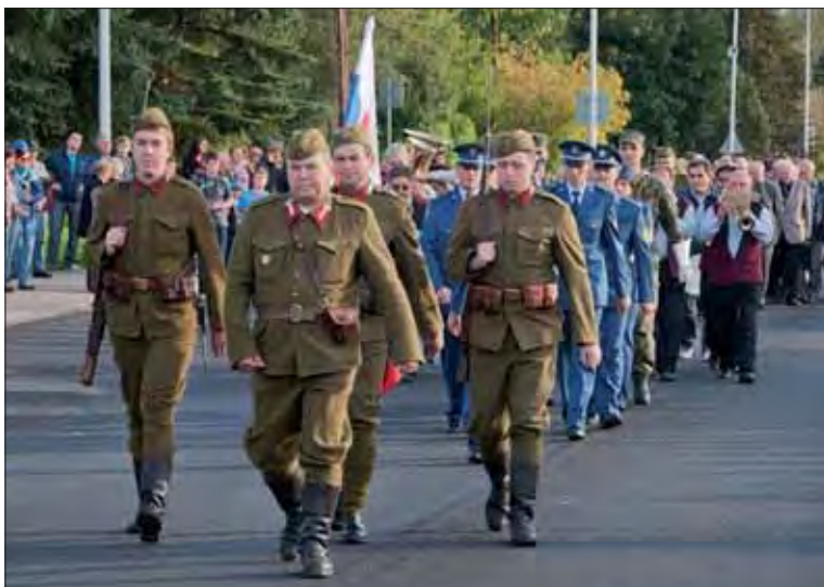
Sprievod po Partizánskej ulici.