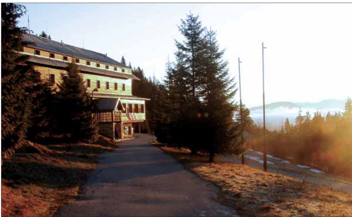
Príroda okolo hotela má čo ponúknuť v každom ročnom období.

V zimnej sezóne je lyžiárom k dispozícii lyžiarsky vlek priamo pri hoteli s celkovou dĺžkou zjazdovky 400 m. Výborné podmienky na lyžovanie sú pre rodiny s malými deťmi. K dispozícii sú bežkárske trate, prírodné klzisko či skialpinizmus.