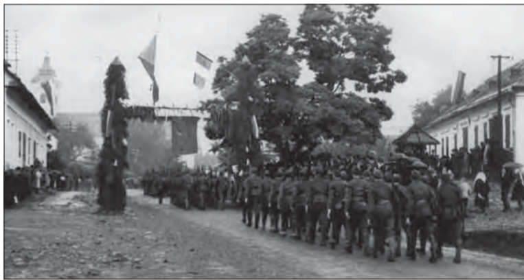
Spomienkové stretnutie 1. 10. 1944.