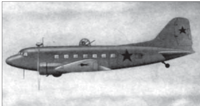
Lietadlo dopadlo na pole medzi Hranovnicou a Spišským Štiavnikom. Po dopade na zem lietadlo vybuchlo a začalo horieť.