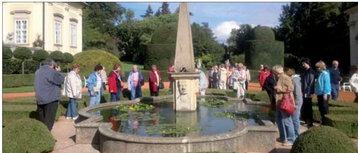
Žiarčania spoznávali moravsko-slovenské končiny.