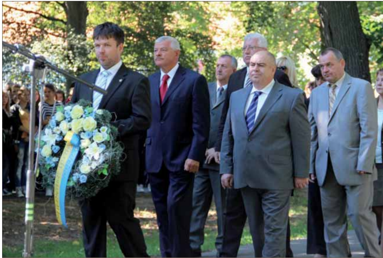
V Seredi si pripomenuli Deň obetí holokaustu.