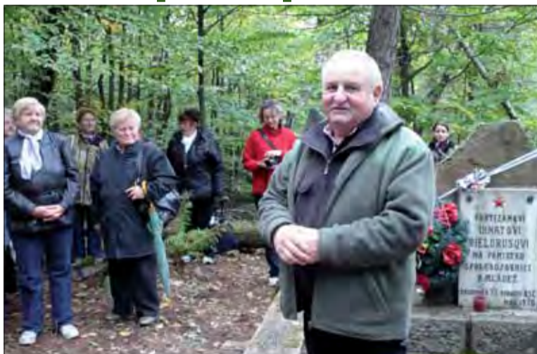
Humenský a sninský odbojaári sa vybrali po stopách partizánov.