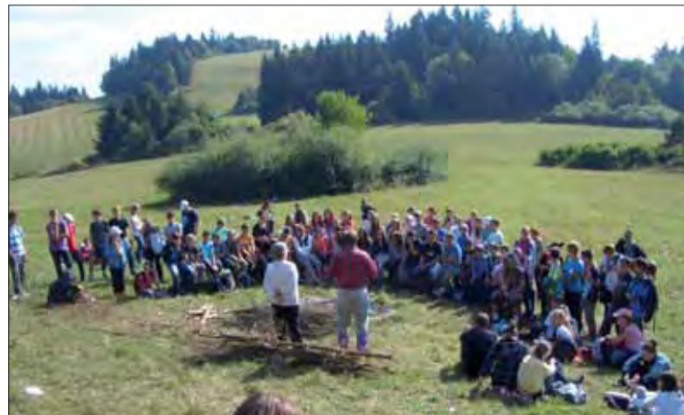
Žiakov prednáška o vojne zaujala.