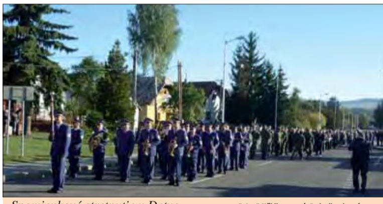
Spomienkové stretnutie v Detve.