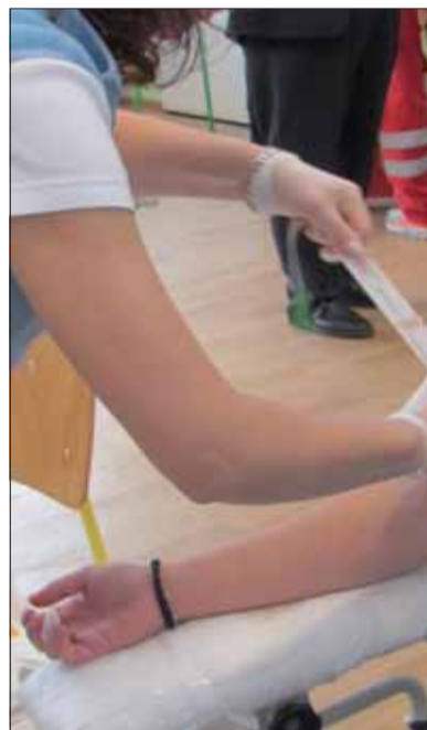
Na Duklianskej kvapke krvi darov