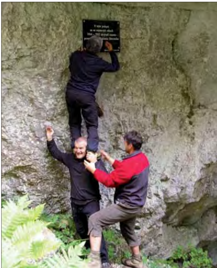
Tak pripínali pamätný veniec v Liptovskom Trnenci.