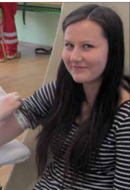
alo krv 17 darcov.