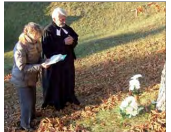
Pri symbolickom bratovom hrobe sa jeho sestra pomodlila.

Ivanovič Nebesnyj pogib 3. marta 1945 goda v derevni Zavažna Poruba. Na symbolickom hrobe padlého ruského vojaka pod gaštanom za kostolom sa nachádza od 8. októbra 2013 aj rodná zem. Áno, vzniklo nové miesto piety. -dm-