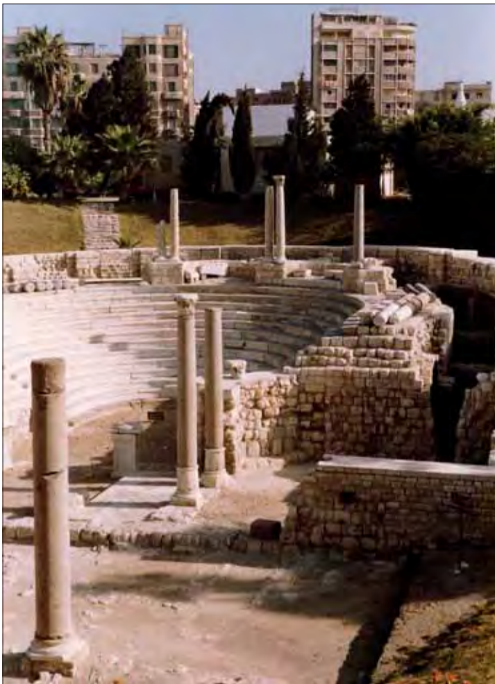
Zvyšky rímskeho amfiteátra.