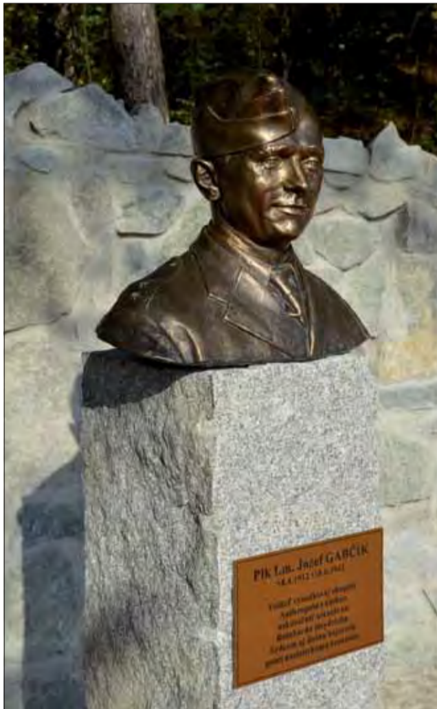
PIK Lb. Jozef GABČÍK SEAPRIZORANI Výstavba pamätníka v spolupráci s občianskymi organizáciami a dobrovoľníkmi v rámci projektu „Úcta rodákom“ v spolupráci s Mestom Rajecké Teplice