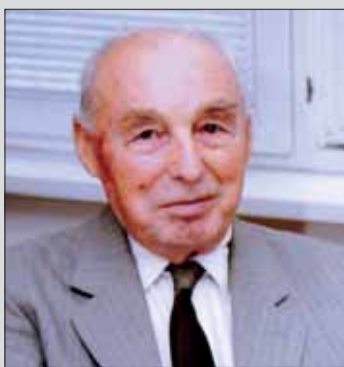
ZO SZPB č. 26 Bratislava

Desať rokov vykonával funkciu tajomníka ZO SZPB, pravidelne a aktívne sa zúčastňoval všetkých podujatí a akcií usporiadaných OblV SZPB, ktorého bol aj členom. Bol dôsledný, priateľský a zodpovedný. Naposledy sme spolu oslávili 70. výročie SNP. Bude nám veľmi chýbať. Kto ste ho poznali, venujte mu tichú spomienku.