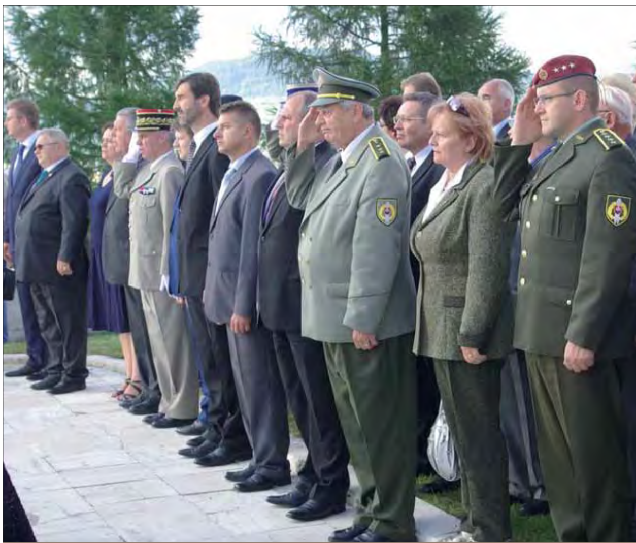
Spomienka na Zvonici.