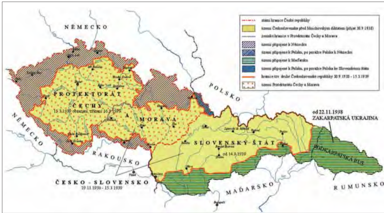
Mapa okypnenej ČSR, na ktorej je vidieť, čo si odhryzlo Poľsko, čo Nemecko a čo Maďarsko.