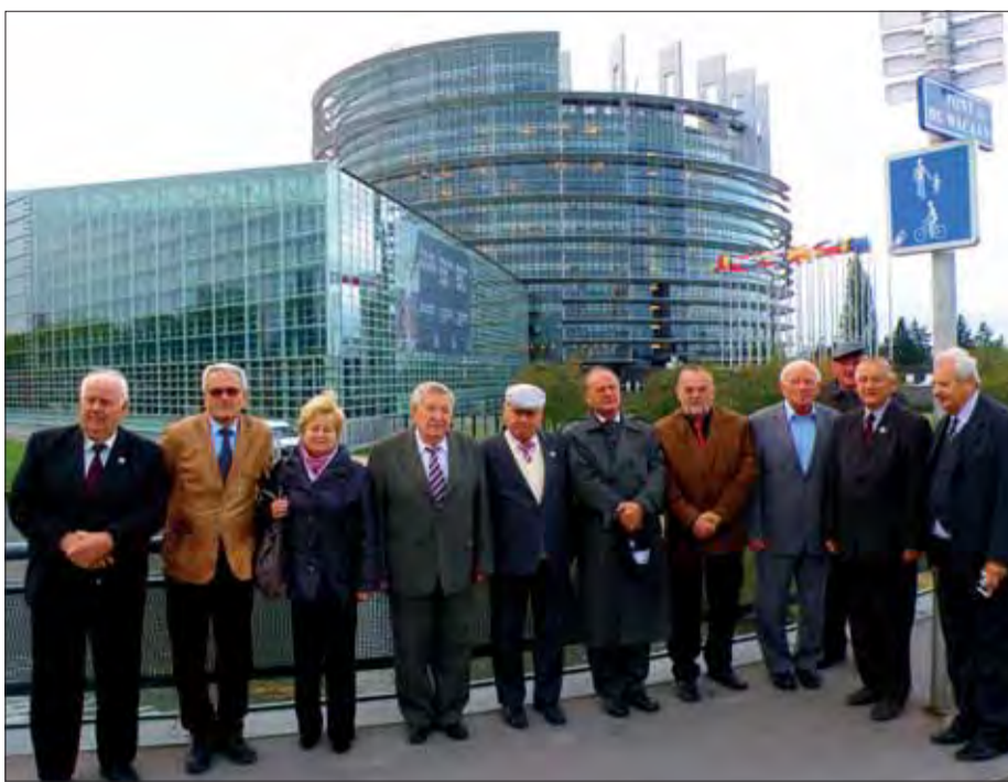
Delegácia SZPB pred sídlom Európskeho parlamentu.

Areál EP v štrasburskej Európskej štvrti postavili na križovatke rieky Ill a kanála napojeného na Rýn podľa projektu štúdia Architecture. Hlavnú časť, ktorú slávnostne otvorili v roku 1999, pomenovali podľa Louise Weisovej, dôvernej priateľky Milana Rastislava Štefánika, ktorá sa neskôr stala známou novinárkou a členkou Francúzskej akadémie. V roku 1979 ju vo veku 82 rokov zvolili za poslankyňu EP, kde na