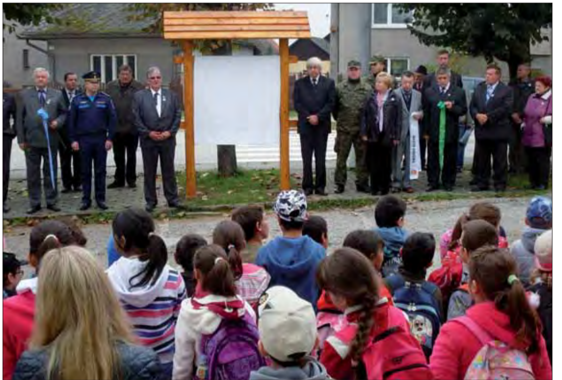
70 rokov od leteckej tragédie na Flôse.