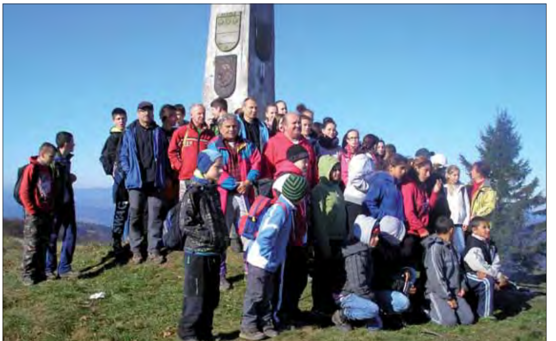
Výstup na Minčol.

Skupina v druhej p... ziónie Or... pri oplot... neznámy... zánom, k... Ich pam... položen... monumen... tifaštick... pripomín... Zveľadím