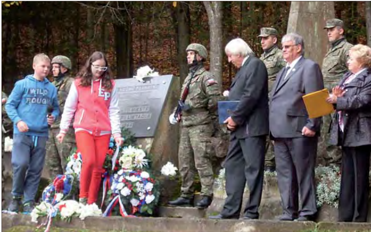
70 rokov od leteckej tragédie na Flôse.