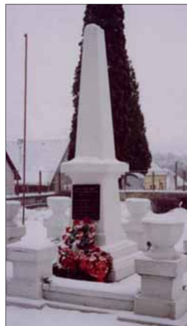
Poškodený pamätník v Cinobani.