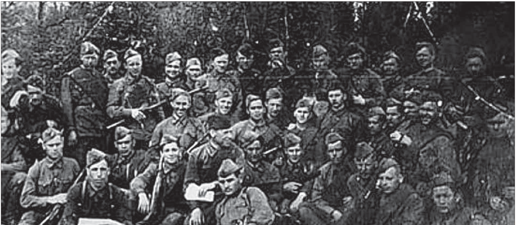
Špeciálny oddiel Víťazi moskovskej Samostatnej brigády osobitného určenia pred výsádkom na okupované teritórium.

Oddiely osobitného určenia sa vytvárali nielen v rámci pozemných vojsk, ale aj vo vojnovom námorníctve. Úspešné nasadenie malých skupín výsádkárov behom útoku blízko Odesy v septembri 1941 a v obojživelných operáciách na polostrove Kerč dalo 31. decembra 1941 leteckej sekcii Čiernomorskej flotily