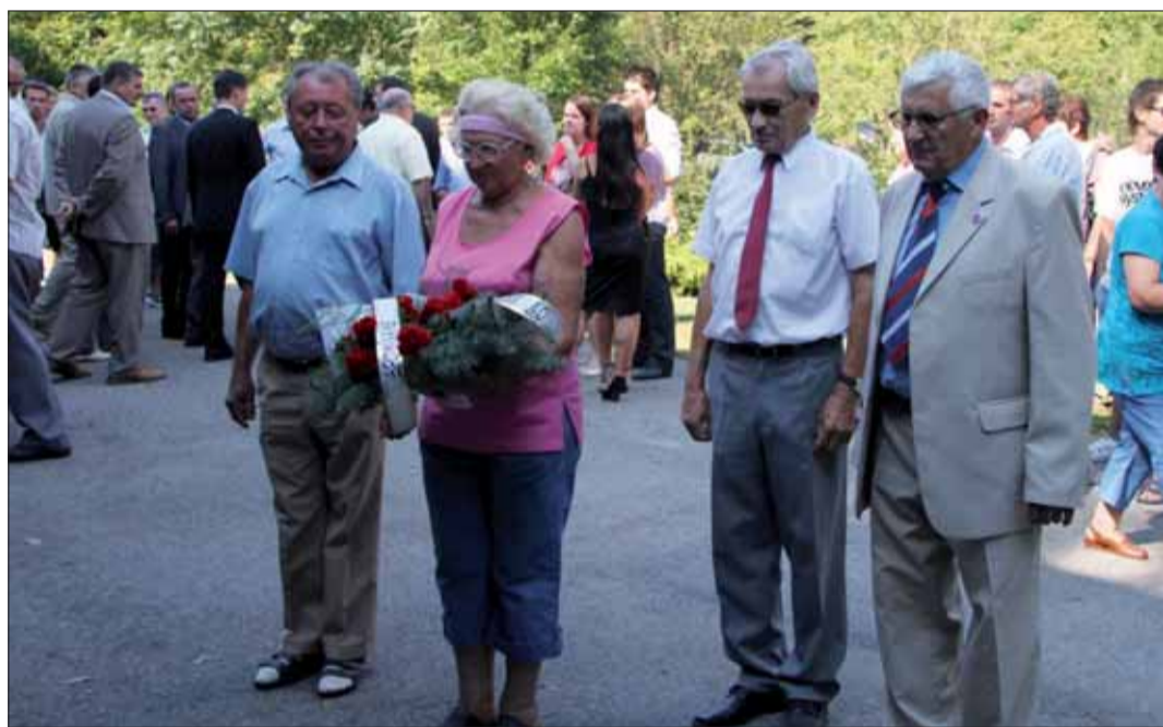
Spomienková slávnosť v katastri Devičian.