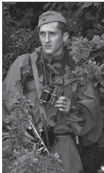
Rozvedčik prieskumno-diverzného oddielu v podaní člena KVH Čapajev.

Podobne ako armády spojencov mali svoje špeciálne jednotky v podobe praporev amerických Rangers alebo oddielov anglických Commandos, mala i Červená armáda svoje vlastné útvary osobitného určenia, ktoré nasadzovala do bojov trochu odlišným spôsobom ako u západných spojencov. Každoročne 24. októbra sa v Ruskej federácii slávi na ich počesť Deň útvarov špeciálneho určenia.