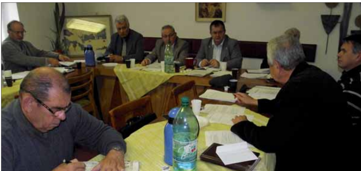
Zasadnutie Predsedníctva SZPB 26. októbra v Bratislave.

Výstava potrvá do 11. decembra. luc TASR