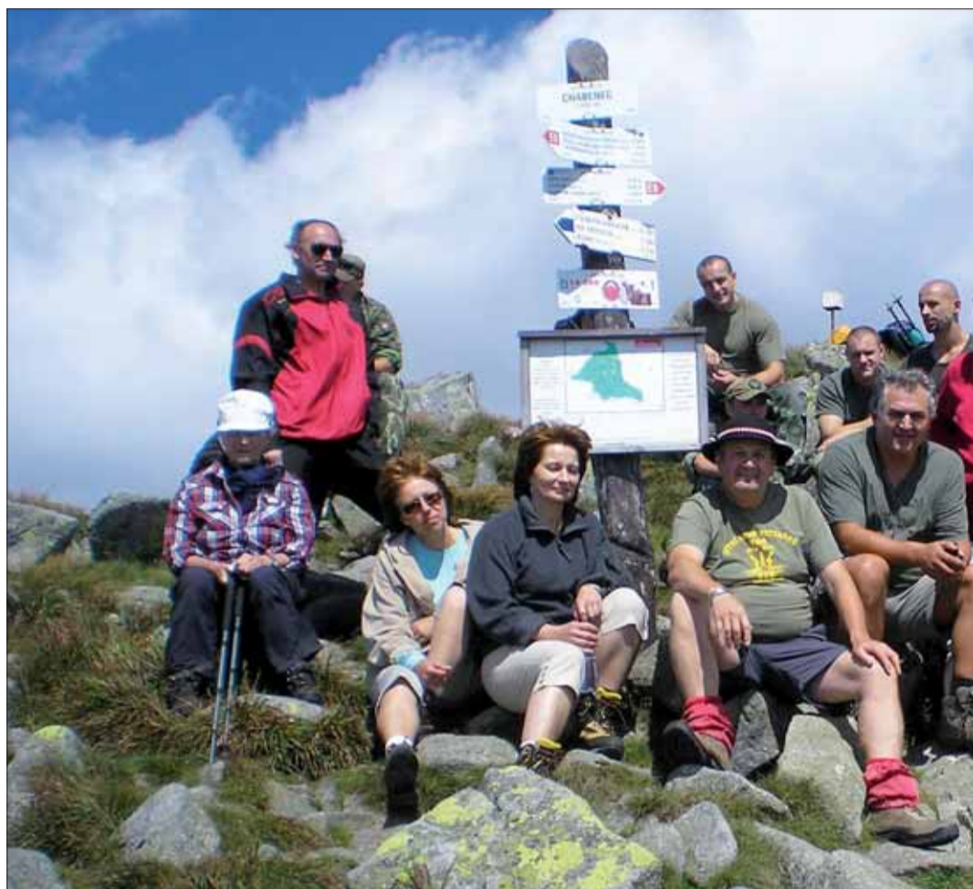
Na Chabenci sme sa srdečne pozdravili.