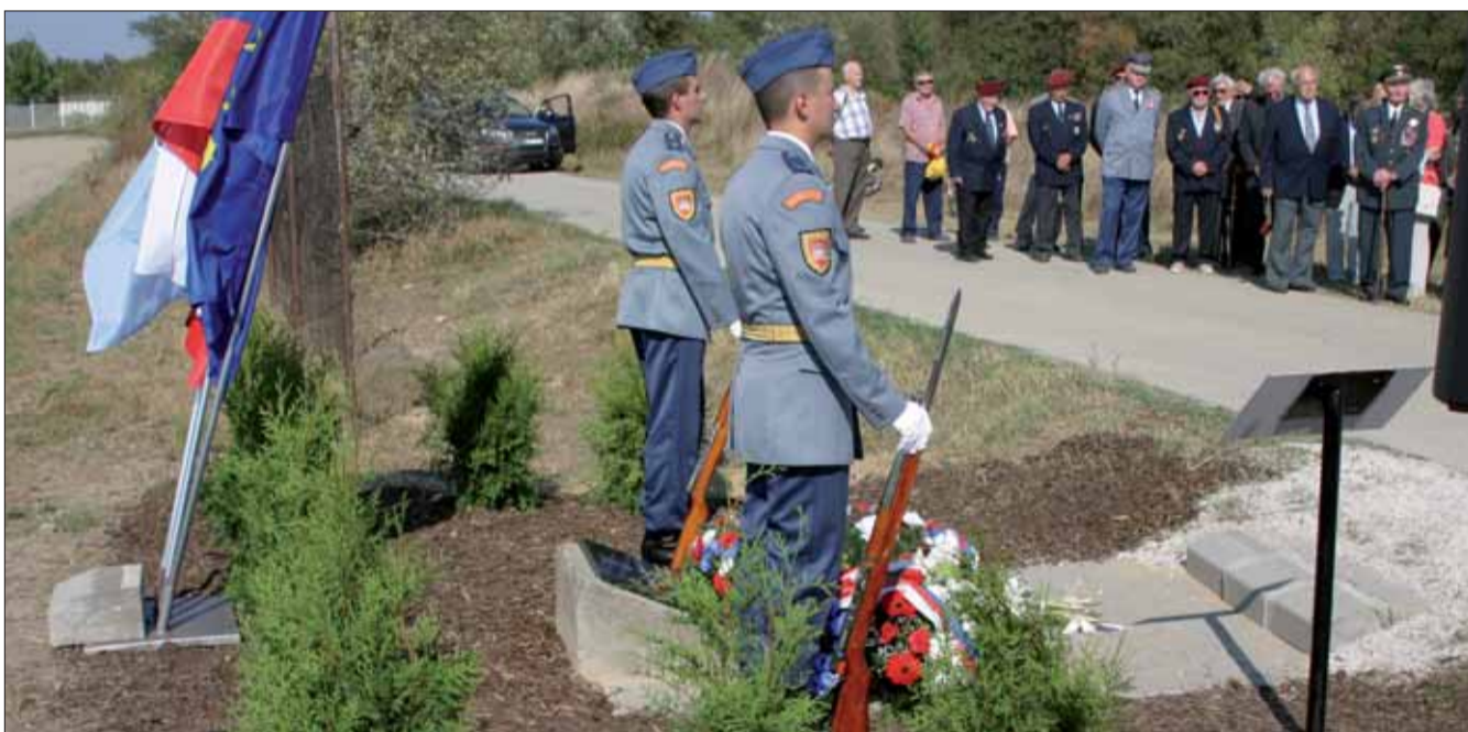
Pietny akt v Ivanke pri Dunaji.