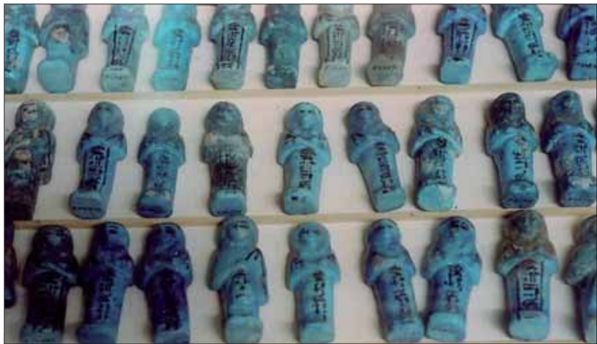
Sošky nájdené pri vykopávkach.

a Novej ríše. Pochádzajú od doby 3. dynastie (asi 2700 – 2270 pred Kristom) až po arabskú éru (4. storočie pred Kristom). Jeho zakladateľom bol Augusto Mariette Paša, ktorý ho pre verejnosť otvoril 18. októbra 1863.