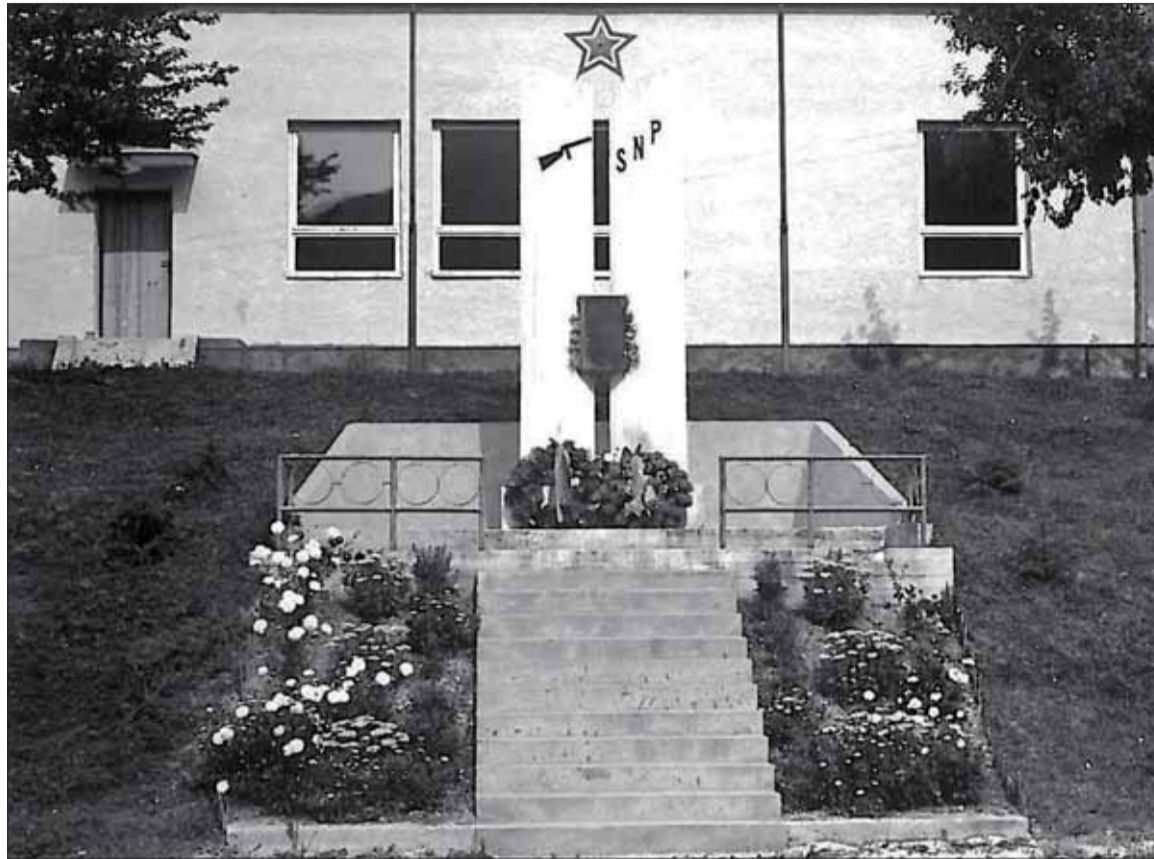
Pamätník padlým občanom v obci Bodiná v čase 2. svetovej vojny a v SNP.