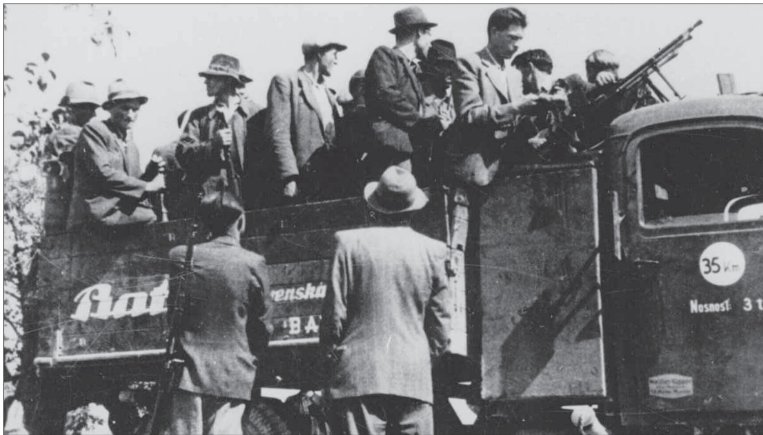
Dobrovoľníci idú do SNP