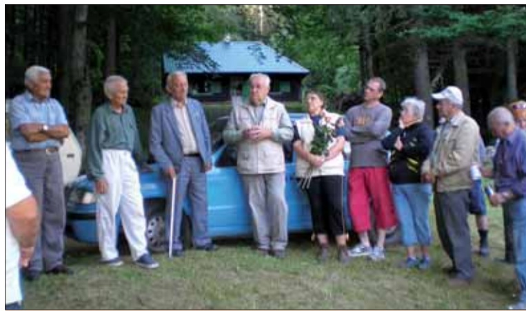
Účastníci výstupu na Chabenec.