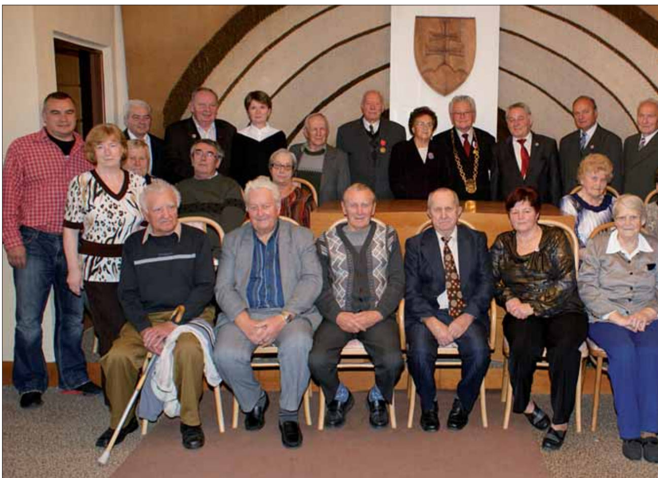
Účastníci schôdze v Lehote pod Vtáčnikom.