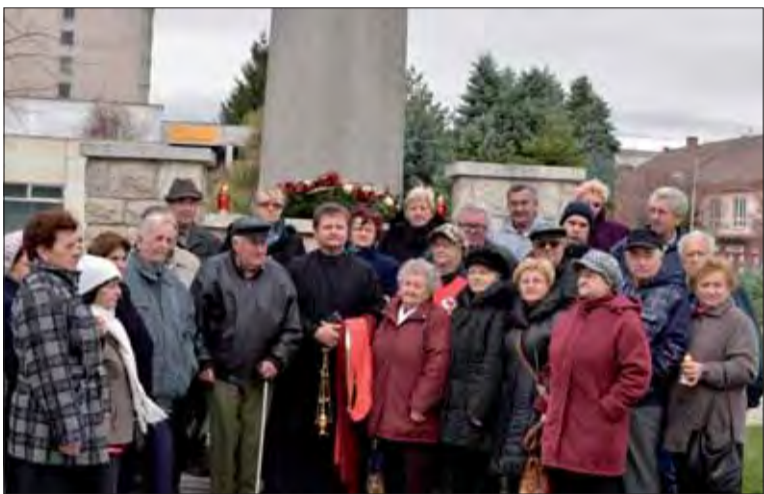
Účastníci pietnej spomienky v Strážskom.