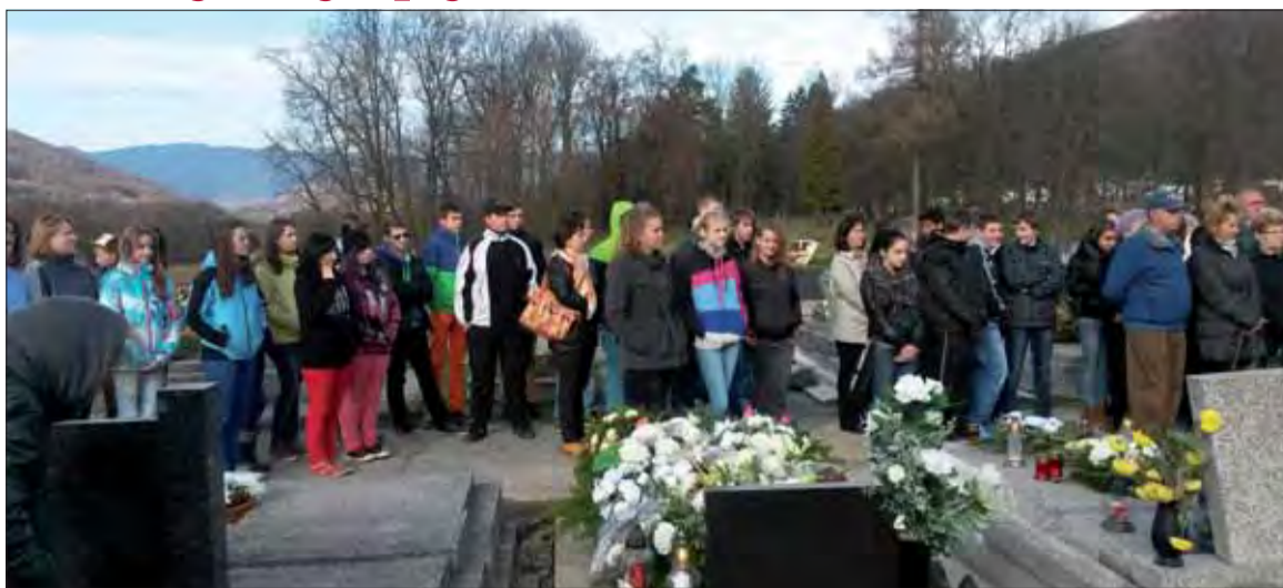
Aj v Revúcej spomínali na padlých bojovníkov.