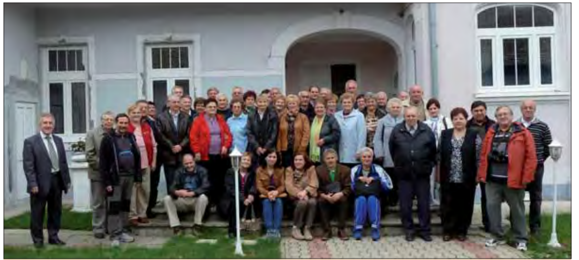
Spoločná fotografia pred domom Matice Slovenskej v Báčskom Petrovci.

Prvé mesto, ktoré sme navštívili, bol Báčsky Petrovec, ktorý je kultúrnym a administratívnym centrom dolnozemskej Slovákov. Prvá návšteva viedla do domu Matice slovenskej, kde nás