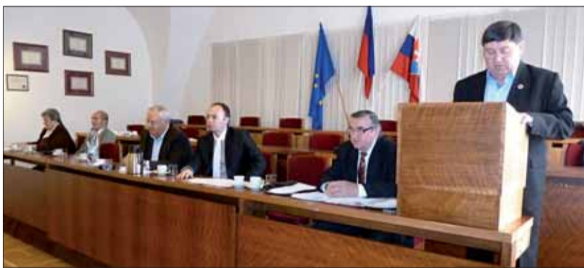
Zasadnutie OblV SZPB v Bardejove.