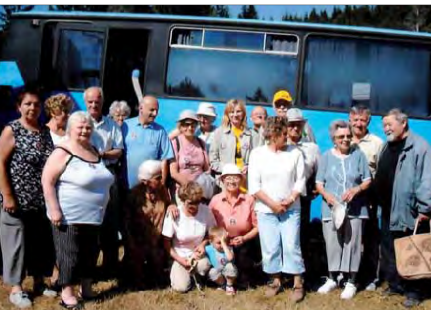
ZO SZPB Bojovníci na Kališti 2013.