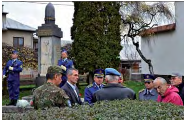
Na Sliachi si tiež pripomenuli Deň červených makov.

vavej bitke o belgické mestečko Ypres. Táto báseň sa neskôr stala inšpiráciou učiť z kvetu divého maku symbol obetí tohto dovtedy najväčšieho vojnového konfliktu a je nerozlučne spätá s tradíciou pripomínania si dňa 11. novembra ako Dňa pamäti, Dňa červených