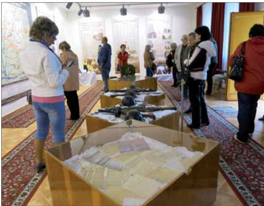
Bratislavčania sa vybrali po stopách národnooslobodzovacích bojov na južnom Slovensku.