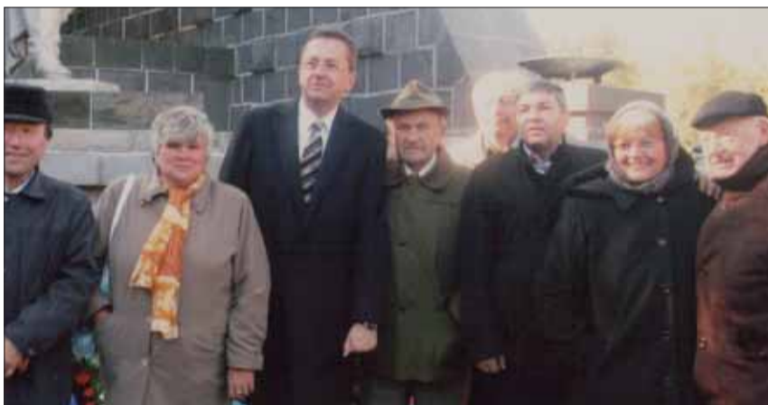
Výročie Dukly si pripomenuli aj Muráncania.