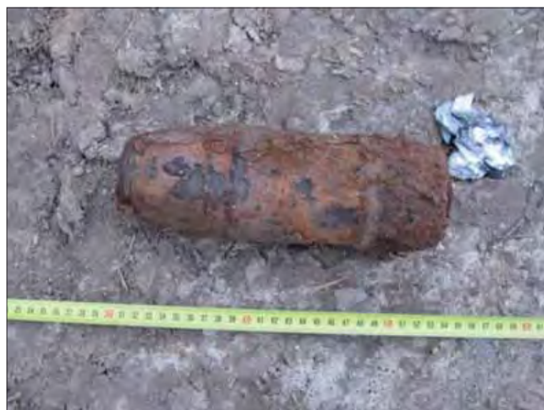
Vojnovú muníciu našli pri cintoríne.

Polícia miesto nálezu zaistila a privolaný pyrotechnik uviedol, že ide o delostrelecký granát kalibru 85 milimetrov z obdobia 2. svetovej vojny. „Muníciu následne prevzal na zneškodnenie,“ dodal hovorca. Red TASR