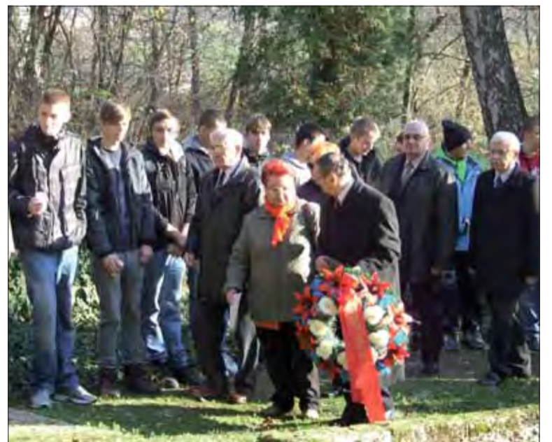
Na pietnej spomienke nechýbali ani študenti.