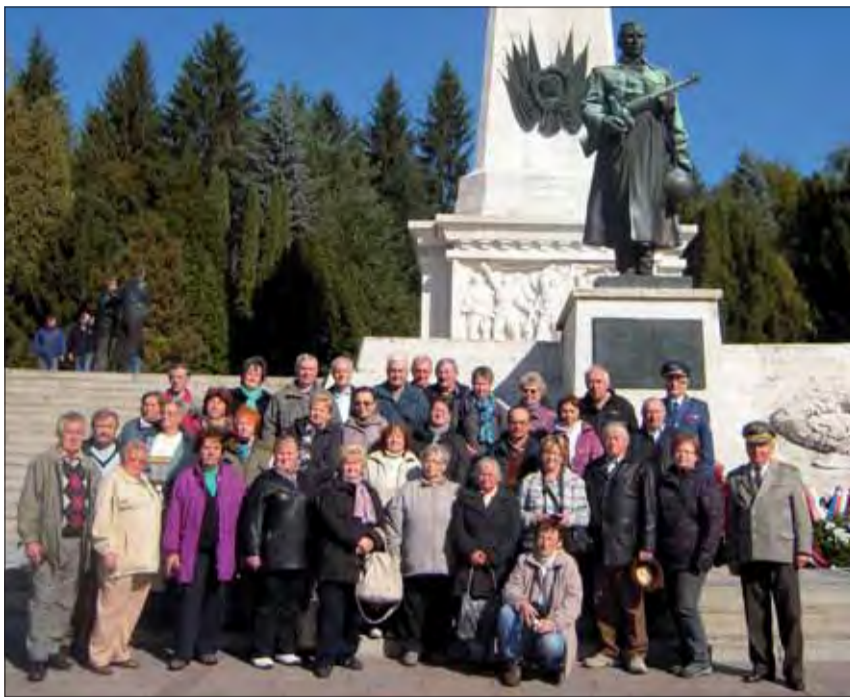
Spoločné foto účastníkov zájazdu pri Pamätníku sovietskej armády vo Svidníku.