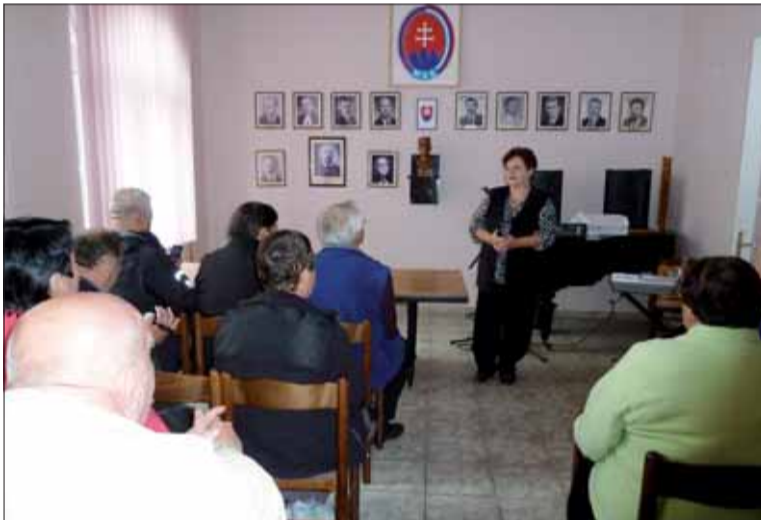
Beseda v dome Matice Slovenskej v Báčskom Petrovci.