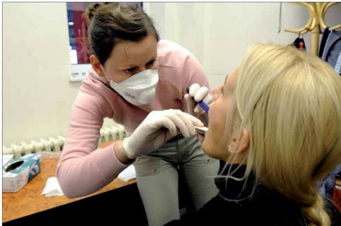
Chrípka je zasa infekčné ochorenie vyvolané vírusom.

Protichrípkovú vakcínu je možné podať každej osobe (okrem kontraindikovaných osôb uvedených v príbalovom letáku vak-