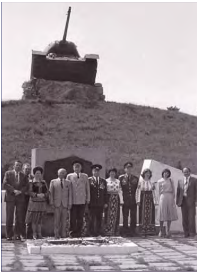
Pri Kurgane slávy.