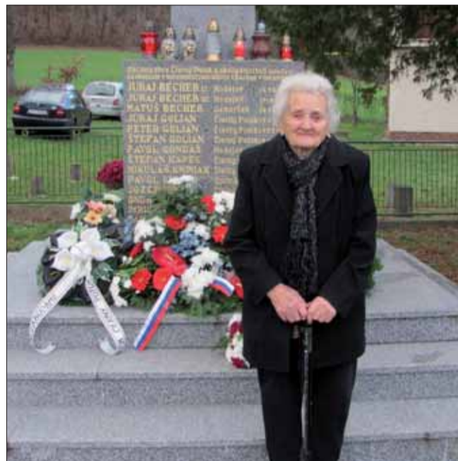
Na spomienkovom stretnutí v Čiernom Potoku spomínali aj tí, ktorí si druhú svetovú vojnu pamätajú.