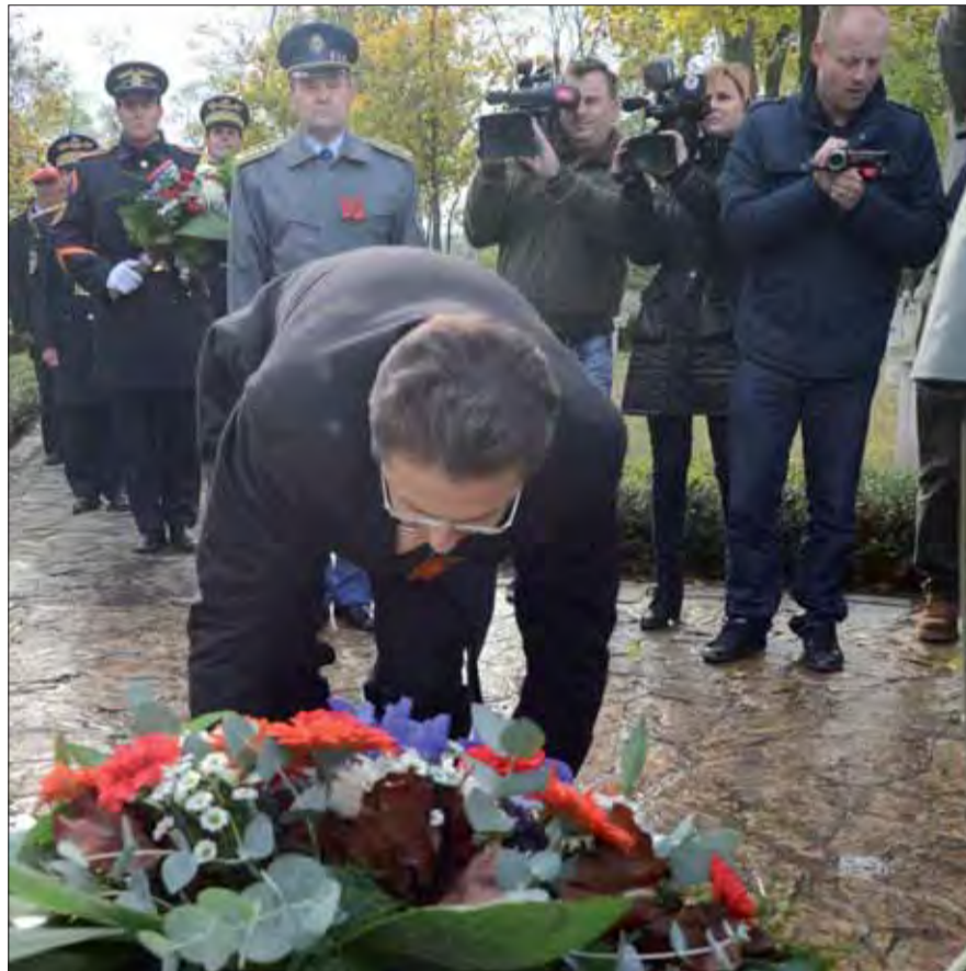
Minister obrany SR Martin Glváč si v pondelok 11. novembra 2013 pripomenul počas pietnej spomienky na vojnovom cintoríne v Petržalke – Kopčanoch Deň vojnových veteránov.

Pietna spomienka sa konala v nedeľu 10. novembra aj pri pamätníku účastníkom a obetiam západného odboja v 2. svetovej vojne. Kamenný pamätník je v parčíku na Šafárikovom námestí. Účastníkom pietnej spomienky sa prihovoriť štátny tajomník