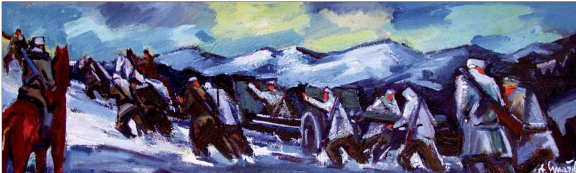
Vpred za slobodu! I, prechod Veľkou Fatrou – olej 1974.