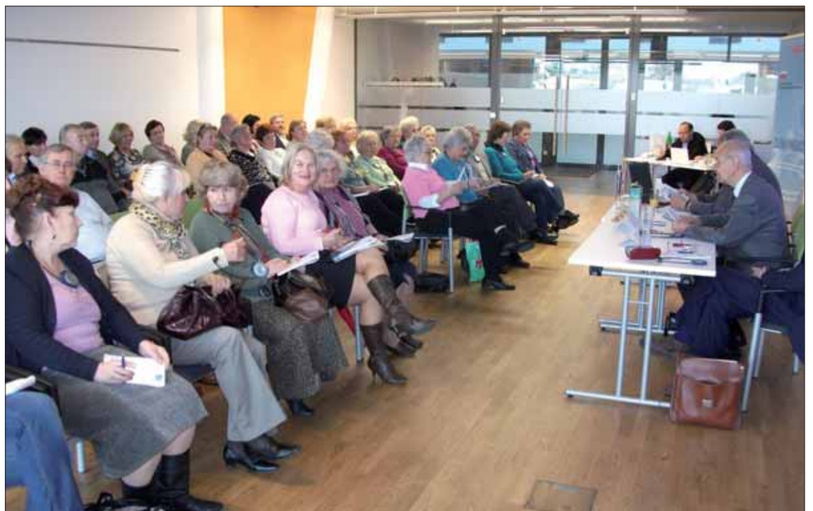
Účastníci seminára o dôchodkoch vo Viedni.