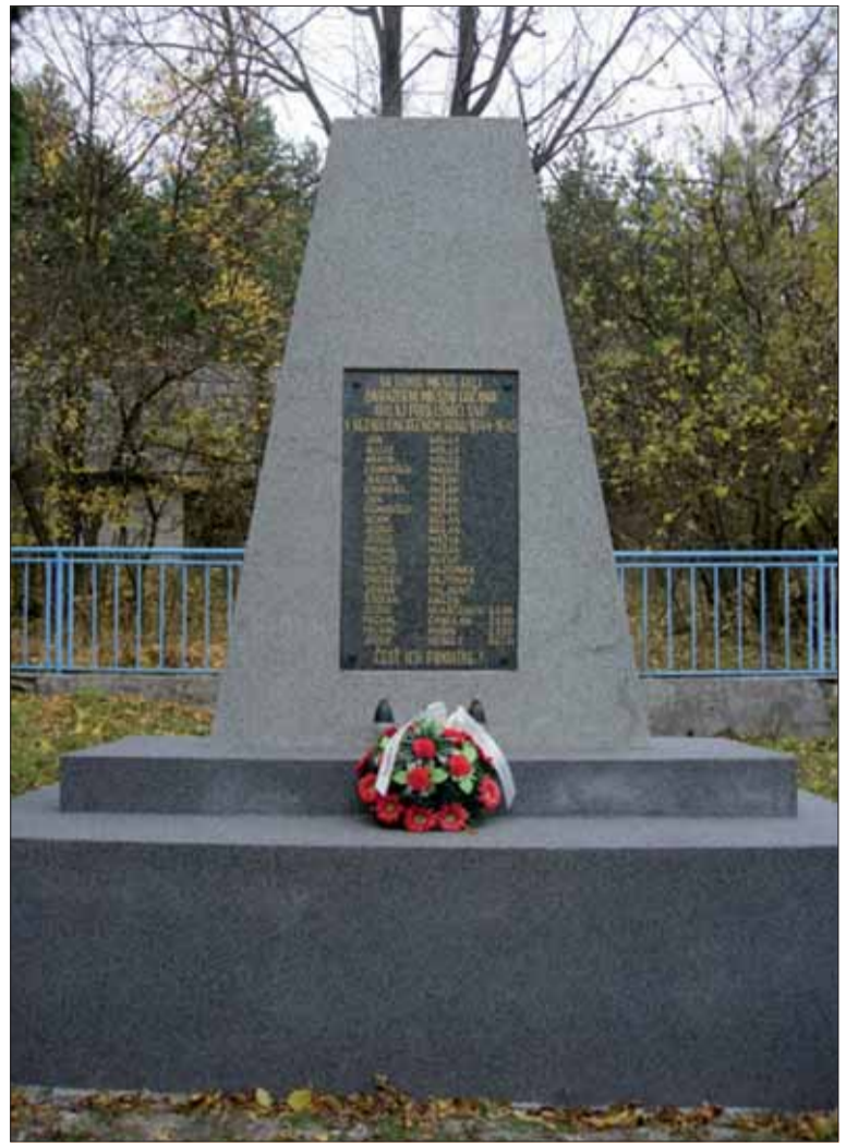
Zavraždených miestnych občanov pripomína dodnes pamätník.