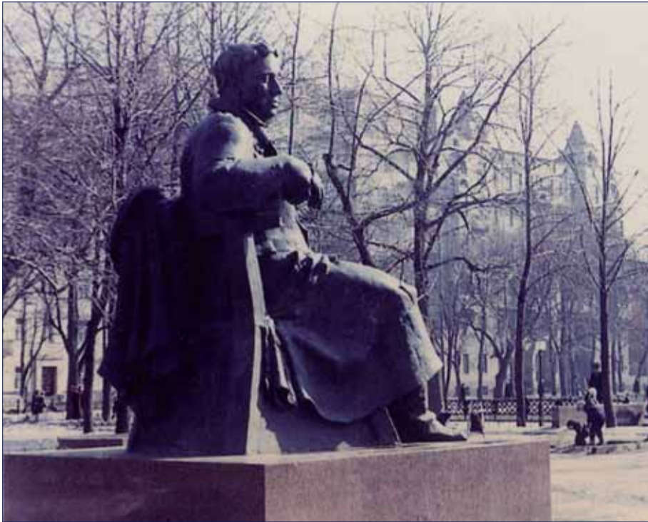
Pamätník I. A. Krylova v Moskve.

vost, lev silu a pod.). V nich nám autori predkladajú mravné alebo praktické poučenia. Majú dávnu tradíciu u orientálnych národov, zvlášť indických a arabských. Iste každému zostal v pamäti grécky bájkar Ezop, ktorý žil v 6. storočí