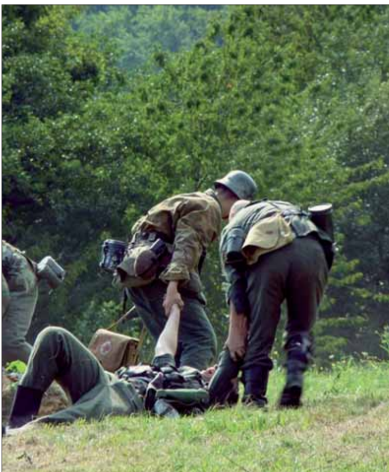
Deti často nevedia pri ukážkach bojov rozoznať, ktorí vojaci sú ktorí.