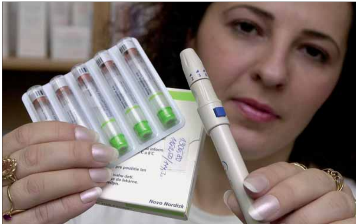
Detail jedného balenia náplní injekčnej suspenzie ľudského inzulínu a jeden z viacerých typov aplikátora.

Diabetes je charakterizovaný hlavne intenzívnym smädom, častým nutkaním na močenie, do-