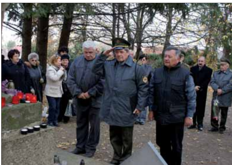
Pietna spomienka v Nitre.