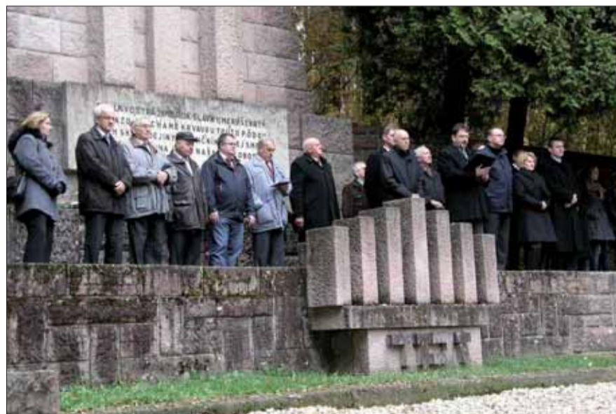
Pietna spomienka v Kremničke.