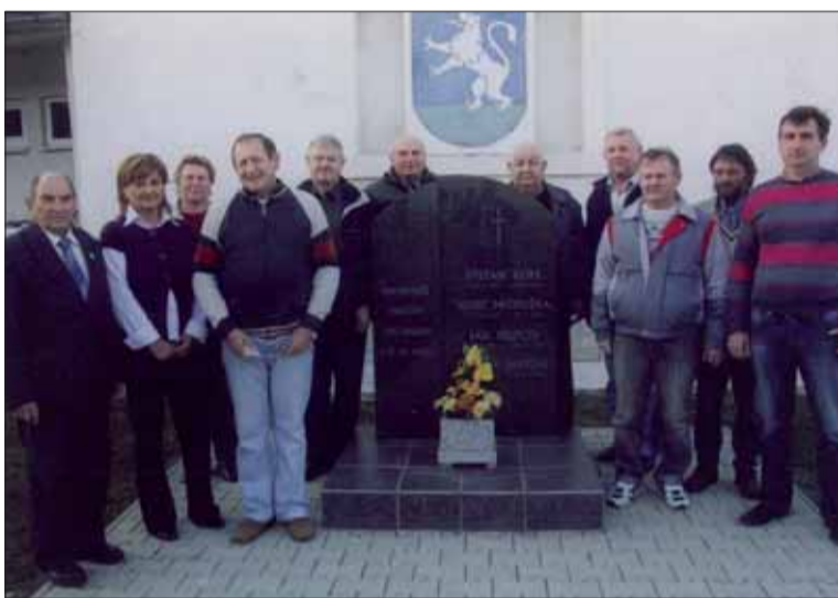
Staškovčania vzdali hold pri pamätníku padlým.