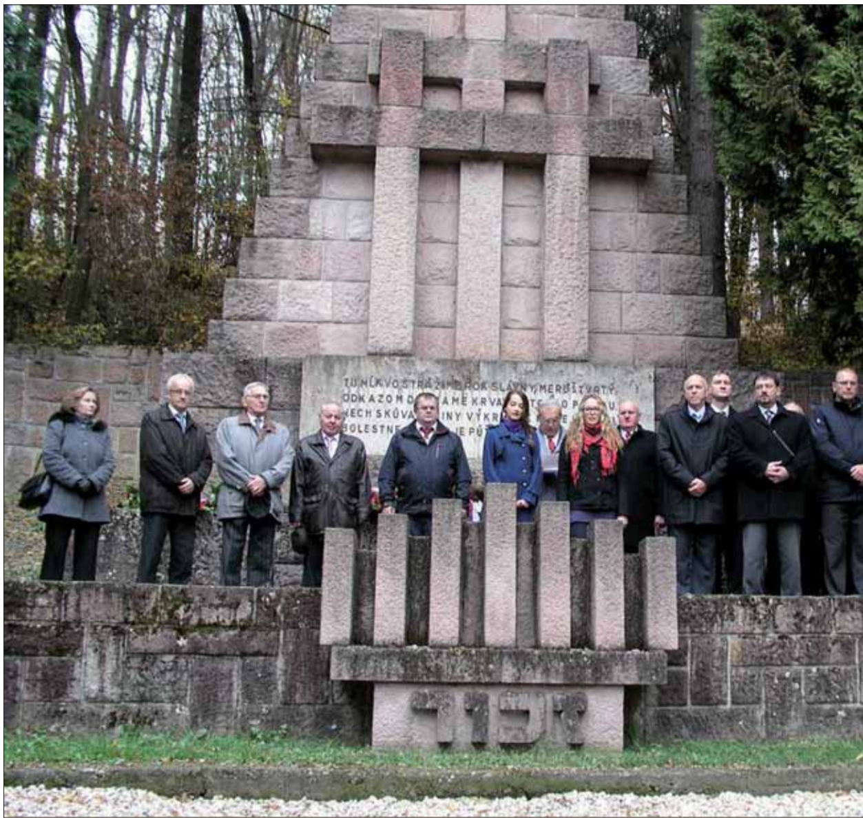
Vyvražďovanie v Kremničke si SZPB pripomína každý rok.