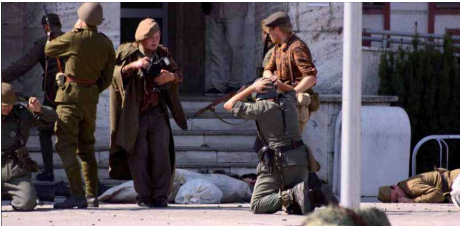
Dnes sa mládež dozvedá o vojne aj vďaka rekonštrukciám bojov.

smiali nielen žiaci, ale i samotná učiteľka. Koľko rokov mala táto mladá učiteľka, keď sa bojovalo pri Stalingrade? Ako sa dokázala vysmievať tisíckam mŕtvych, trvalých invalidov, ktorí platili za