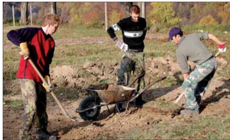
Brigáda vo Veľkrope.

„V tomto roku sme uzavreli rekonštrukciu dvoch vojnových cintorínov, a to v Palote neďaleko Medzilaboriec a v obci Stebník v Bardejovskom okrese. S ich obnovou sme začali v roku 2009,“ doplnil